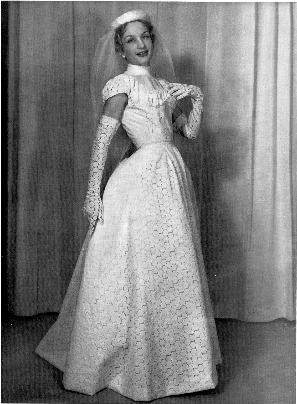
CHARLES MONTAIGNE Batiste brodée de Reichenbach & Co., Saint-Gall Montex, Paris