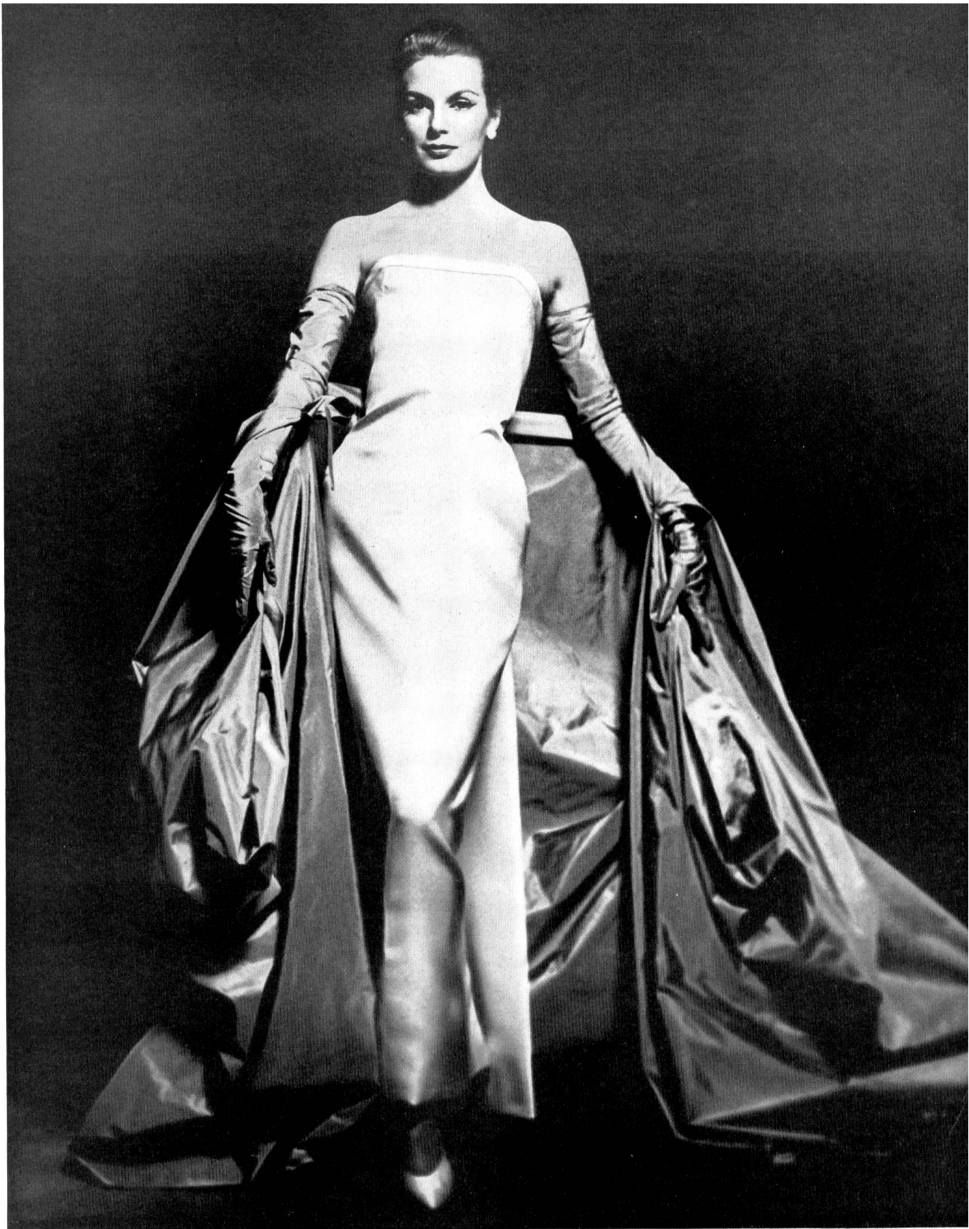
HUBERT DE GIVENCHY Satin double face de L. Abraham & Cie, Soieries S.A., Zurich