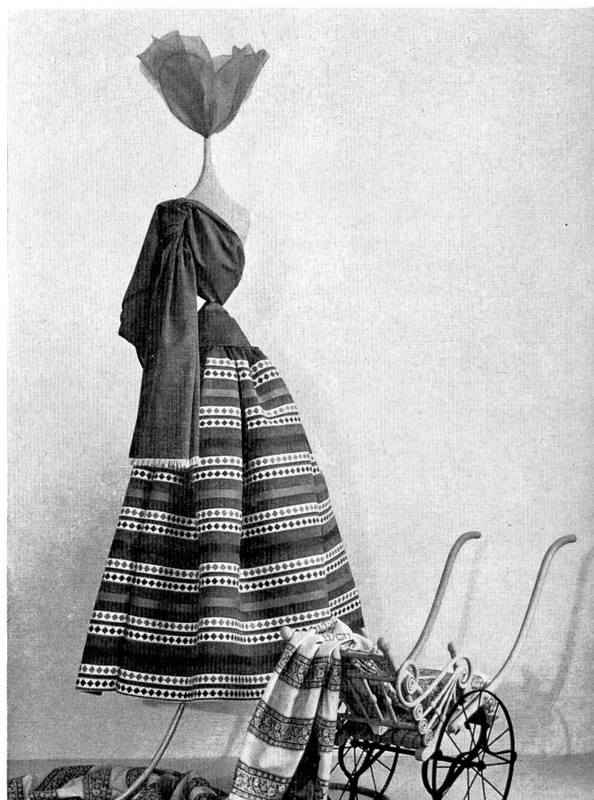
METTLER & CIE S. A., SAINT-GALL Woven Jacquards.

Die jugendlichen Kunden kaufen mit Vorliebe zeitig und beginnen schon im April mit dem Tragen von Baumwollkleidern, teils in der Hoffnung, die schönere Jahreszeit schneller kommen zu sehen, teils auch, weil sie sich leichter von den lebhaften Farben der Frühlingstoiletten anlocken und verführen lassen. Kaufhäuser sowie Spezialgeschäfte haben diesen Sommer die Erfahrung gemacht, daß «separates» von apertem Genre und lebhaften Farben den größten Erfolg hatten, daß dagegen die Frauen vorgeschrittenen Alters, obwohl sie gleichfalls an frohen Farben und Modellen, die vom Ausland kommen, Gefallen finden, einer großen Zahl von Artikeln, trotz guter Qualität und sorgfältiger Ausführung, interesselos gegenüberstehen, weil diese nichts Originelles und nichts Persönliches haben. Man stellt fest, daß das Publikum nur da zum Kaufe bereit ist, wo es Artikel von einer gewissen Eigenart vorfindet, und daß die Geschäfte, wo sich die Auswahl fast ganz auf Waren nach «jedermanns Geschmack» beschränkt, einen verringerten Absatz verzeichnen. Ich bin der festen Überzeugung, daß der Handel gegenwärtig von der Frau des Mittelstandes bestimmt