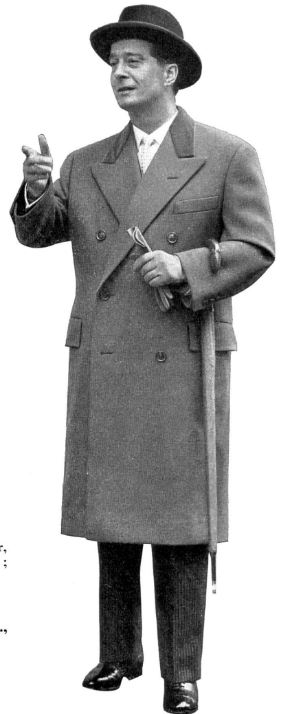
Schweiz : Zweireihiger, klassischer Überzieher; schweres, blaugraues, reinwollenes Shetland von