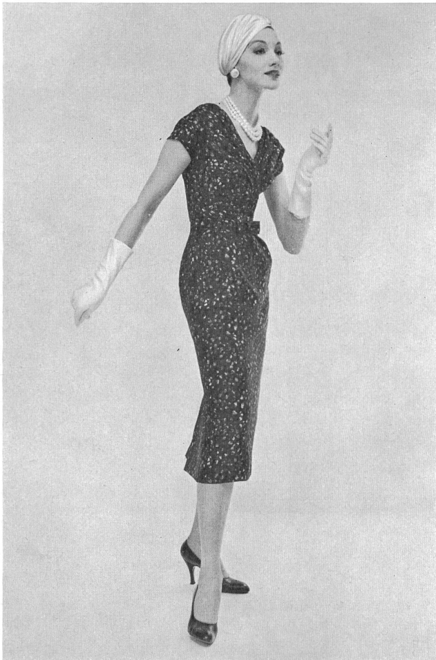
L. ABRAHAM & Co. SILKS Ltd., ZURICH