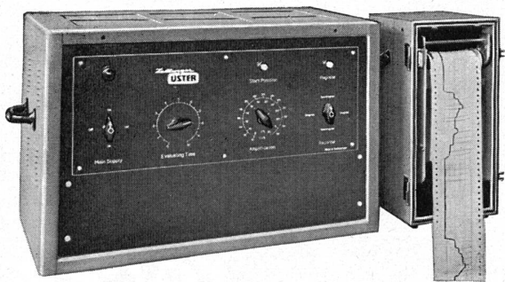
Der Spektrograph am «Uster» Gleichmässigkeitsprüfer ermöglicht eine rasche und genaue Analyse des Querschnittsverlaufes von Garnen.

Die Qualitätsprüfung der Garne für die Weberei ist ein sehr wichtiger Zweig der Prüftätigkeit, vor allem die