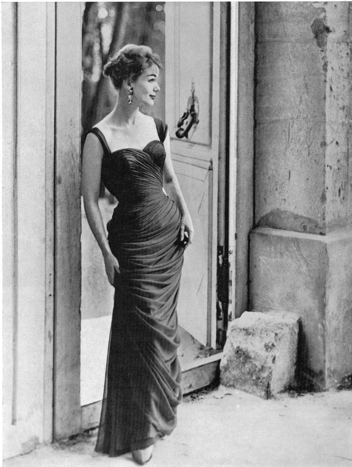
PIERRE BALMAIN Mousseline « Follette » de L. Abraham & Cie, Soieries S. A., Zurich