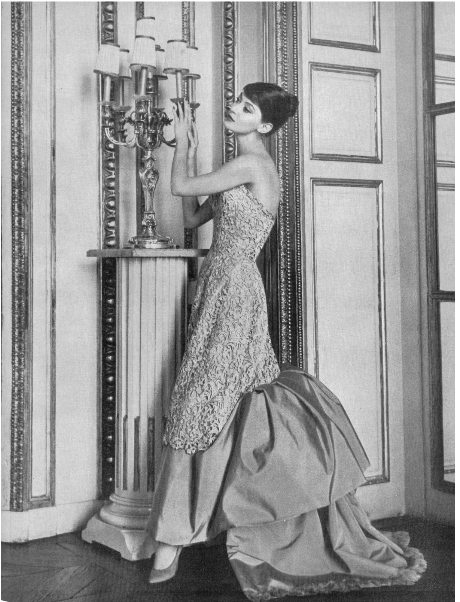
JEAN DESSES Guipure en lamé or de Forster Willi & Co., Saint-Gall Grossiste à Paris : Les Tisseurs B de M