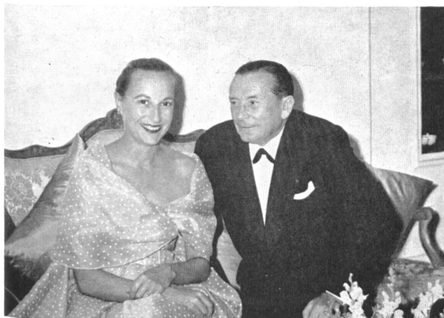
M. et Mme Lucien Lelong chez eux