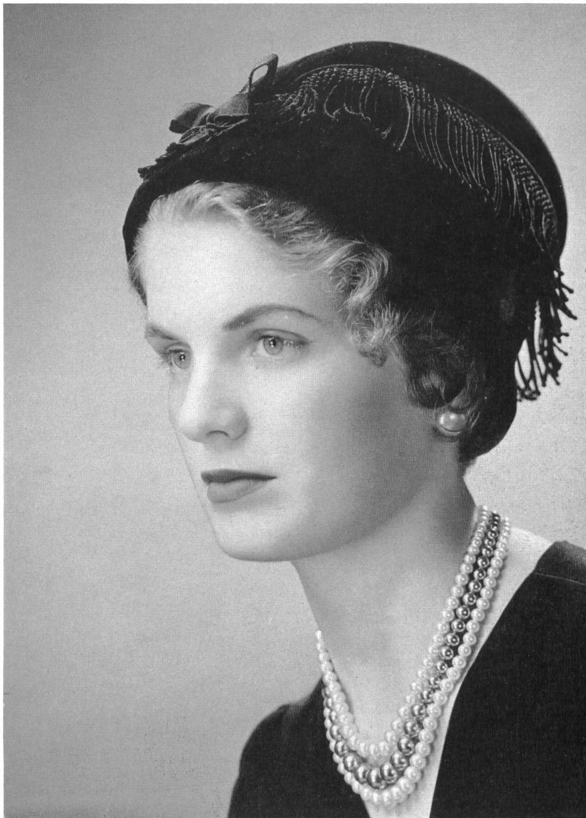
LANVIN CASTILLO Frange de guipure noire de Union S. A., Saint-Gall