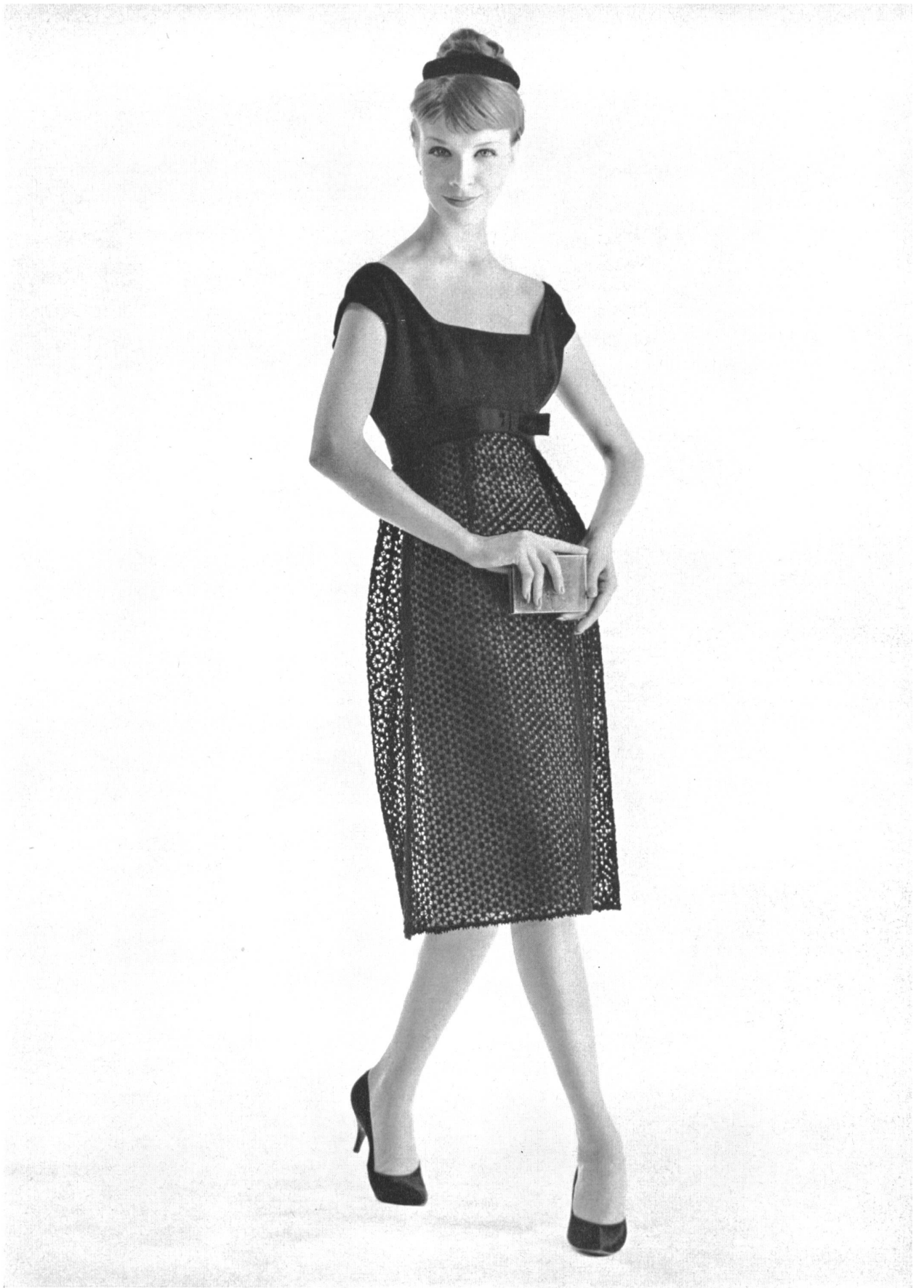
GUY LAROCHE Dentelle de laine de Forster Willi & Co., Saint-Gall Grossiste à Paris : Pierre Brivet S.à.r.l.

Modèles exclusifs – Reproduction interdite