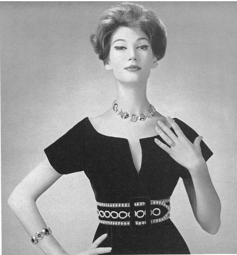
CHRISTIAN DIOR (Boutique) Galon en broderie or de Union S. A., Saint-Gall