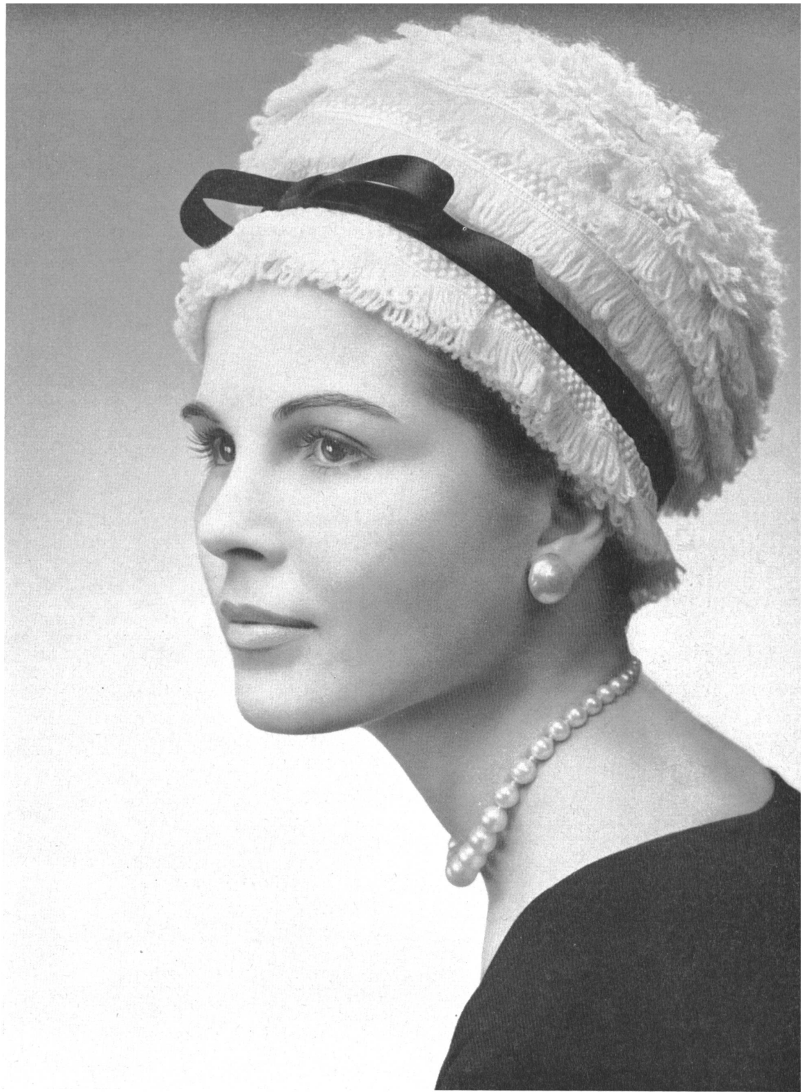
LANVIN CASTILLO Frange de laine brodée de Union S. A., Saint-Gall