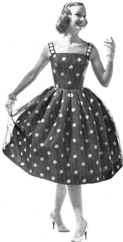
2. FORSTER WILLI & CO., SAINT-GALL

Organdi brodé blanc. White embroidered organdy.