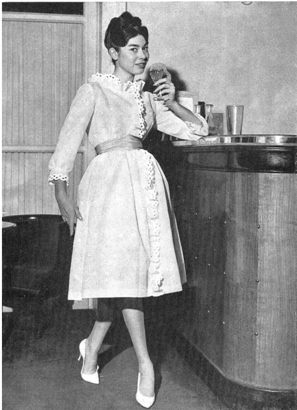
«RECO», REICHENBACH & CO., SAINT-GALL

Batiste brodée «Minicare» blanche. Embroidered white «Minicare» batiste. Modèle Bellerive, Nice.