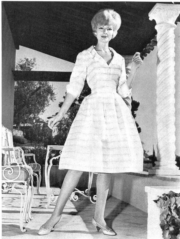
«RECO», REICHENBACH & CO., SAINT-GALL

Batiste brodée «Minicare» blanche. Embroidered white «Minicare» batiste. Modèle Bellerive, Nice.