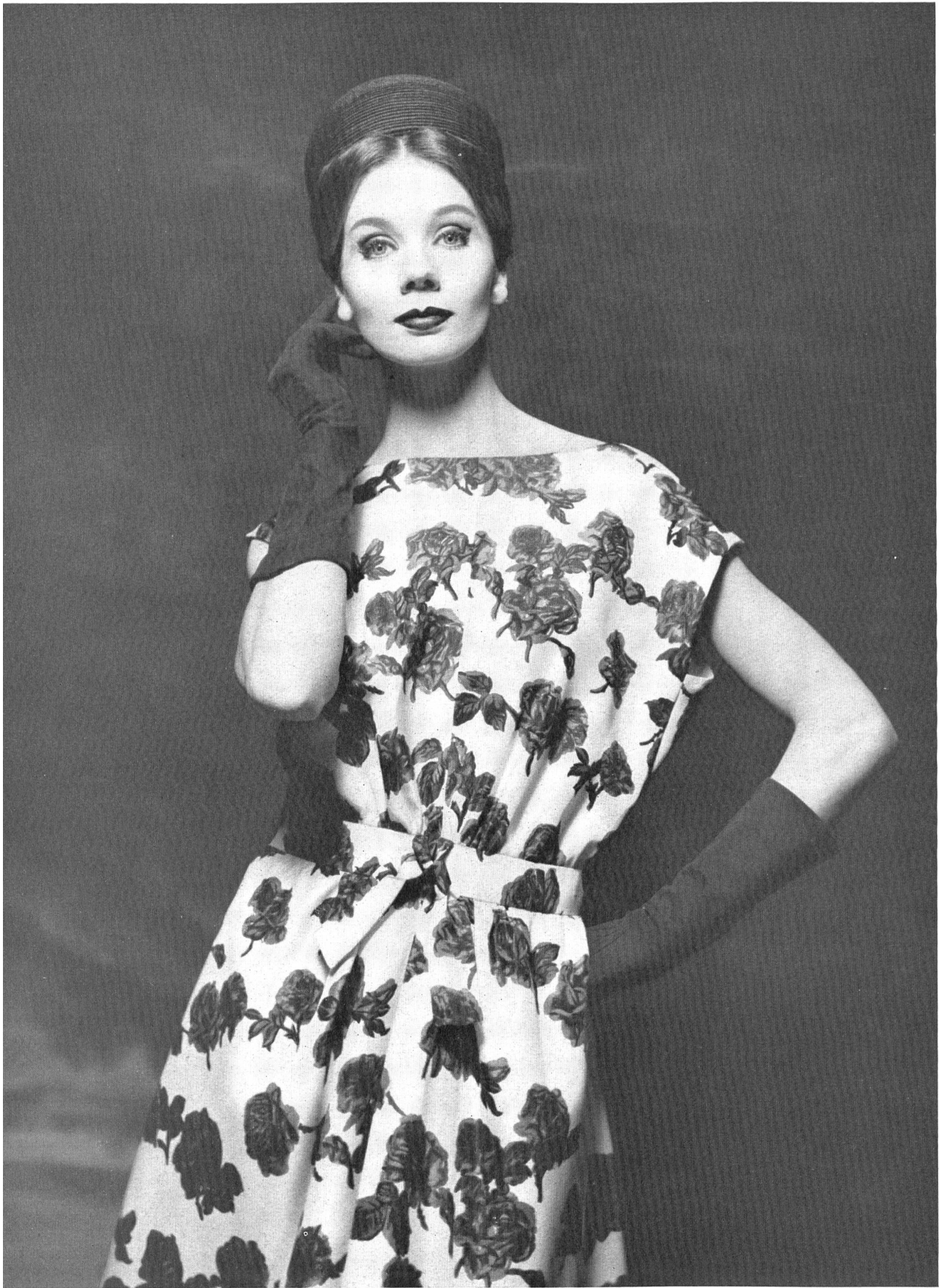
HUBERT DE GIVENCHY