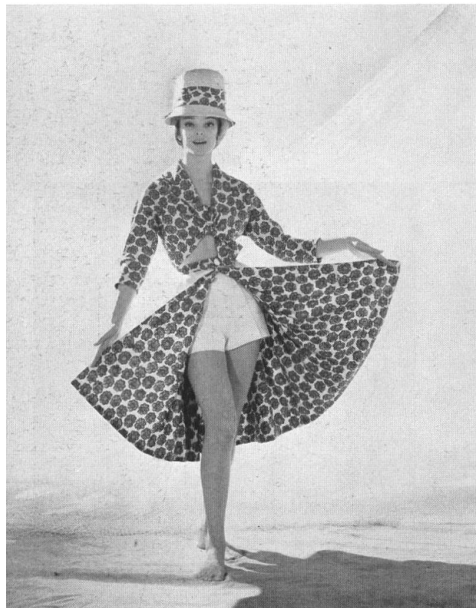
A. BLUM & CO., ZÜRICH

Trois-pièces en « Tri-co-tiss » d'orlon