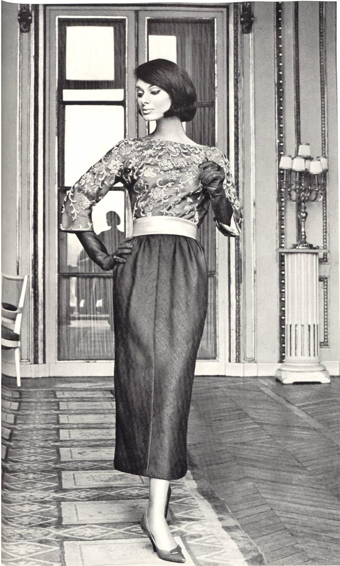
JACQUES HEIM Tissu «Kolibri» (soie naturelle) de Heer & Cie S.A., Thalwil Grossiste à Paris : Robert Burg & Cie