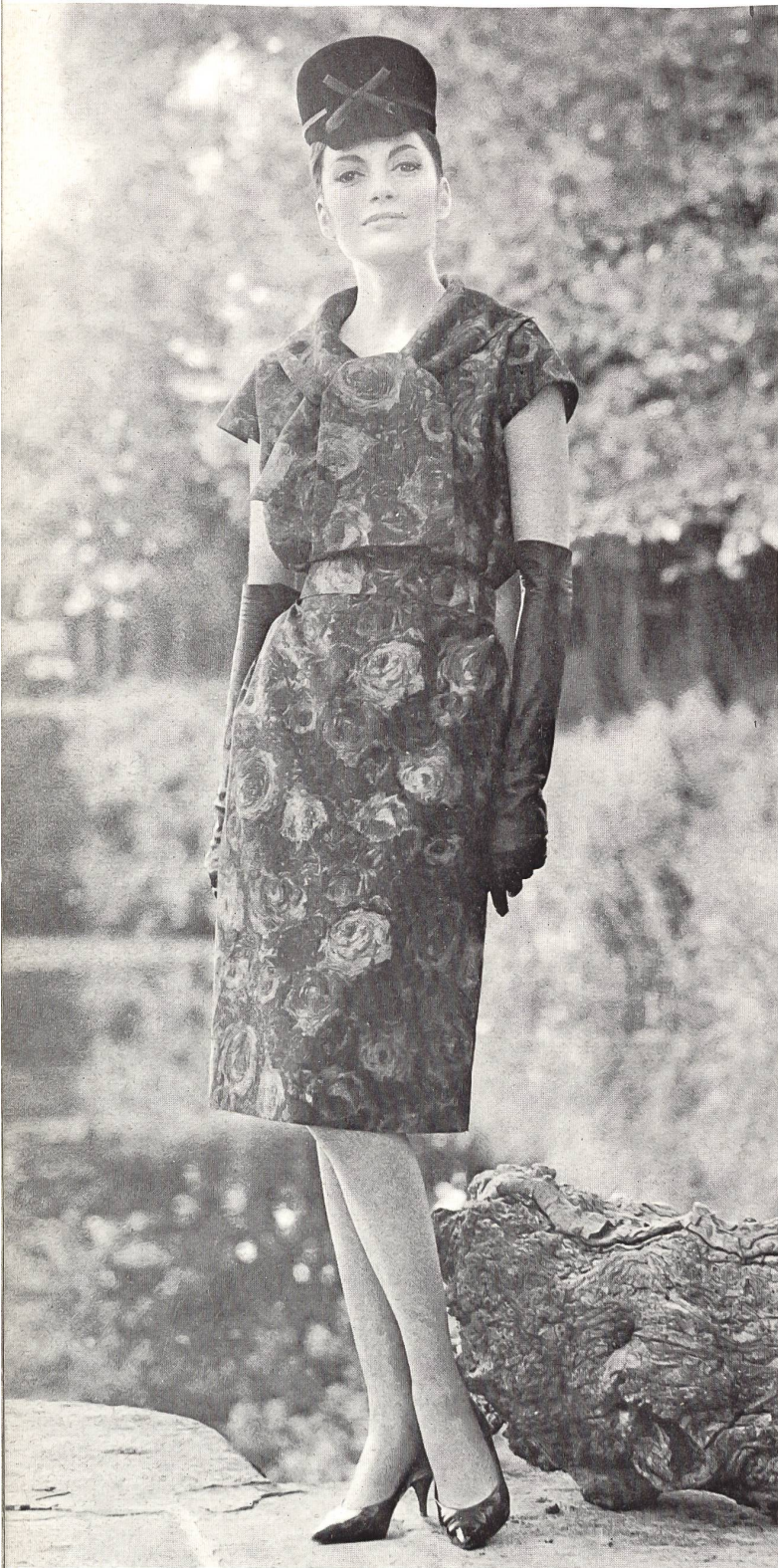
PIERRE CARDIN Soielaine « Miranda » de Reichenbach & Co., Saint-Gall Distribué par Montex, Paris