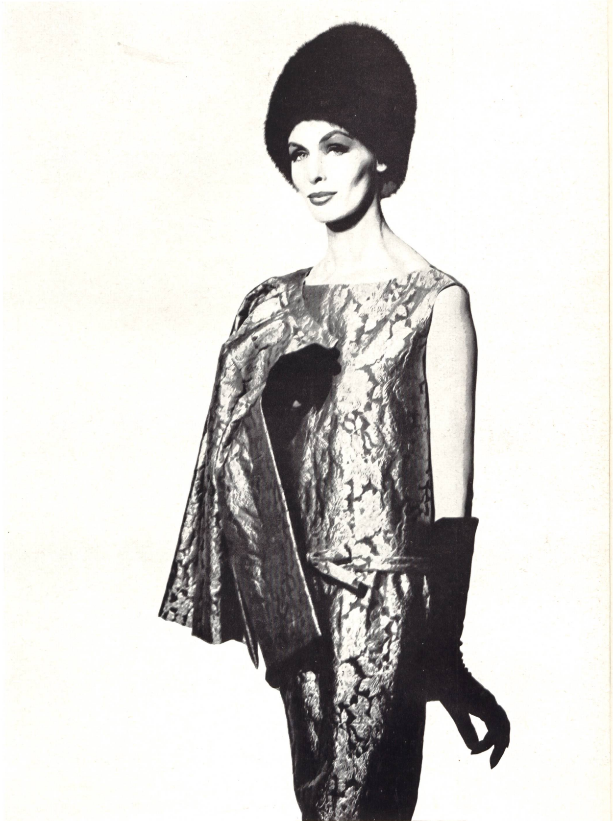
CHRISTIAN DIOR « Aragone » métal de L. Abraham & Cie, Soieries S. A., Zurich

MODÈLES EXCLUSIFS — REPRODUCTION INTERDITE