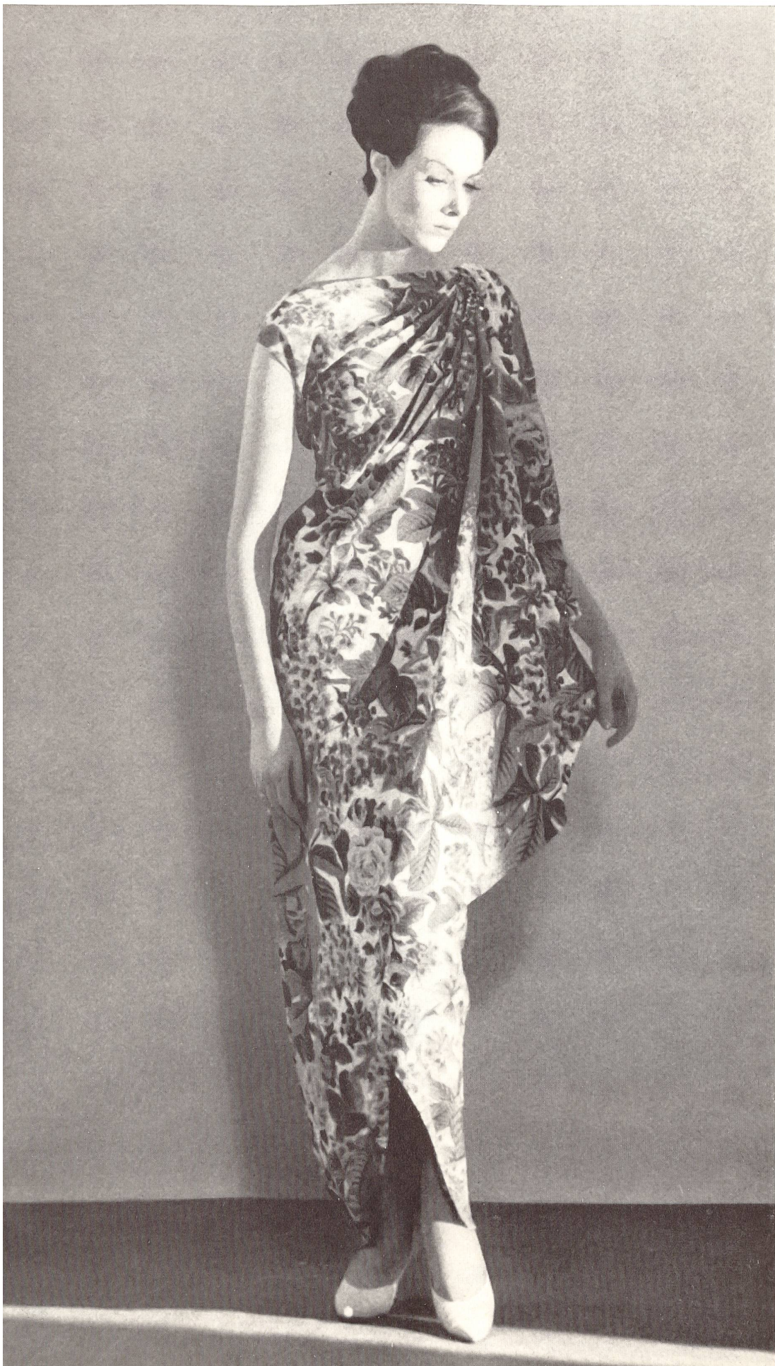
PIERRE BALMAIN « Basra » brodé de L. Abraham & Cie, Soieries S. A., Zurich