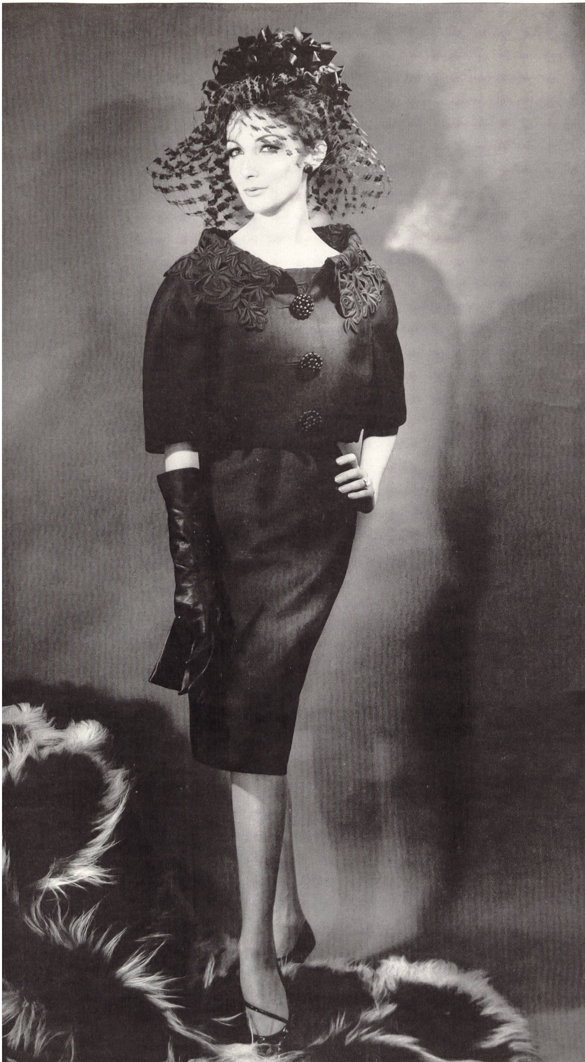
BERNARD SAGARDOY Broderie noire découpée de Union S. A., Saint-Gall Grossiste à Paris: Robert Burg & Cie