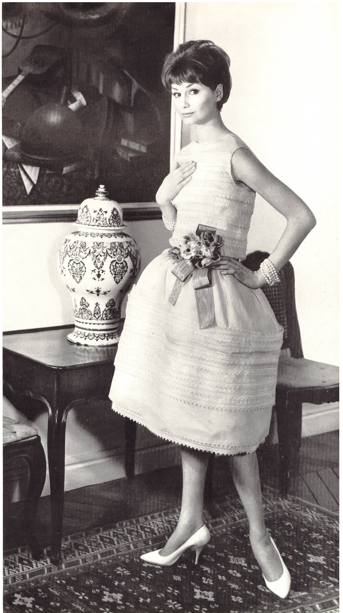
CHRISTIAN DIOR Organdi brodé de Forster Willi & Co., Saint-Gall