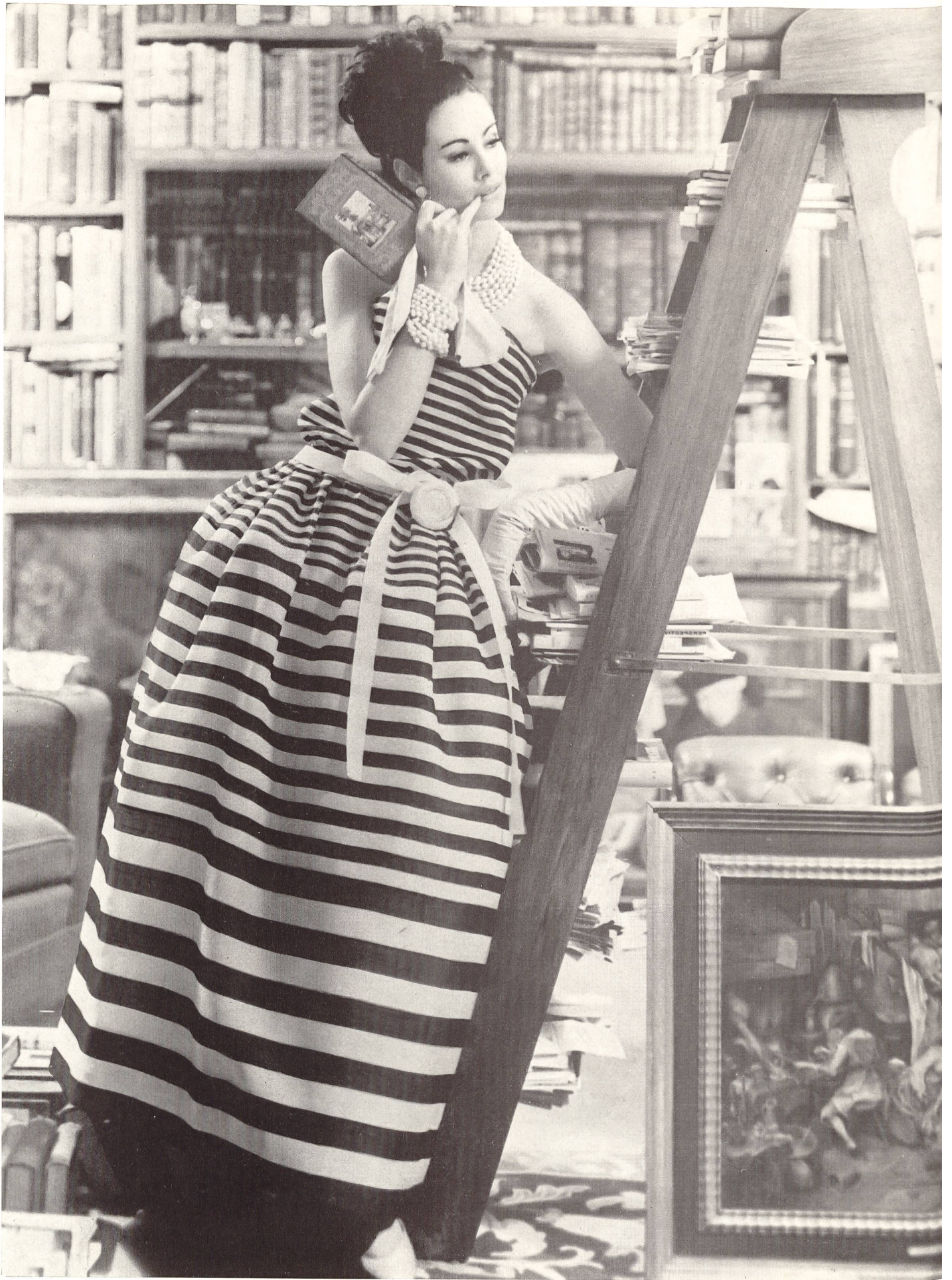
CHRISTIAN DIOR « Gazar » rayé de L. Abraham & Cie, Soieries S. A., Zurich