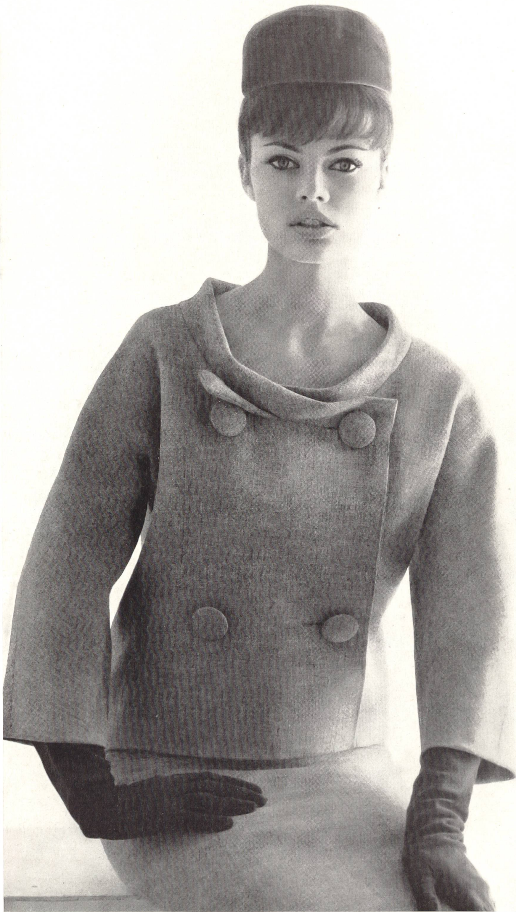
PIERRE CARDIN « Shetty fashion fil » des Tissages de soieries Naef Frères S. A., Zurich