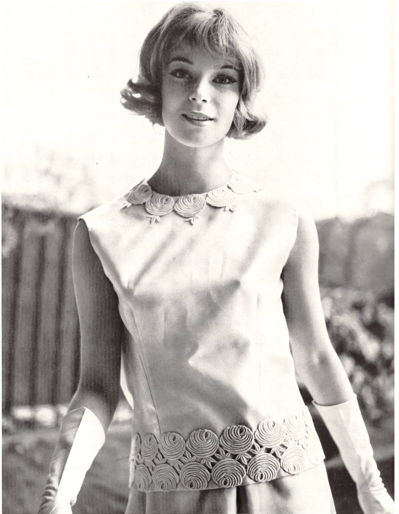
BERNARD SAGARDOY Bande de guipure de Jacob Rohner S. A., Rebstein