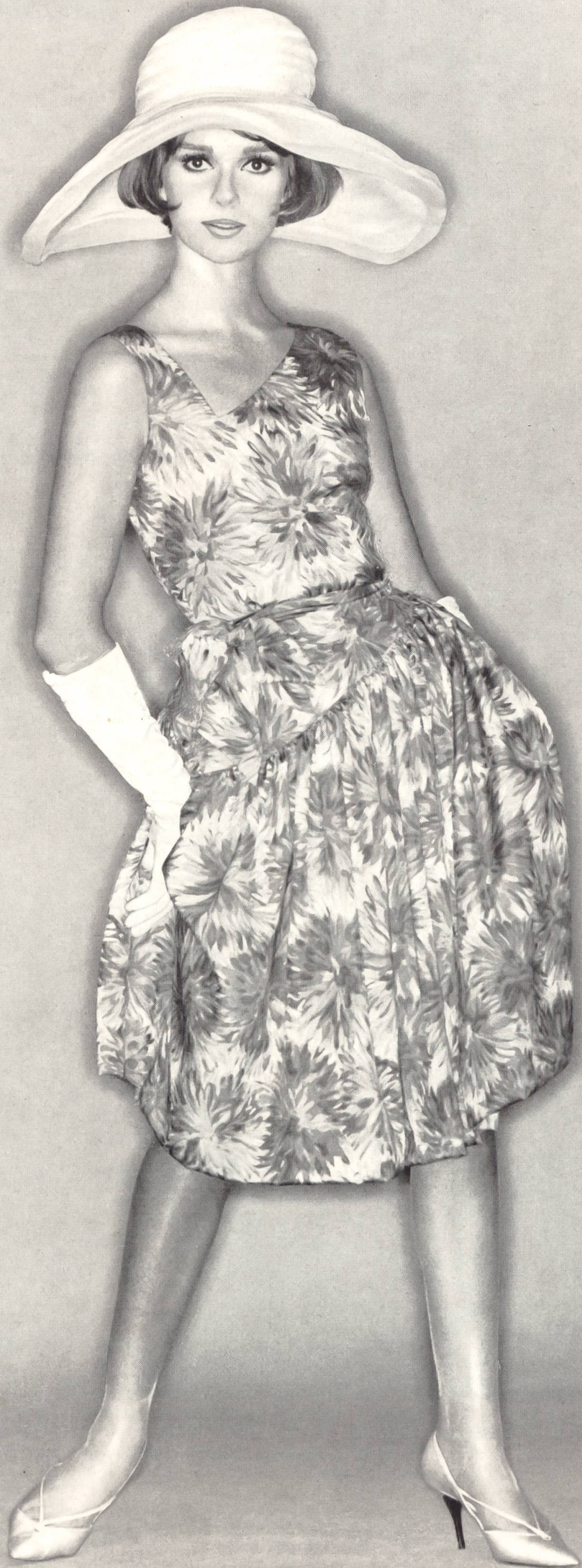
MAGGY ROUFF Tissu pure soie « Manina » de Robt. Schwarzenbach & Co., Thalwil