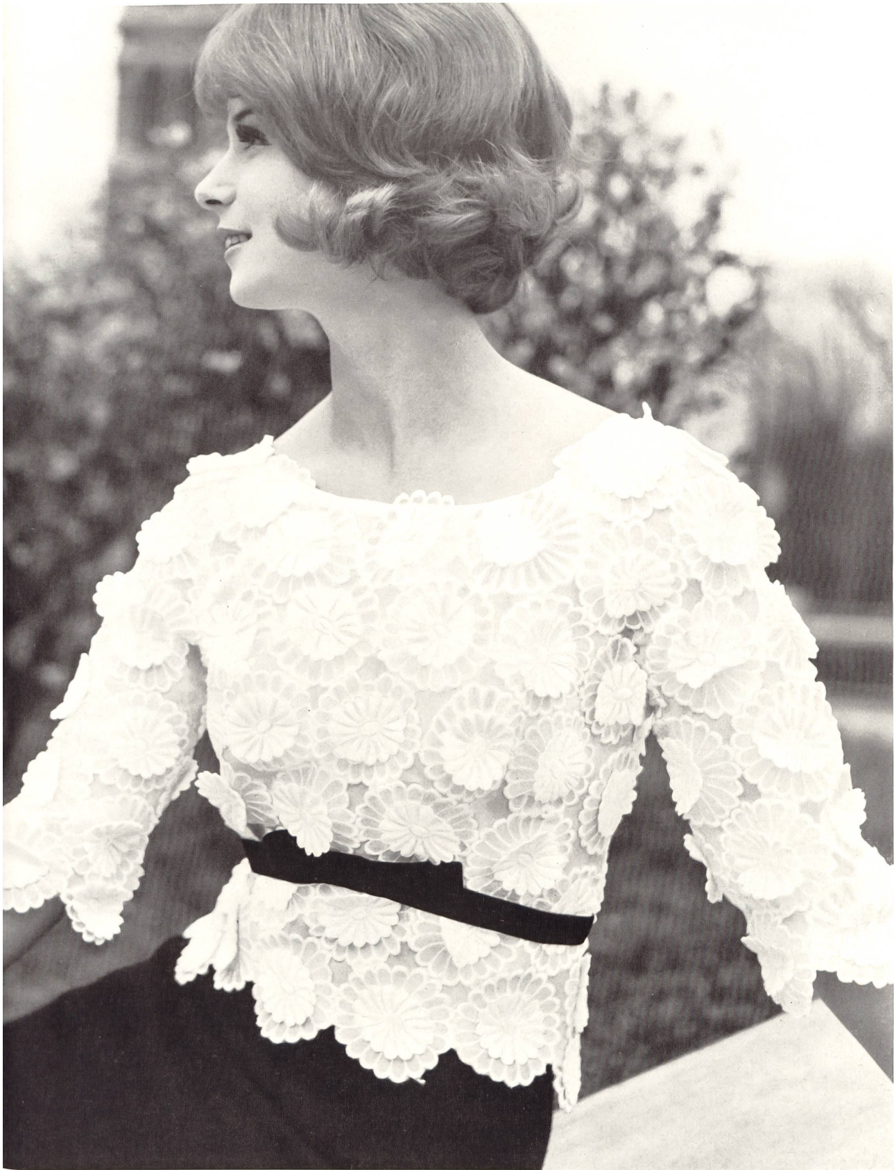
JACQUES HEIM Broderie «Nelo» appliquée sur organdi de J. G. Nef & Co. S. A., Hérissau