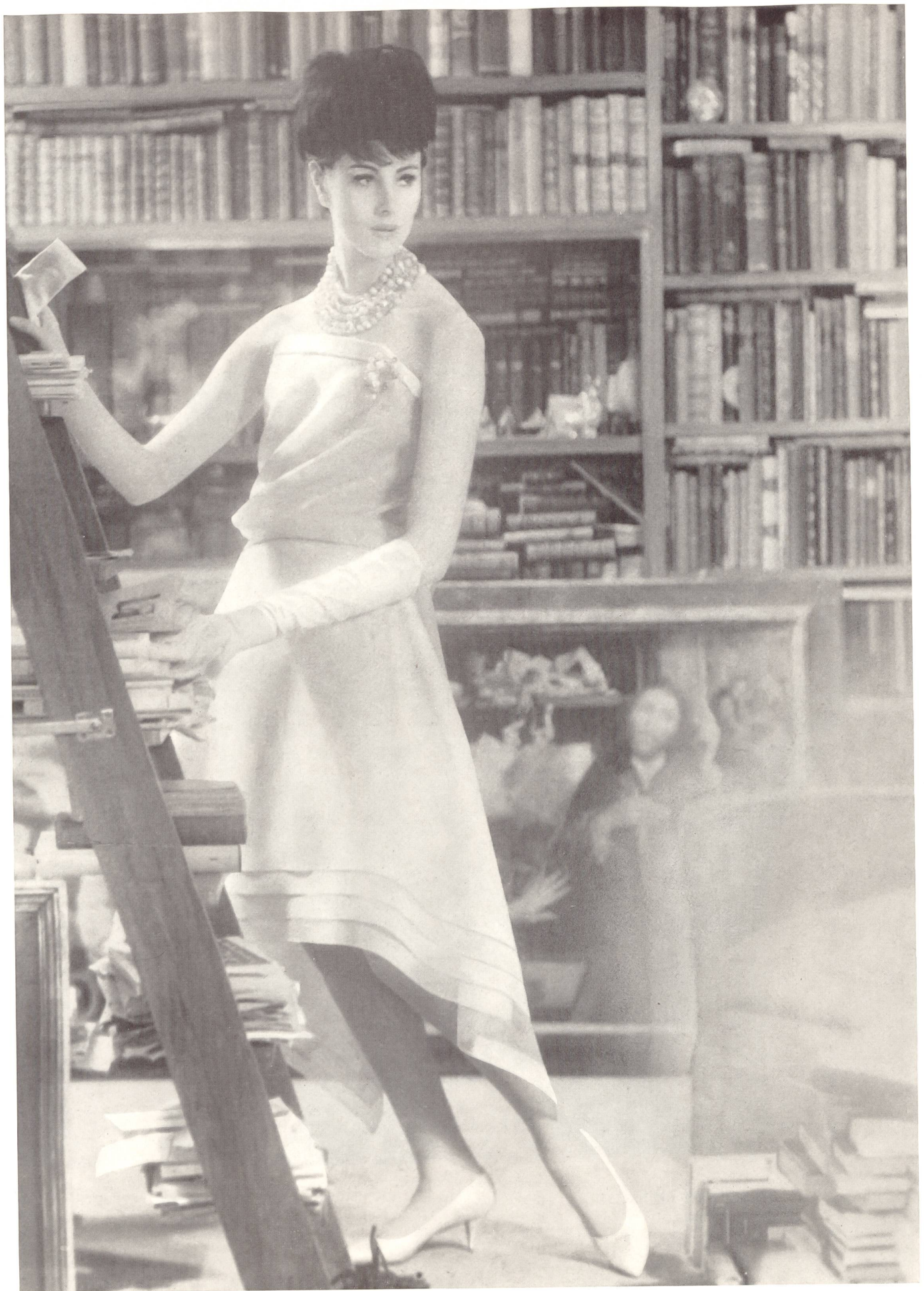
CHRISTIAN DIOR « Basra » de L. Abraham & Cie, Soeries S. A., Zurich