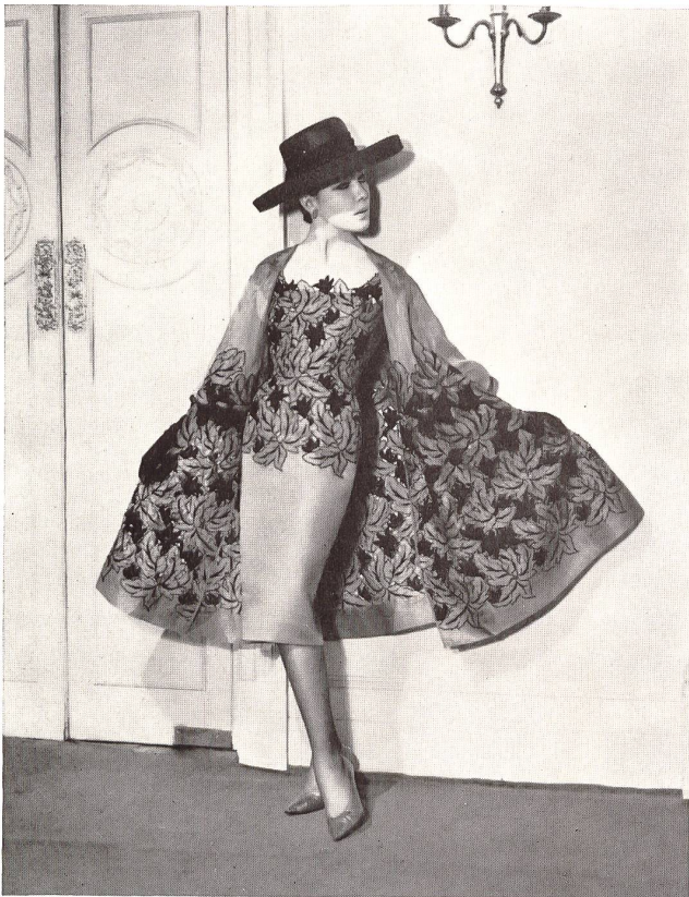
Organdi de soie café avec broderie de soie noire à jour Coffee silk organdie with openwork black silk embroidery Modèle Lachasse, Londres