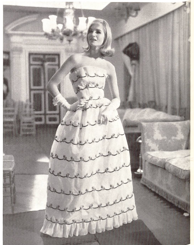
Organdi de soie blanc avec broderie multicolore Multicolor embroidered white silk organdie Modèle Belinda Belville, Londres