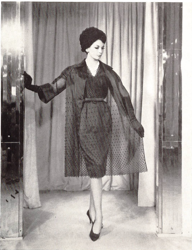
Organdi de soie bleu marine brodé de pois en relief Navy blue silk organdie with embroidered raised spots Modèle Norman Hartnell, Londres