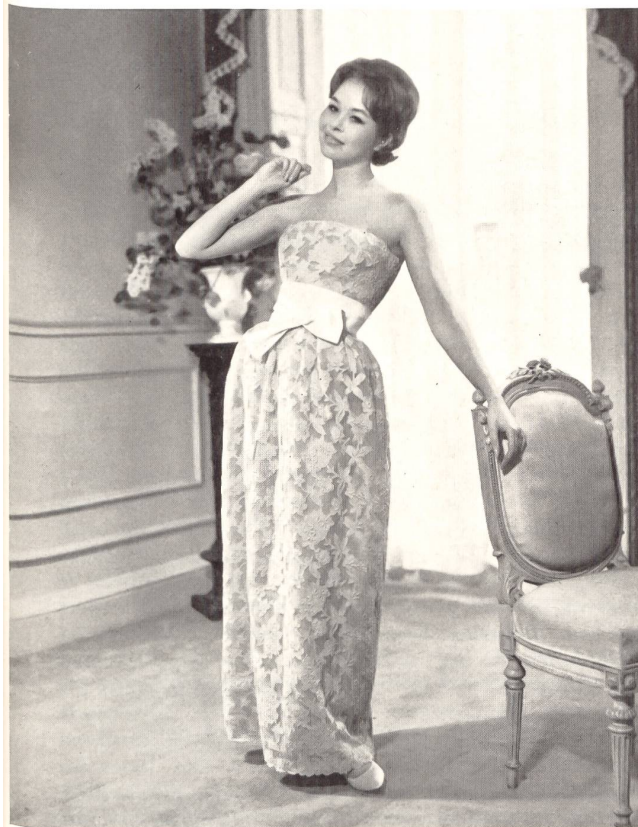
Broderie lin sur tulle Linen embroidered tulle Modèle Ronald Paterson, Londres