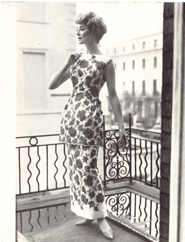
Organdi de soie brodé en blanc et rouge White and red embroidered silk organdie Modèle Mattli, Londres