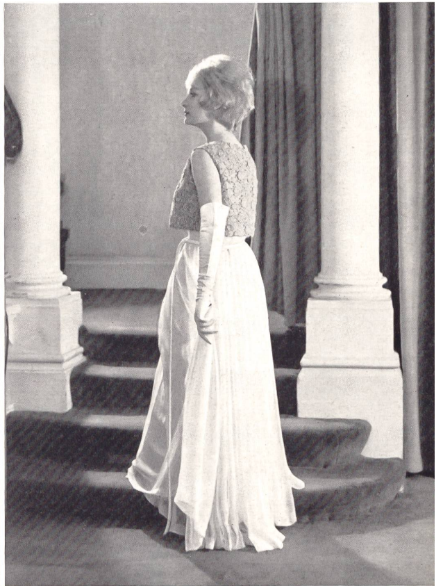
Modèle Mattli, London