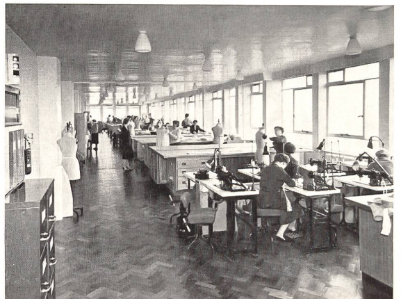
In den Konfektions-Ateliers