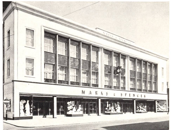
Einer der Verkaufsläden von Marks & Spencer in London