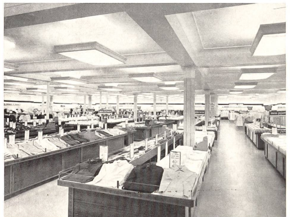
Blick in die Verkaufsräume