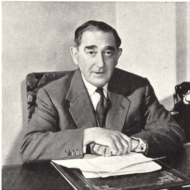
Sir Simon Marks, der Chef von Marks & Spencer

Die schweizerischen Baumwollgewebe erfreuen sich, trotz der sich mehr und mehr auf dem Weltmarkt einbürgernden synthetischen Fasern weiterhin grösster Beliebtheit. Diese Tatsache veranlasst uns heute, dem ausserordentlichen Erfolg eines grossen Kaufhauses unsere besondere Aufmerksamkeit zuzuwenden, vor allem, weil es grosse Mengen Schweizer Baumwollgewebe und Stickeereien verarbeitet und jedes Jahr mehr als eine Million Yards (914 000 Meter) aus der Schweiz bezieht. Um die