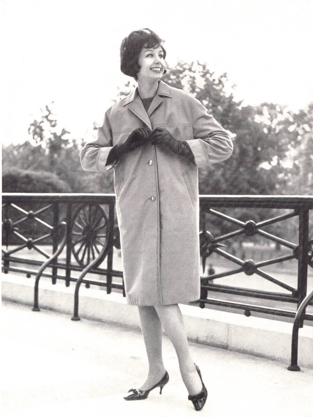
Manteau de pluie en tissu de coton suisse hydrofugé Raincoat made of Swiss water repellent cotton fabric Abrigo de lluvia en tejido algodón hidrofugado suizo Regenmantel aus schweizerischem impräniertem Baumwollgewebe