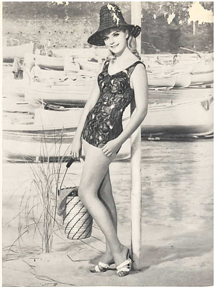
«ROBORO», J. F. ROHRER-BOLLIGER S.A., ROMANSHORN Maillot de bain en coton imprimé, épaulettes larges, profondément échancré dans le dos. — Printed cotton swimsuit, wide straps, deeply plunging back. — Bañador de algodón estampado, con hombreras anchas, muy escotado en la espalda. — Badeanzug aus bedrucktem Baumwollstoff, breite Träger, tiefer Rücken.