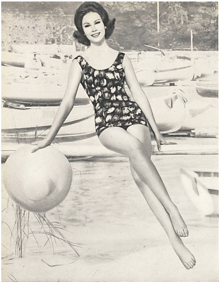
«ROBORO», J. F. ROHRER-BOLLIGER S.A., ROMANSHORN Maillot de bain en tissu «Hélanca» imprimé, épaulettes larges, profondément échancré dans le dos. — Printed "Helanca" swimsuit, wide straps, plunging low at the back. — Bañador de tejido «Helanca» estampado, con hombreras anchas, muy escotado en la espalda. — Badeanzug aus bedrucktem Helanca-stoff, breite Träger, tiefer Rücken.