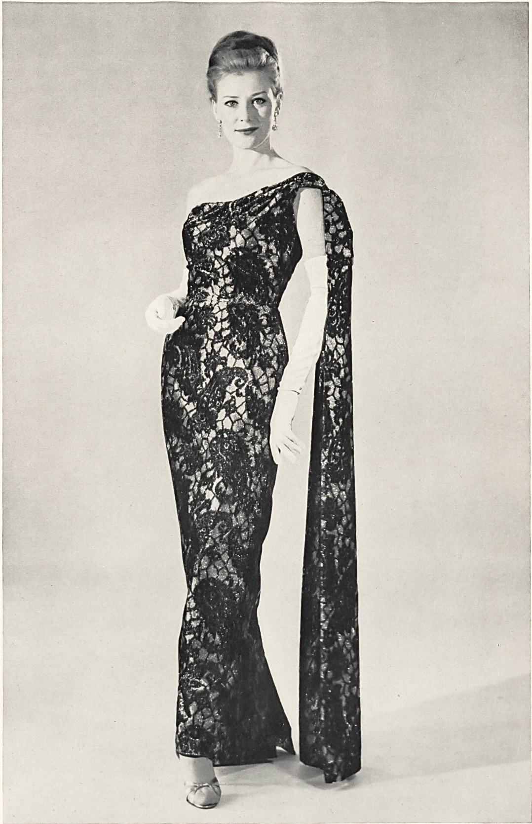
« MIRA », H. GROSSENBACHER S.A., ZURICH Robe du soir en velours lamé, noir et or. Evening gown in black and gold lamé velvet. Vestido de soaré de terciopelo escarchado negro y oro. Abendkleid aus schwarz/goldenem Lamé-Samt.