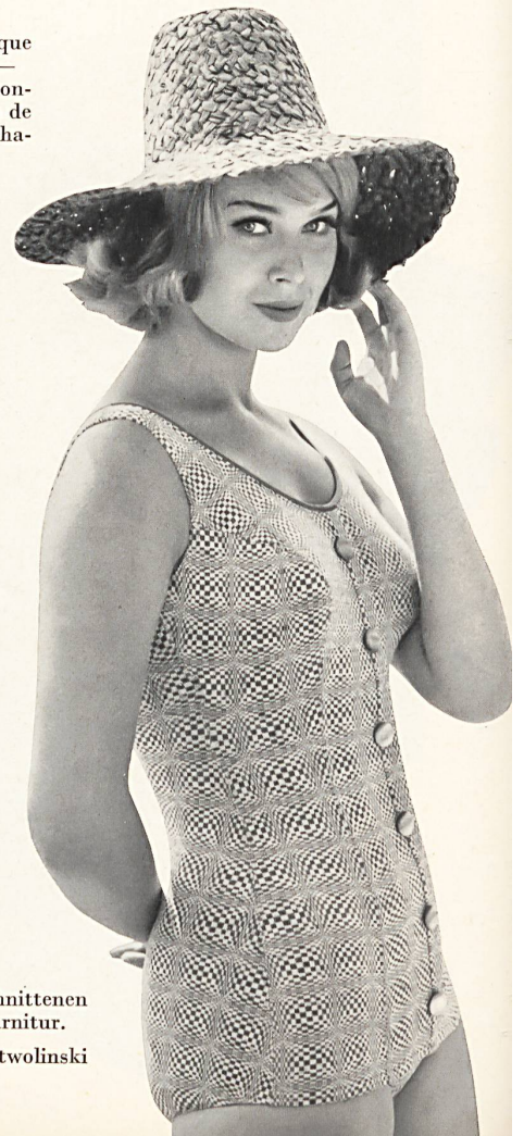
LAHCO S.A., BADEN Maillot de bain tricoté en «Hélanca» avec bretelles coupées dans le tissu et garniture de boutons. — Helanca knitted swimsuit with button trim. — Bañador de tela de punto «Helanca», con tirantes cortados en la misma tela y con garnición de botones. — Badeanzug aus gestricktem «Helanca» mit angeschnittenen Trägern und Knopfgarnitur.