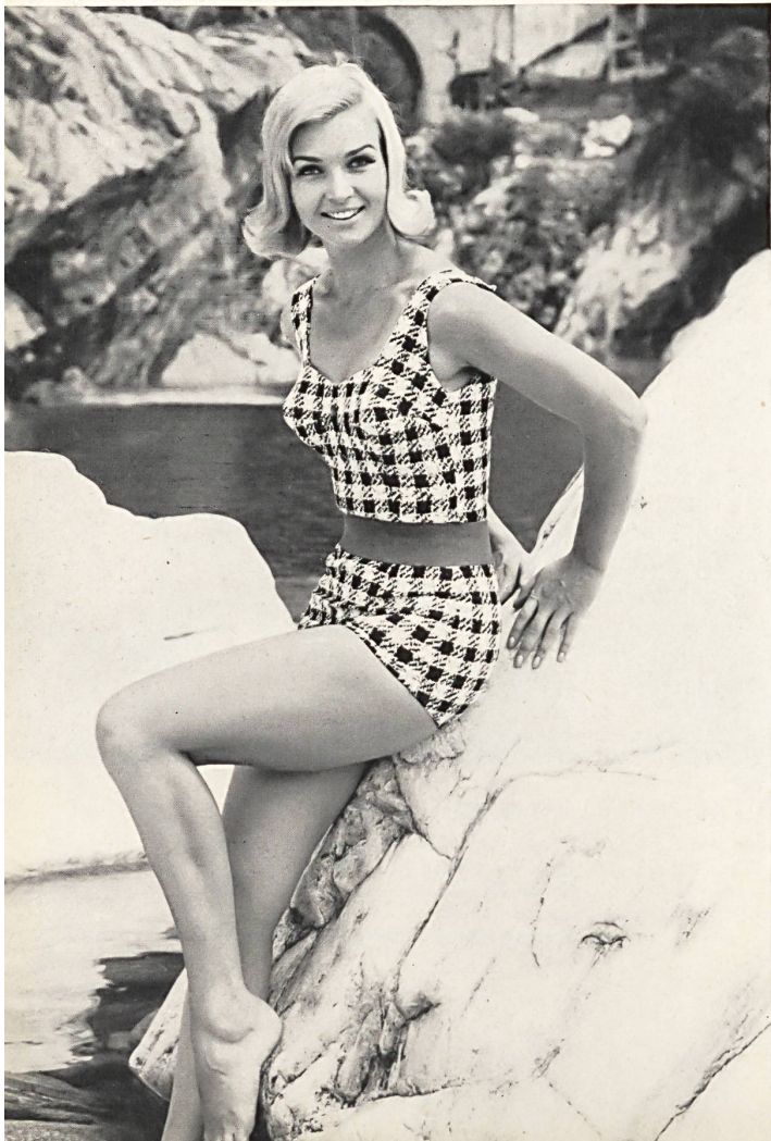
LAHCO S.A., BADEN Maillot de bain en tissu élastique avec ceinture contrastante. — Elasticized swimsuit with contrasting belt. — Traje de baño de tejido elástico con cinturón haciendo contraste. — Badeanzug aus elastischem Gewebe mit dazupassendem kontrastfarbigem Gürtel.