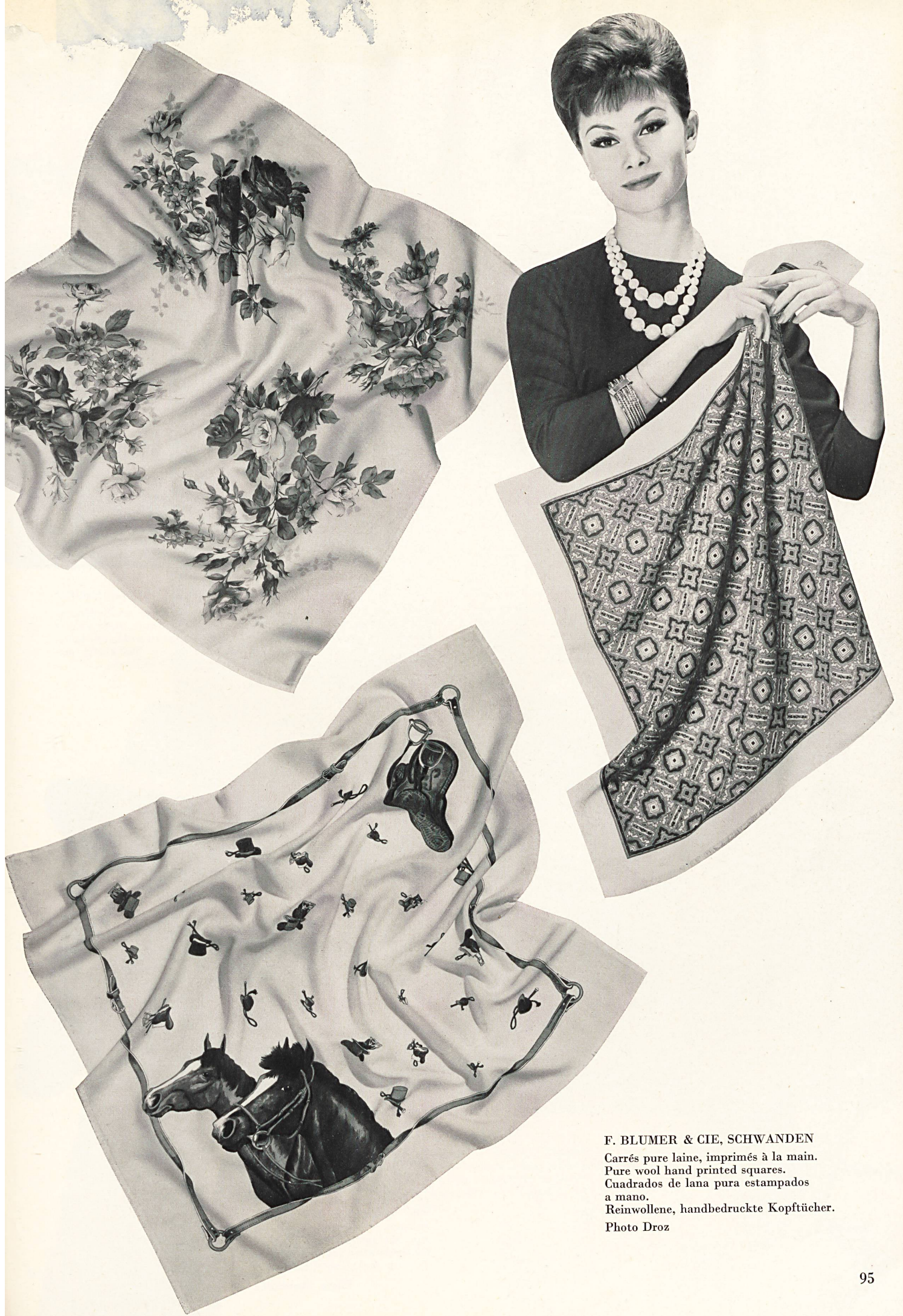
F. BLUMER & CIE, SCHWANDEN Carrés pure laine, imprimés à la main. Pure wool hand printed squares. Cuadrados de lana pura estampados a mano. Reinwollene, handbedruckte Kopftücher.