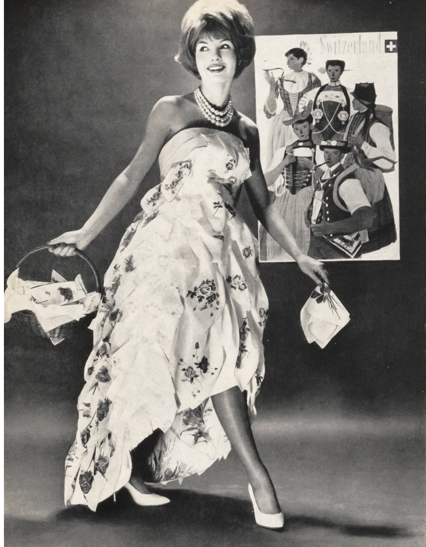
Robe du soir réalisée en mouchoirs suisses brodés, présentée en Grande-Bretagne This ball dress made of 120 Swiss embroidered and lace handkerchiefs was displayed in Great-Britain Modèle Couture Marianne, Saint-Gall Document: Swiss Cotton Fabric and Embroidery Centre, London Photo Nancy Sandy Walker/Scaioni

feminine Note, von der die besten Kollektionen dieser Saison geprägt sind. Cavanagh zeigte die praktischste Mode, die wir in den letzten Jahren zu sehen bekamen: Diner-Ensembles aus reichem Brokat; seine Kollegen zeigten Ähnliches in der selben Linie aus Guipüre und Brochés schweizerischen Ursprungs. Manchmal ein Kleid mit ganz einfachem Schnitt mit einem offenen, dazu passenden Jäckchen aus einem reichen Stoff, manchmal ein Diner-Ensemble mit langem Rock und offen zu tragender Jacke, um eine Bluse mit erlesener Perlstickerei zur Geltung zu bringen.