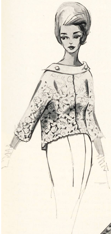
FORSTER WILLI & CO., SAINT-GALL Broderies Embroideries