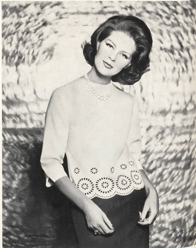
«RECO», REICHENBACH & CO., SAINT-GALL Batiste Minicare brodée/embroidered Modèle Hardy Amies, Londres