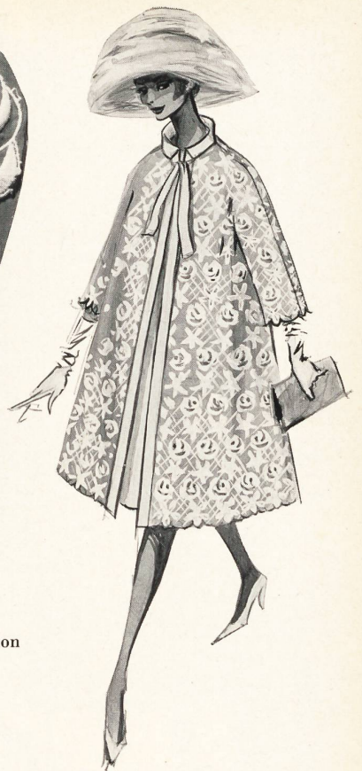
Dessin original de : Original sketch by : Owen of Lachasse, London