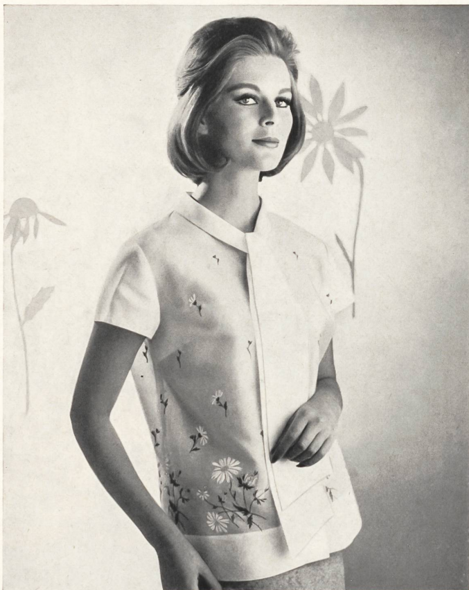
«RECO», REICHENBACH & CO., SAINT-GALL Batiste Minicare brodée/embroidered Modèle Hardy Amies, Londres