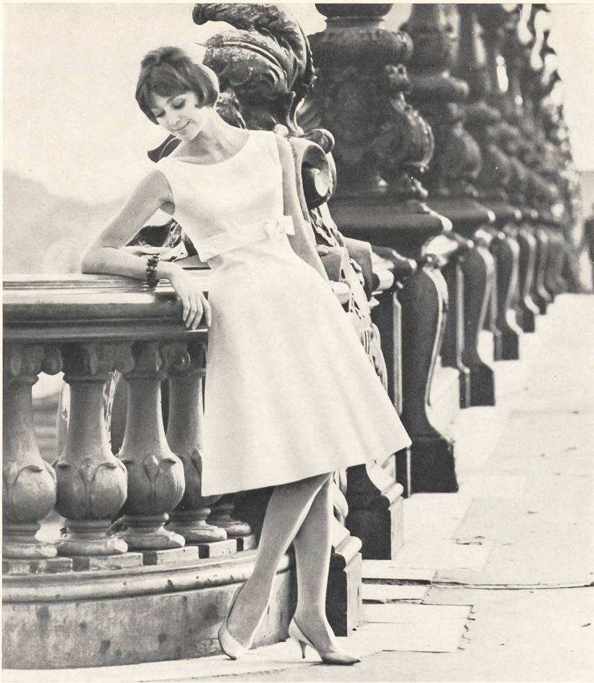
ROBT. SCHWARZENBACH & CO., THALWIL Tissu acétate « Joyeuse » – acetate fabric – tejido de acetato – Azetatgewebe Modèle Pierre Billet, Paris