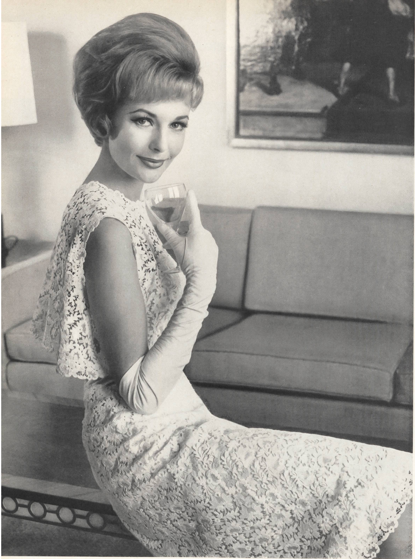
FORSTER WILLI & CO., SAINT-GALL Guipure Modèle Detlev Albers, Berlin