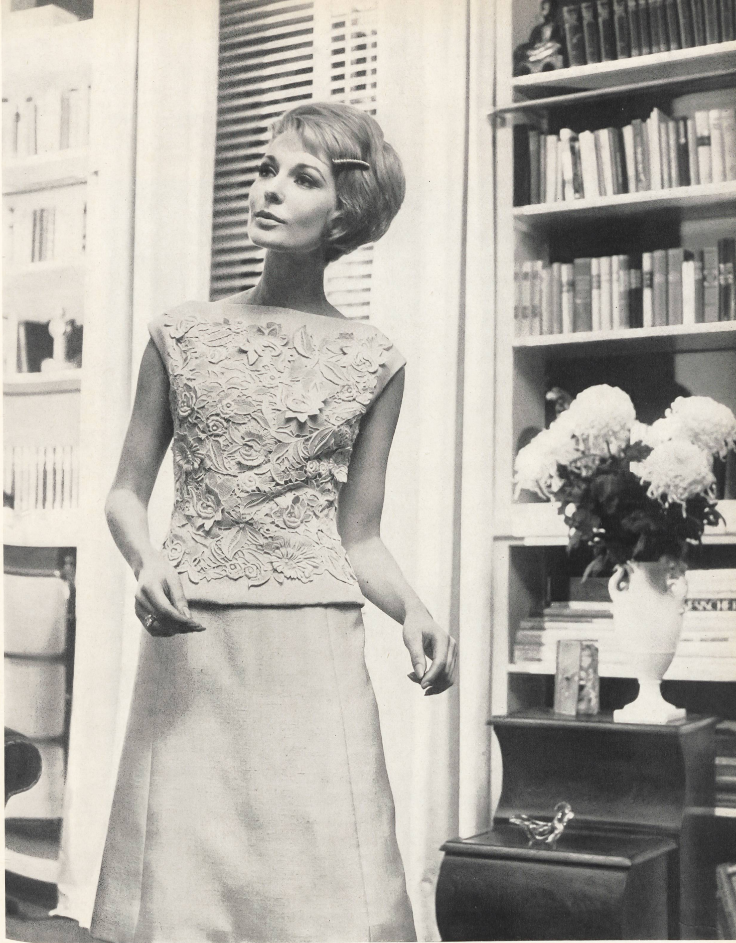
FORSTER WILLI & CO., SAINT-GALL Guipure Modèle Staeb-Seger, Berlin