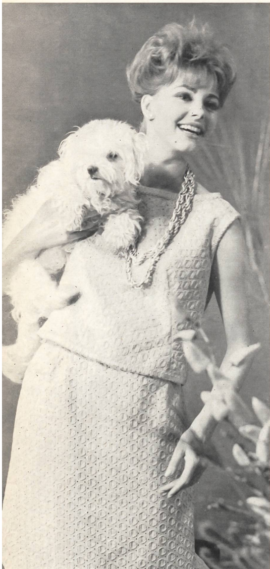
« RECO », REICHENBACH & CO., SAINT-GALL

Batiste Minicare brodée - embroidered - bordada - bestickt Modèle Krizia, Milan