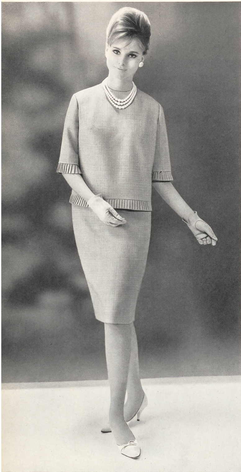
HEER & CIE S. A., THALWIL Térylène/laine quadrillé. Terylene and wool quadrilled fabric. Térylène/lana cuadriculada. Modèle S. Kraus, Zurich.