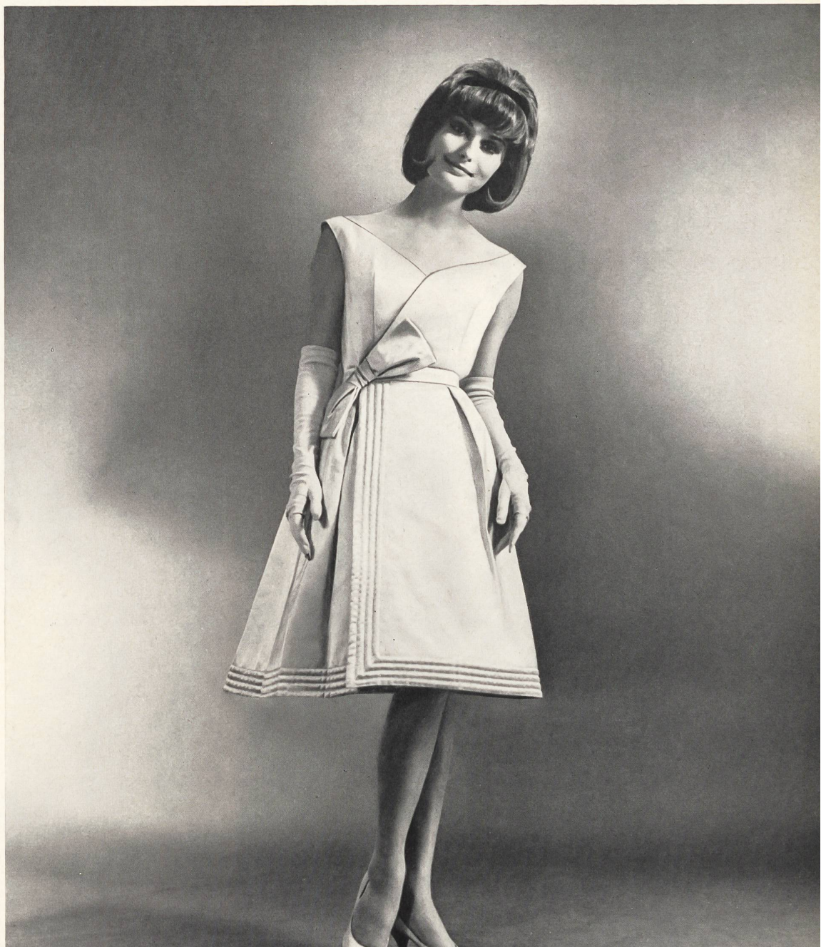
HEER & CIE S. A., THALWIL Satin Magic, rayonne. Modèle H. & A. Heim A.-G., Zurich.