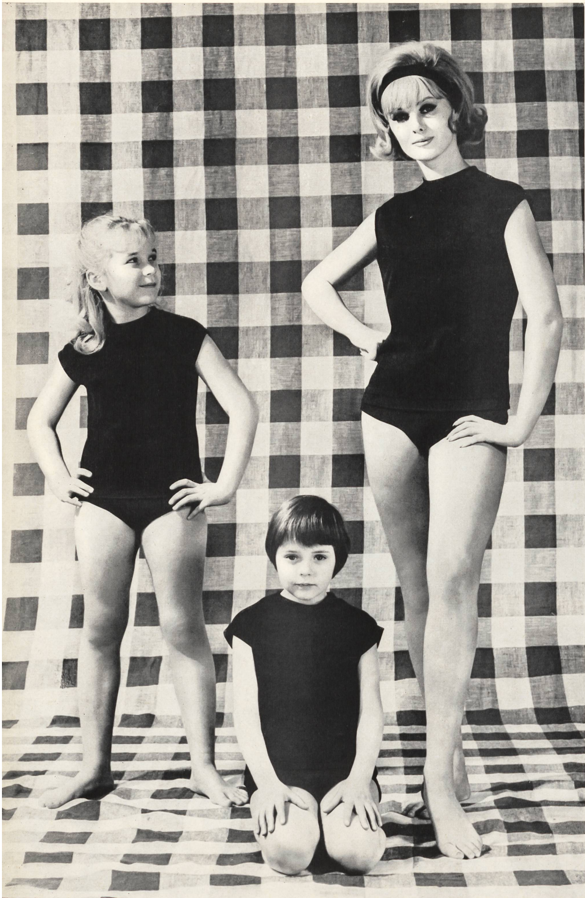
« OPALINE », A. NAEGELI S.A., WINTERTHUR Costumes de gymnastique en Ban-Lon tricoté. Gym suits in knitted Ban-Lon. Traje de gimnasia de Ban-Lon a punto de malla. Gymnastikanzüge aus gestricktem Ban-Lon. Joseph Bancroft & Sons Co. A.-G., Zurich « Ban-Lon ».