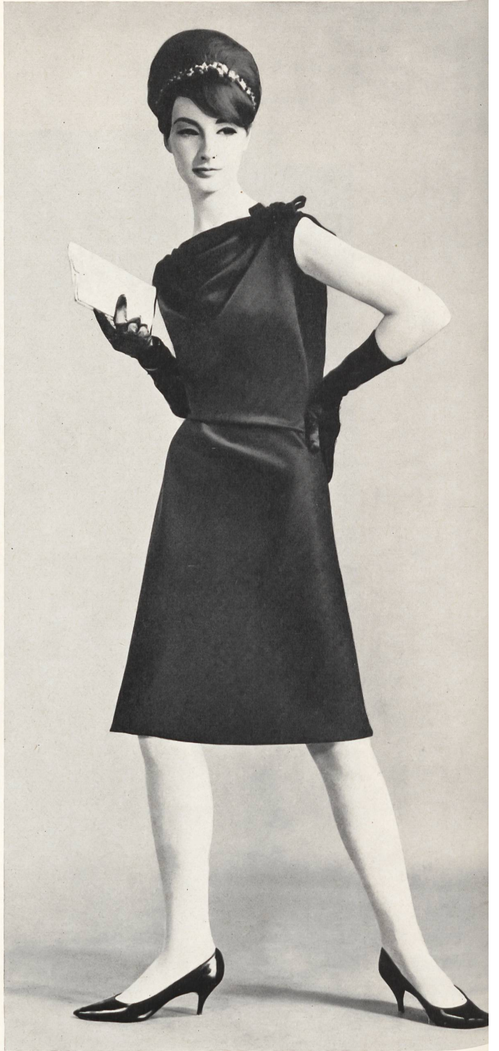
HEER & CIE S. A., THALWIL Romantique, soie et laine (silk and wool — seda y lana — Seide und Wolle). Modèle R. Cafader & Co., Zurich.