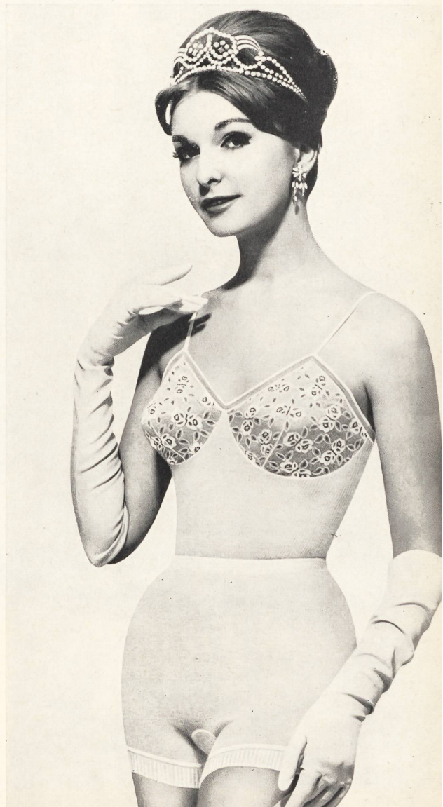
« SAWACO », W. ACHTNICH & CO. S. A., WINTERTHUR Parure en fin tricot de peigné « Fixform » avec bonnets brodés. Fixform lingerie set in fine knitted combed fabric with embroidered bra. Juego de lencería, de punto de estambre « Fixform » con elegante pechera de puntilla. Gekämmte, fein gestrickte, « Fixform » Damen-Garnitur mit aparter Büstenspitze.