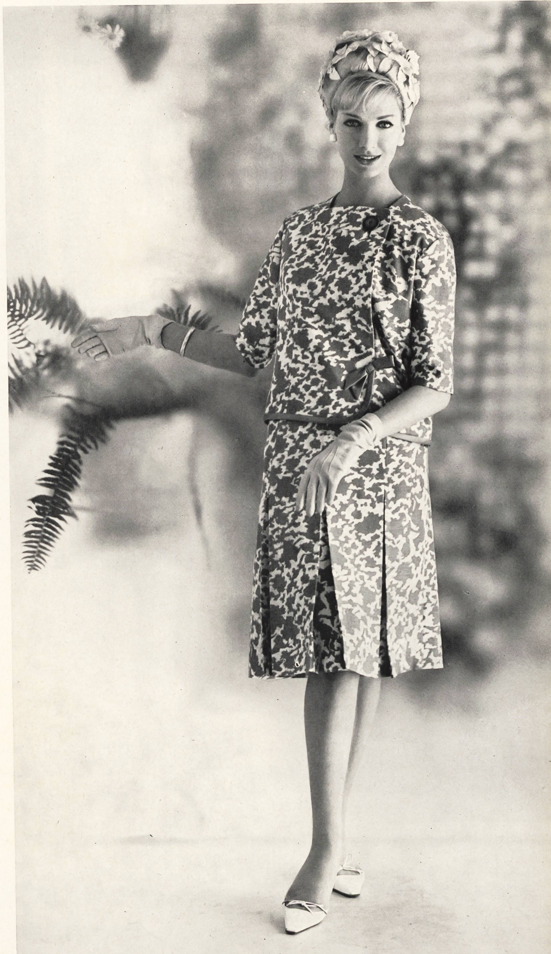
SOIERIES STEHLI S. A., ZURICH Tonkino imprimé (printed - estampado - bedruckt). Modèle Yvel S. A., Zurich.