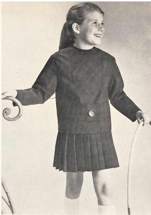
HEER & CIE S. A., THALWIL Térylène/laine quadrillé. Terylene and wool quadrilled fabric. Térylène/lana cuadriculada. Modèle Eugen Oertle & Co., Saint-Gall.