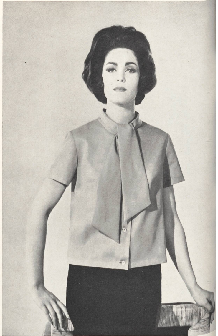
« RECO », REICHENBACH & CO., SAINT-GALL Recoluxe, voile fin uni Minicare. Modèle E. Gross & Co., Saint-Gall.