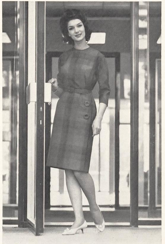
HEER & CIE S. A., THALWIL Térylène/laine quadrillé. Terylene and wool quadrilled fabric. Térylène/lana cuadriculada. Modèle Kleinberger & Co., Saint-Gall.