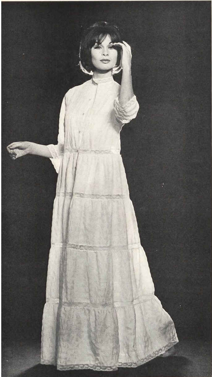
METTLER & CIE S. A., SAINT-GALL Violine gaufrée. Modèle Andréa Grenier, Paris.