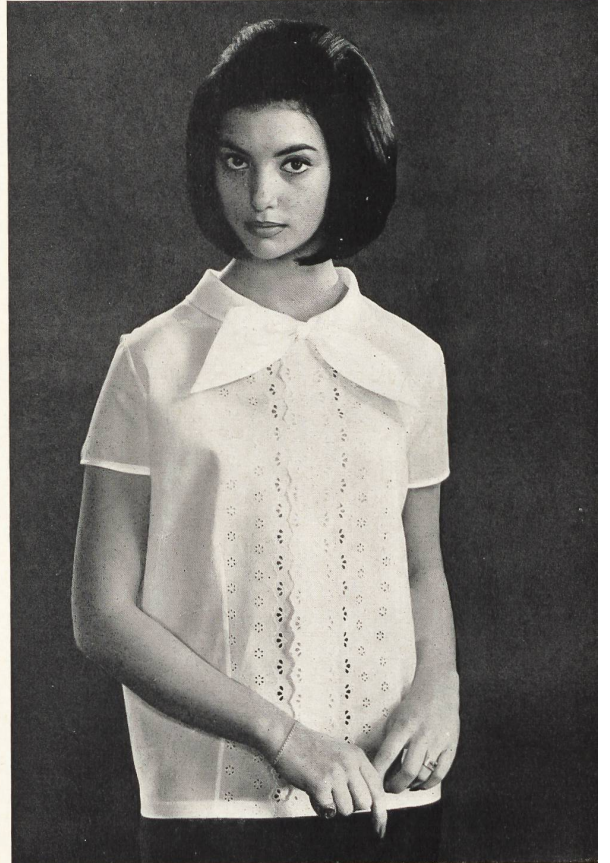
FORSTER WILLI & CO., SAINT-GALL Broderies. Modèles Debrouwere, Bruxelles.