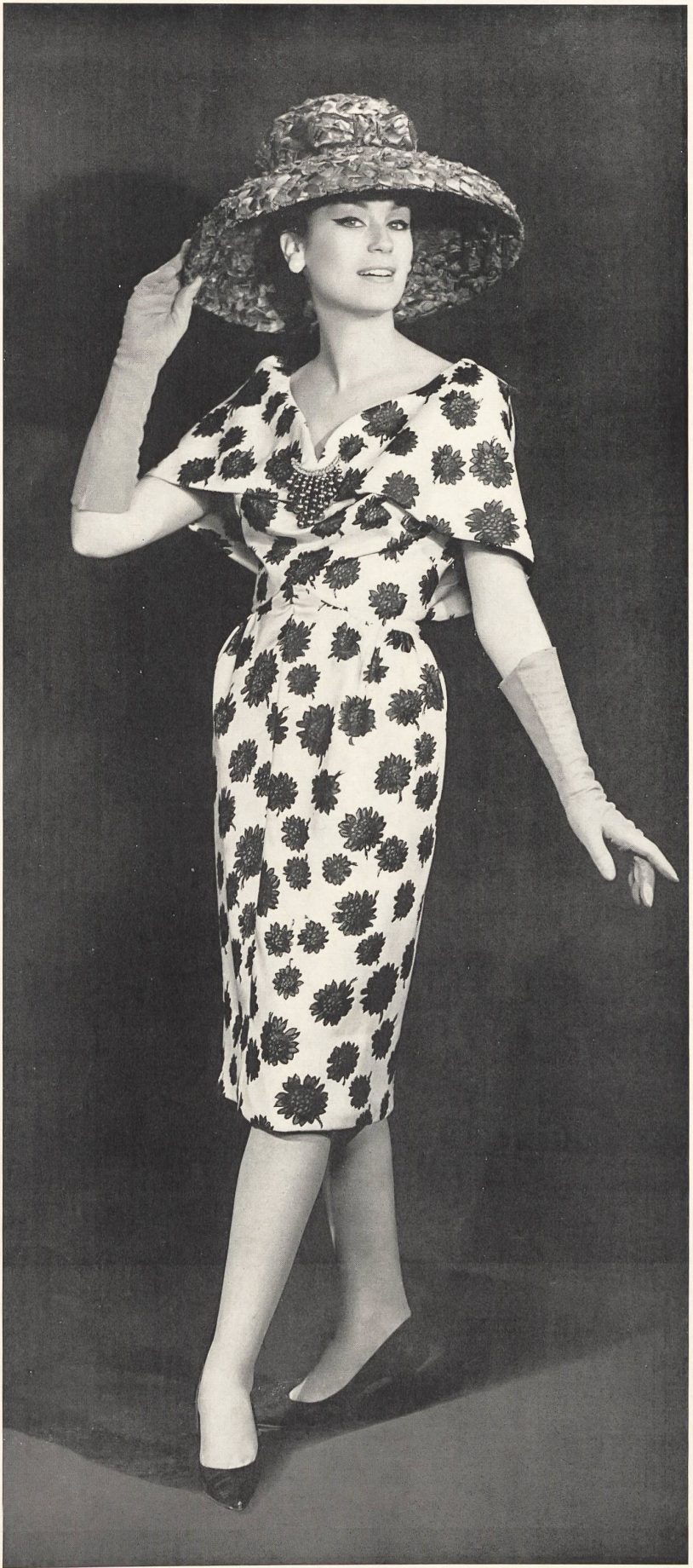
RUDOLF BRAUCHBAR & CIE S. A., ZURICH Twill pure soie. Twill de seda natural. Modèles Santa Eulalia, Barcelone.