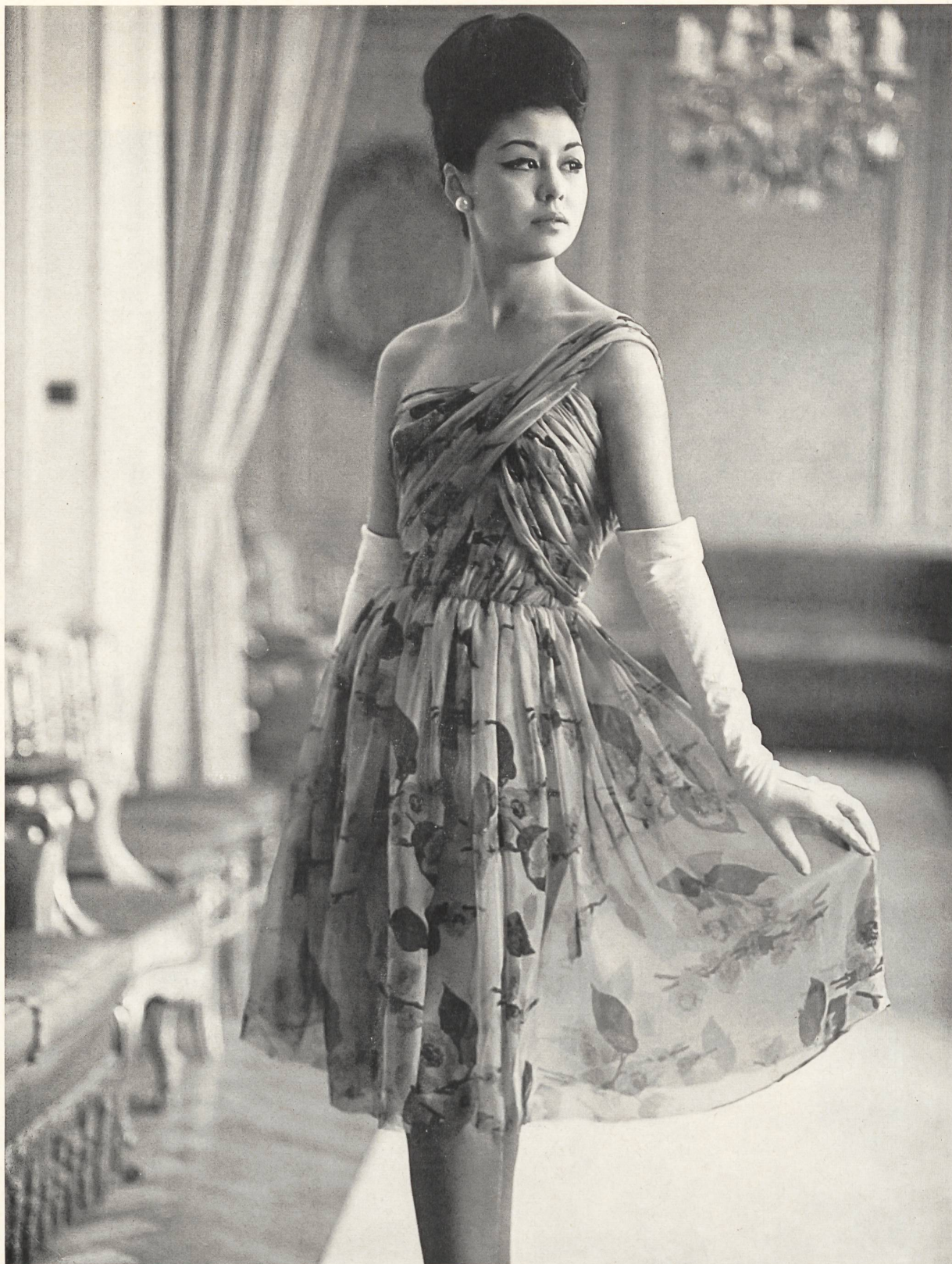
RUDOLF BRAUCHBAR & CIE S. A., ZURICH Mousseline de soie imprimée. Muselina de seda estampada. Modèle El Dique Flotante, Barcelone.