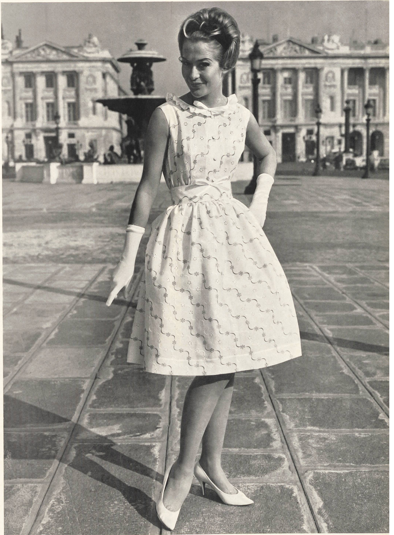
« RECO », REICHENBACH & CO., SAINT-GALL Broderie de couleur sur batiste Minicare blanche. Modèle Lempereur, Paris.