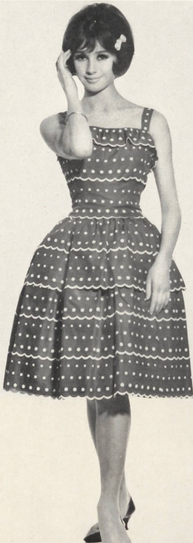
3 Broderie sur batiste tissée en couleurs, genre Vichy. Modèle Pierbe S. A., Lyon.