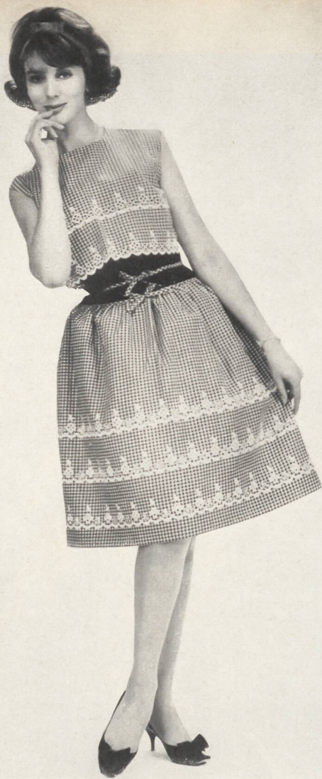
1 JACOB SCHLÄPFER & CO., SAINT-GALL Broderie sur batiste tissée en couleurs, genre Vichy. Modèle Sabrina, Nice.