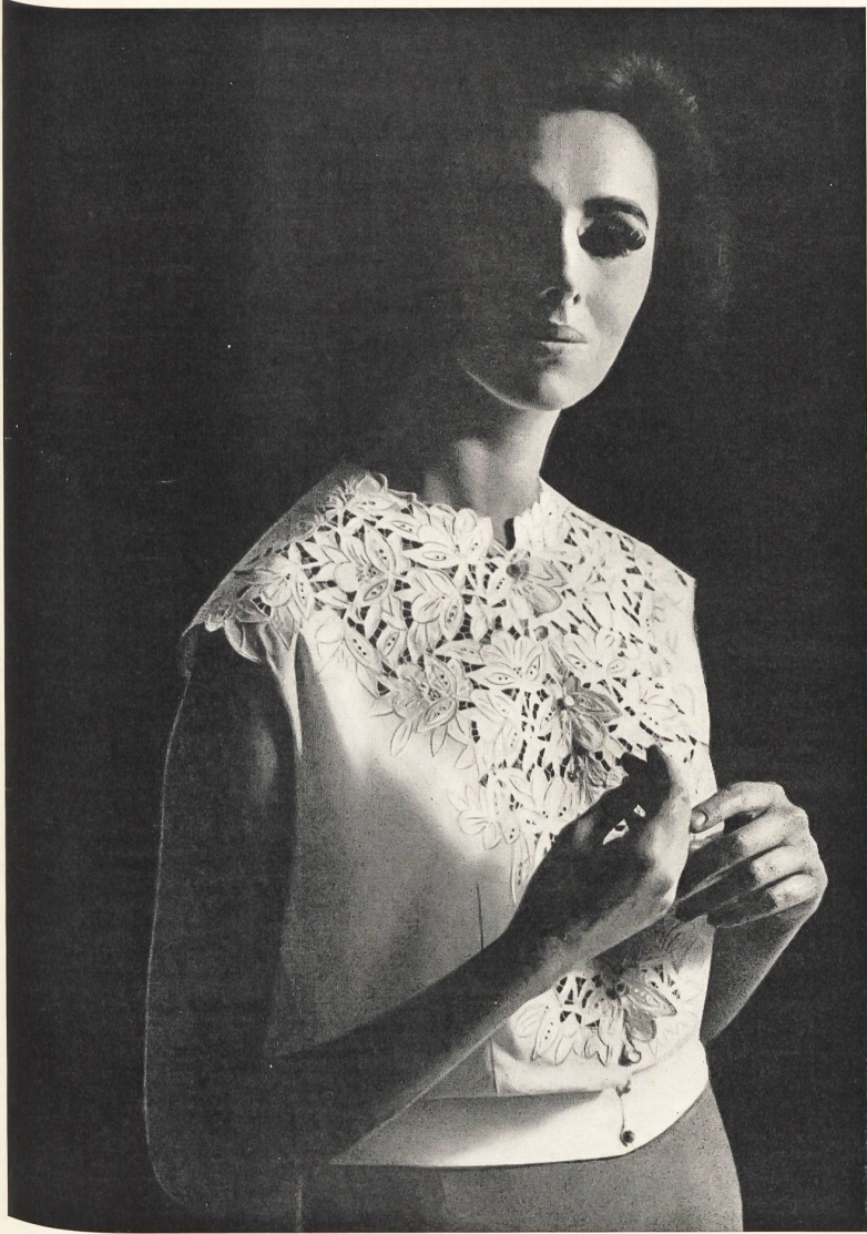
« FISBA », CHRISTIAN FISCHBACHER CO., SAINT-GALL Broderie sur tissu Minicare. Stickerei auf Minicare Gewebe. Modèle Rositta, Vienne. Joseph Bancroft & Sons Co. A.-G., Zurich. « Minicare ».