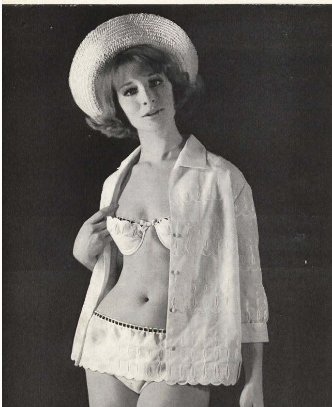
« RECO », REICHENBACH & CO., SAINT-GALL Batiste Minicare brodée. Modèle Alphée, Alassio (Italie).