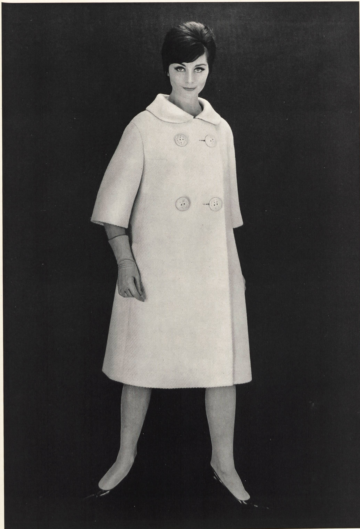
Modèle GERSTLE & CO. S. A., ZURICH