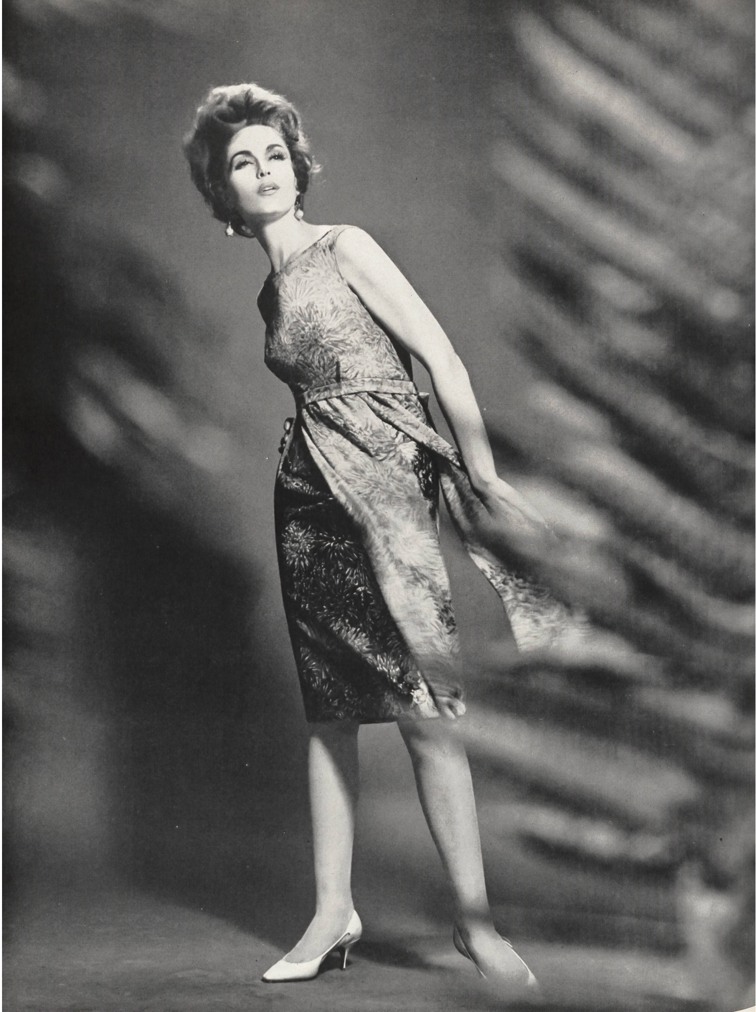
Modèle de la MAISON GACK, ZURICH