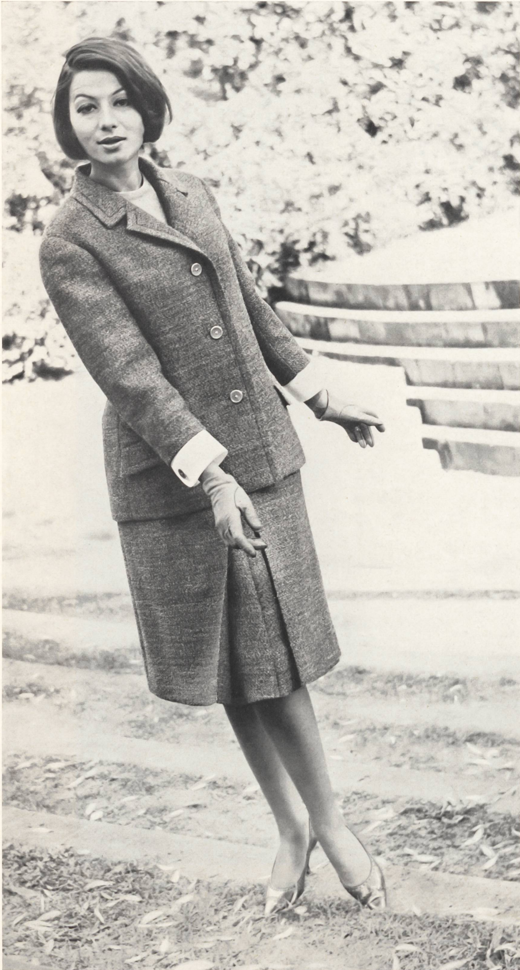
Modèle BEBLO S.A., BALE