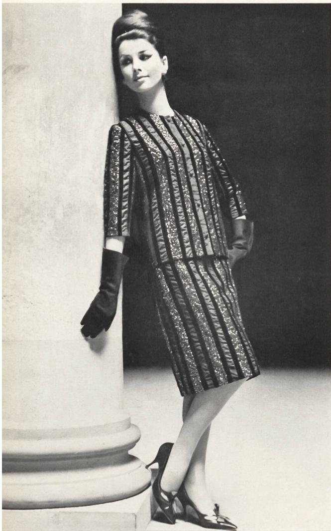
Deux-pièces en soie lamée argent et ruban de velours Two-piece outfit in silver lamé silk and velvet ribbon Dos-piezas de seda brochada de plata con cintas de terciopelo Deux-pièces aus Silberlamé-Seide und Samtband Modèle Bertoli, Milan

Es ist hier wohl angebracht, darauf hinzuweisen, daß die Schweizer Seidenbandindustrie alle wünschbaren Sorten von Bändern bester Qualität zu liefern fähig ist und daß sie sich laufend der jeweiligen Mode anpaßt. Diese Sparte der schweizerischen Textilproduktion, die seit einigen Jahrhunderten in der Gegend von Basel heimisch ist, beruht, was Sorgfalt angeht, auf alter Tradition, die aber das Modische nicht ausschließt. Die beste Empfehlung für diese Bänder ist die Tatsache, daß sie in bedeutendem Ausmaß von zahlreichen Ländern eingeführt werden.