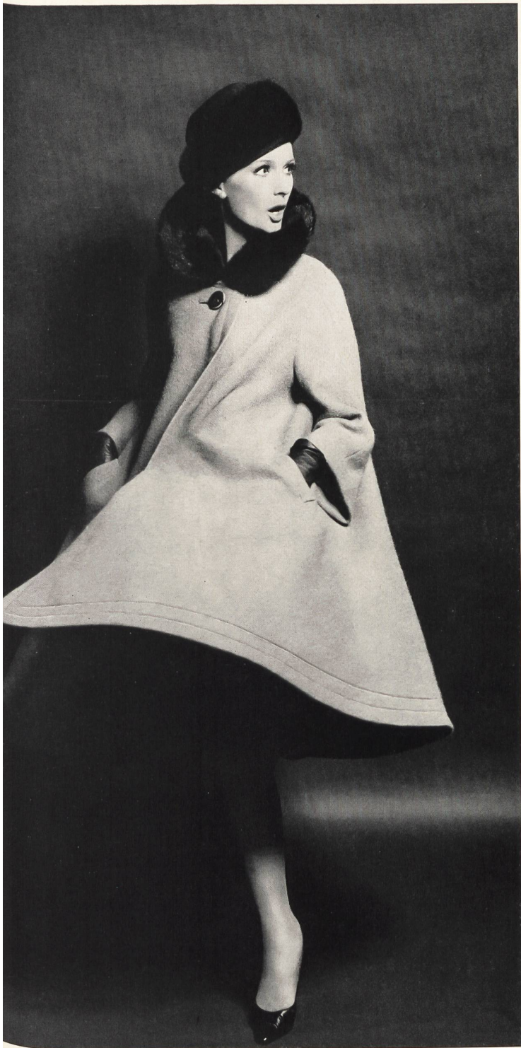
Modèle « GLENN BOUTIQUE », HASLER & CO., ZURICH Manteau de lainage vert avec col de vison noir Green wool coat with black mink collar Abrigo de lana verde con cuello de visón negro Mantel aus grünem Wollstoff mit schwarzem Nerzkragen