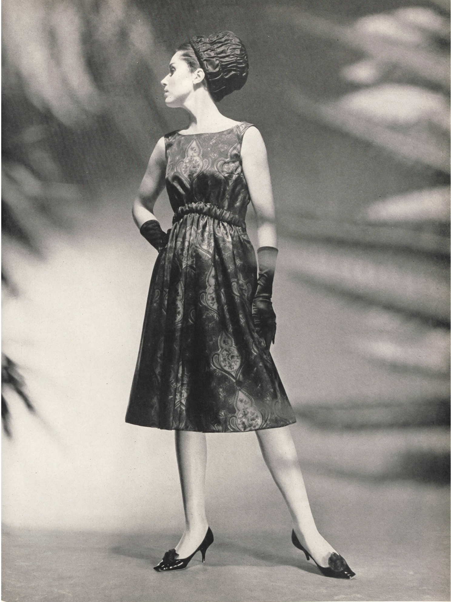
Modèle de la MAISON GACK, ZURICH