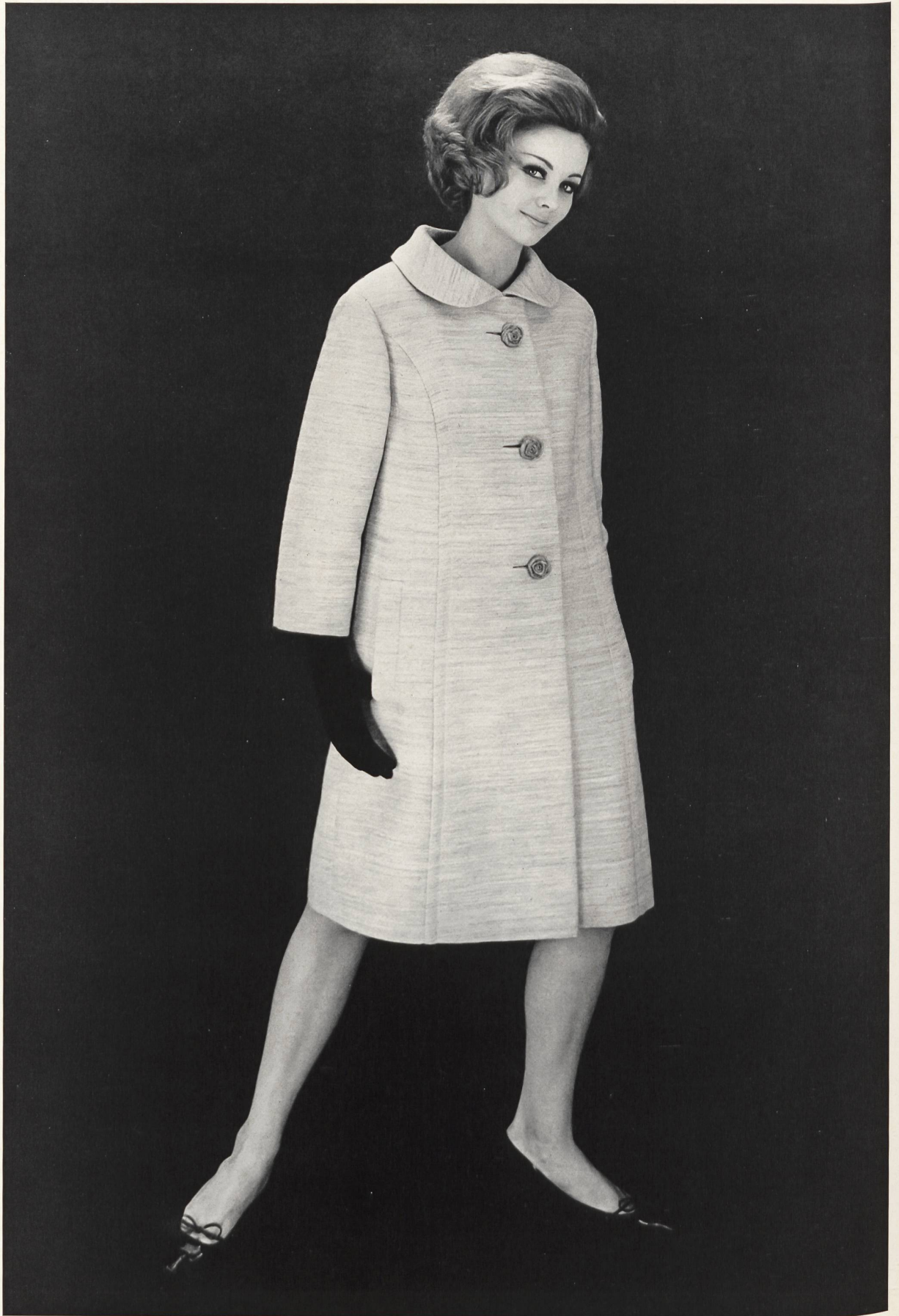
Modèle GERSTLE & CO. S. A., ZURICH