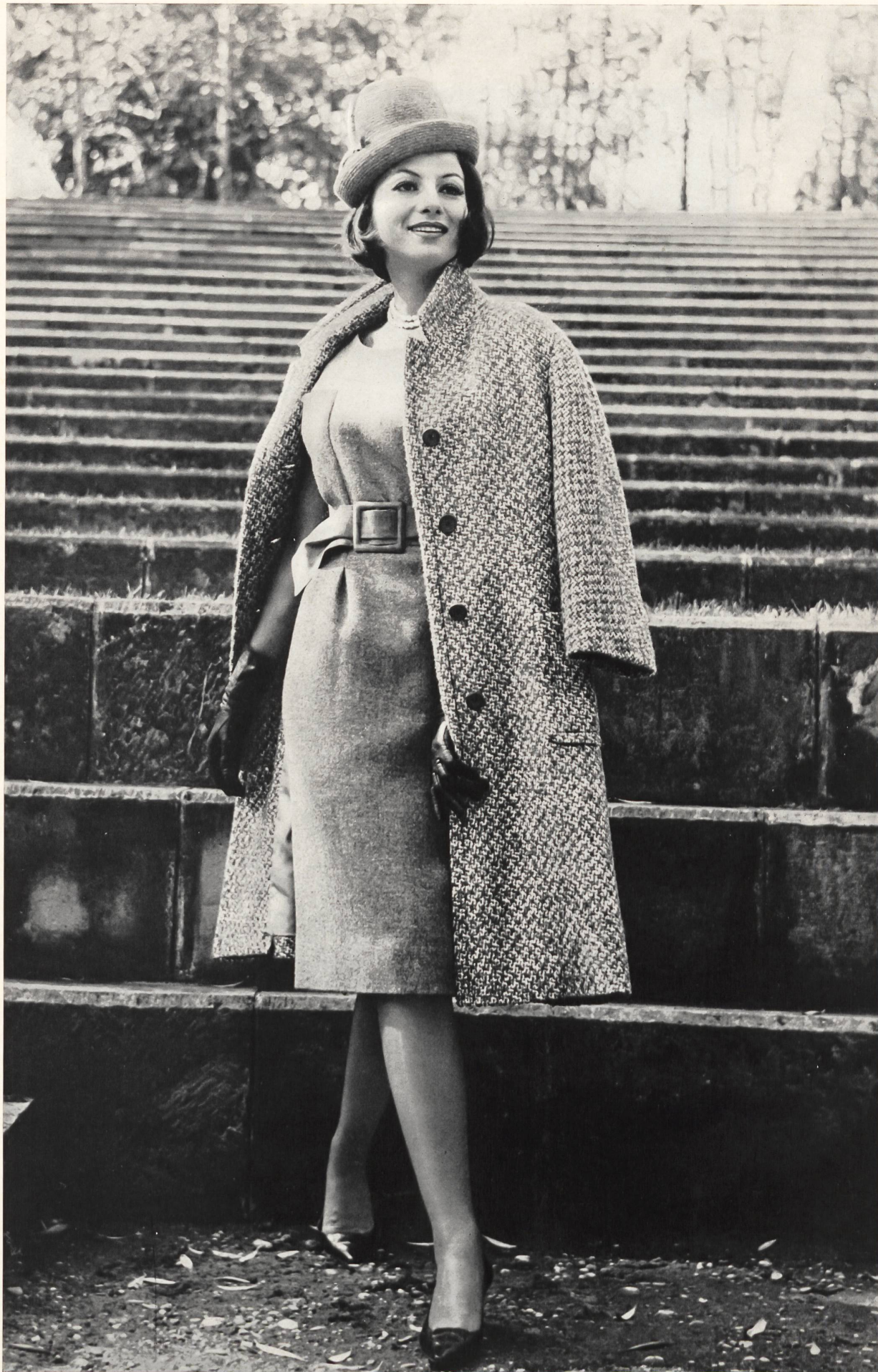
Modèle BEBLO S.A., BALE