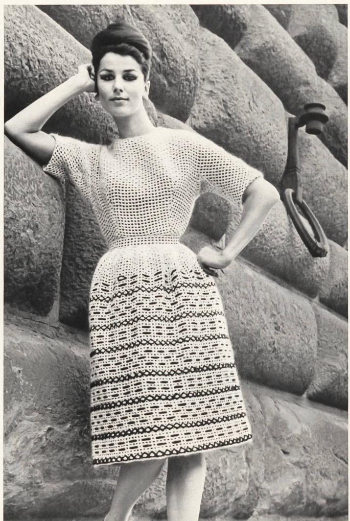
Robe rose pâle, garnie de rubans de velours Pale pink dress trimmed with velvet ribbons Vestido color de rosa pálido, adornado con cintas de terciopelo Modèle Bertoli, Milan