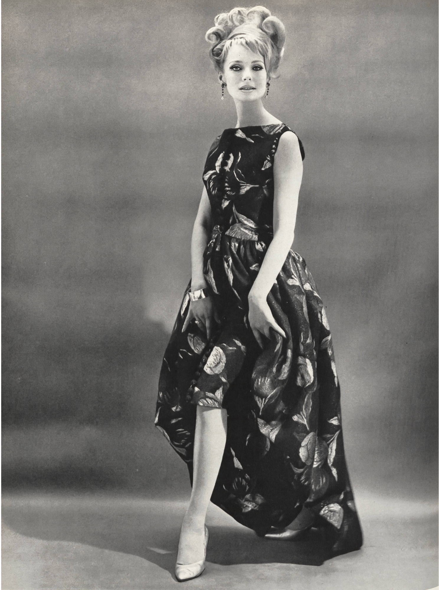
Modèle ALGO S.A., ZURICH Tissu des Tissages de Soieries Naef Frères S.A., Zurich