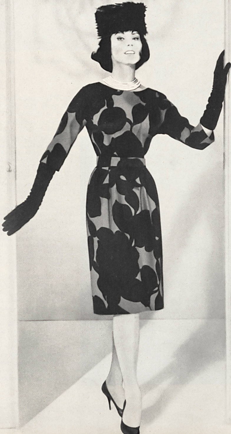
L. ABRAHAM & CO. SILKS LTD., ZURICH « Charlus » lainage imprimé « Charlus » printed wool fabric Modèle Helga, Los Angeles

ihm vollends bei, wenn er seine Kollegen in Kalifornien als « Kleiderzeichner » und « Fabrikanten » in einem bezeichnet. Jedem Einzelnen sind gewisse Kniffe eigen, das kam wieder sehr deutlich während der letzten Vorführungen der Ferien- und Frühjahrsmode zum Ausdruck. Es war bei diesen Gelegenheiten eine Fülle von faszinierenden Modellen aus bewundernswerten Geweben zu sehen, die den Grossisten zu Preisen von 29,75 bis zu mehreren Tausenden Dollars angeboten wurden;