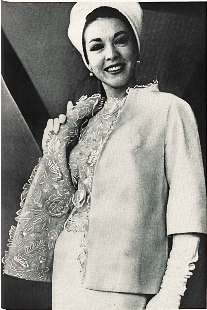
FORSTER WILLI & CO., SAINT-GALL Tissu brodé avec applications de broderie Embroidered fabric with appliquéd flowers Modèle Travilla, Los Angeles