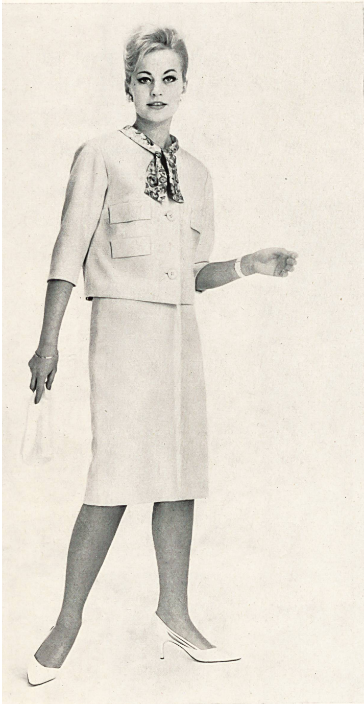
« ZURRER », WEISBROD-ZÜRRER SÖHNE, HAUSEN a. A. Tissu/Gewebe « Canton Lascara » Modèle Honico A/S, Kopenhague