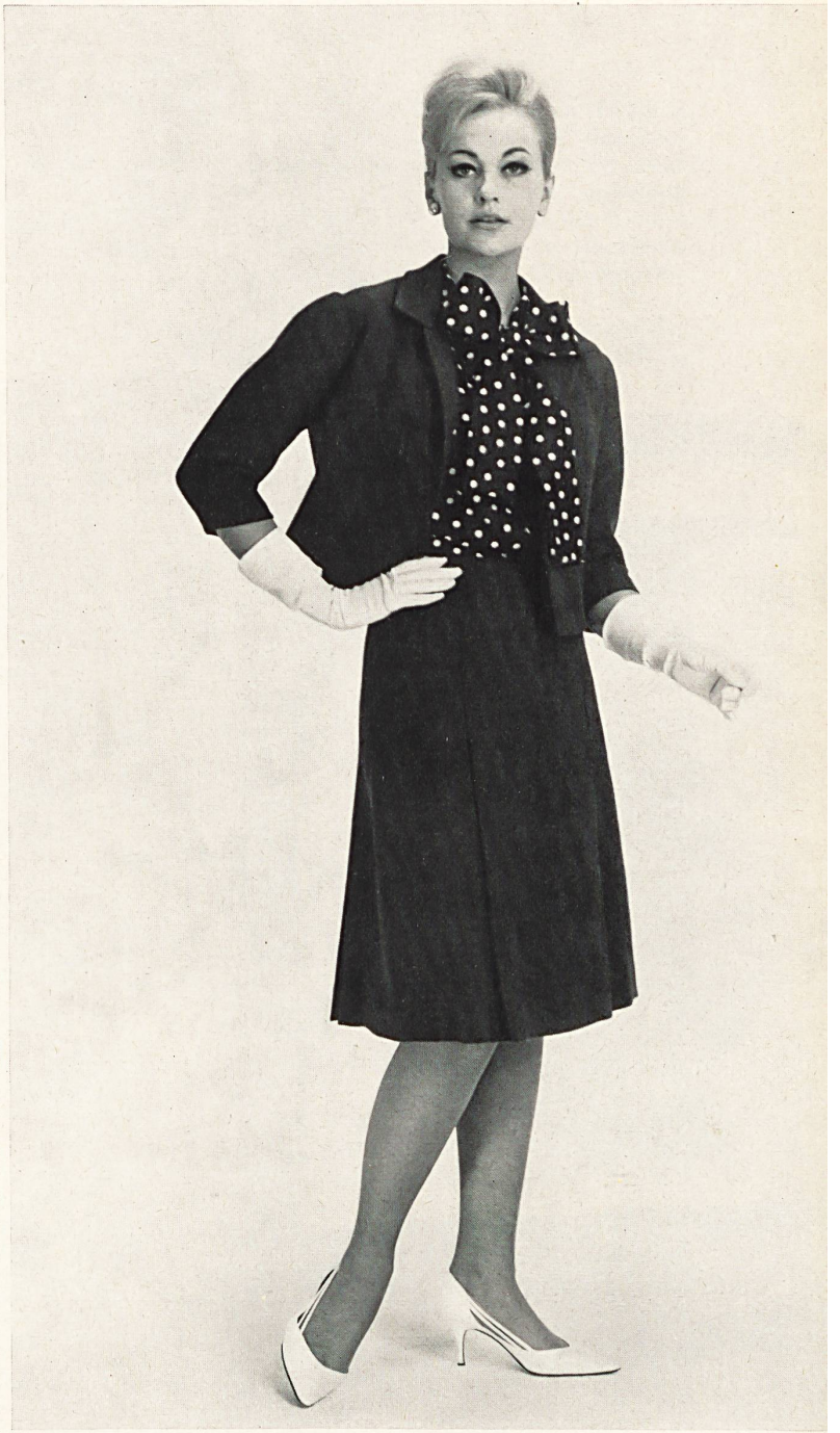
« ZURRER », WEISBROD-ZÜRRER SÖHNE, HAUSEN a. A. Tissu / Gewebe « Canton Lascara » Modèle Honico A/S, Kopenhague