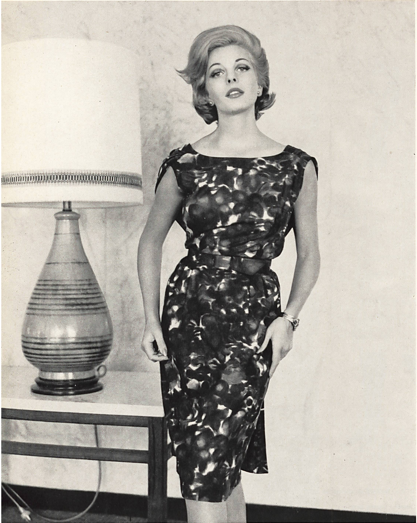
BÉGÉ S. A., ZURICH Tissu / Fabric « bégé-Atlantic » Modèle Sharene, Melbourne