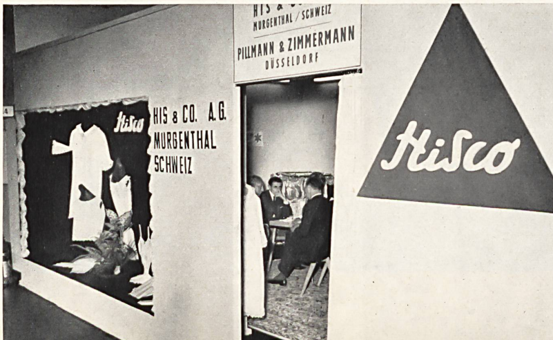
Vue du stand de la maison The stand of El vista del « stand » de la casa Der Stand der Firma HIS & CIE S. A., MURGENTHAL