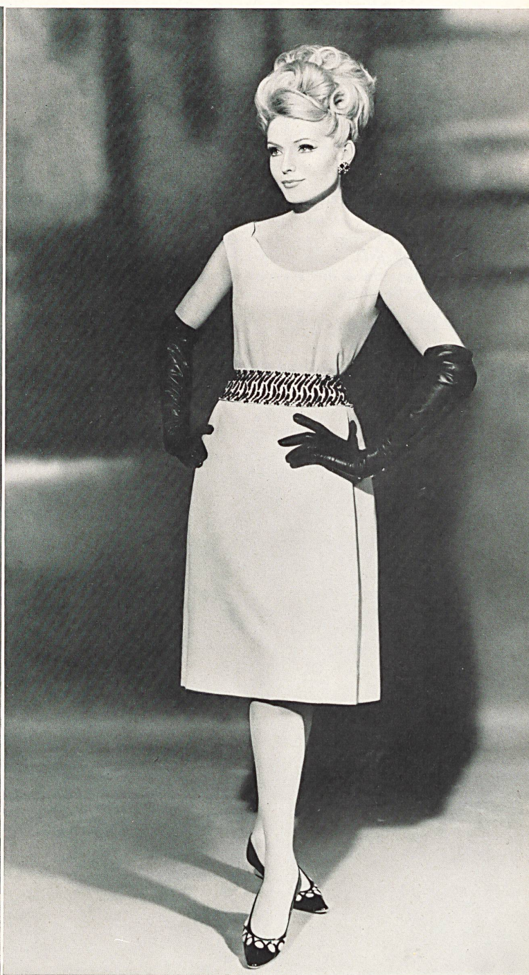
HEER & CIE S.A., THALWIL Crêpe Derby (tissu / fabric / tejido / Gewebe) Modèle Willy Meyer S.A., Zurich