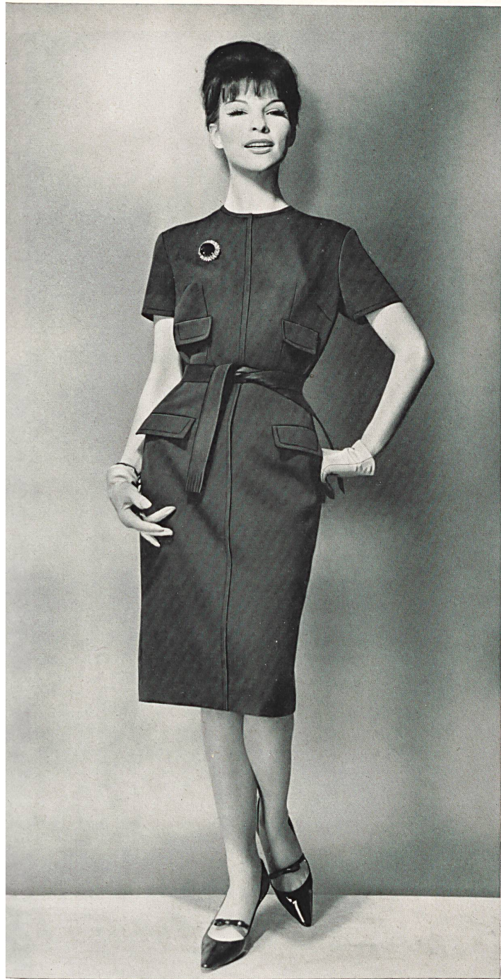
HEER & CIE S.A., THALWIL Draplyne, tissu rayonne et laine (rayon and wool fabric / tejido de lana y rayón / Rayonne und Woll- gewebe) Modèle Kriemler-Schoch, Saint-Gall