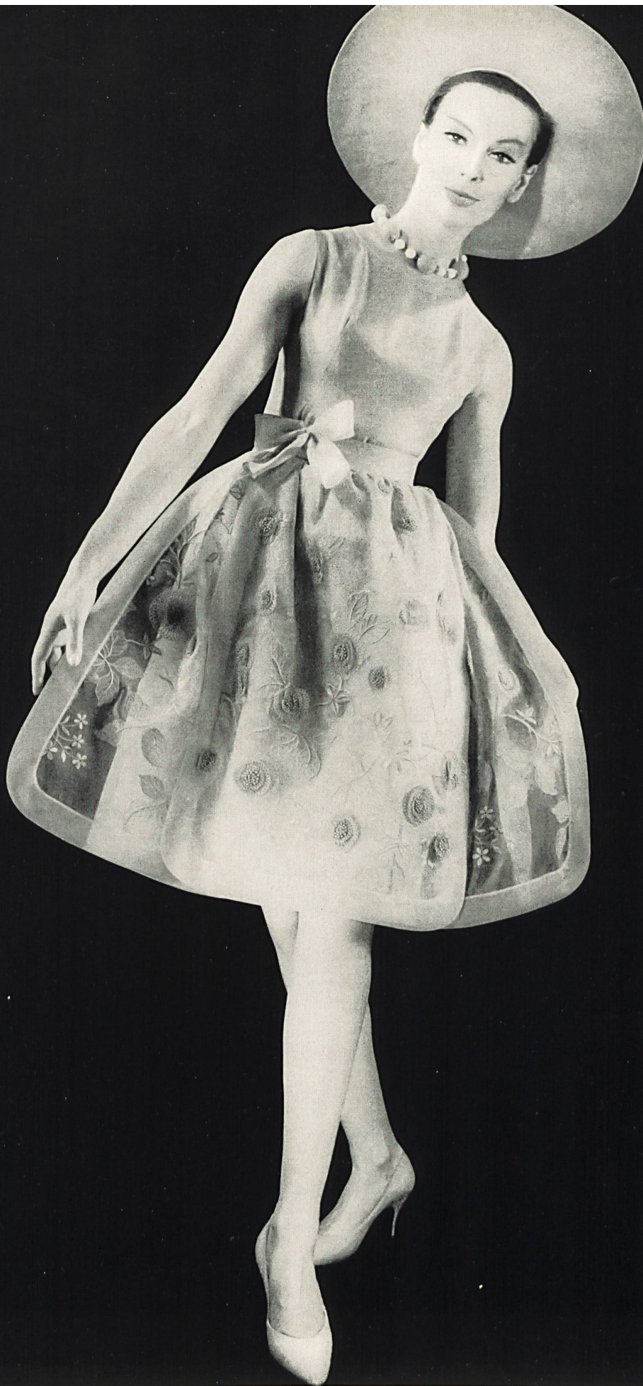
FERRERAS Organdi de soie brodé couleur avec applications de motifs de guipure de Union S. A., Saint-Gall Grossiste à Paris : Robert Burg & Cie