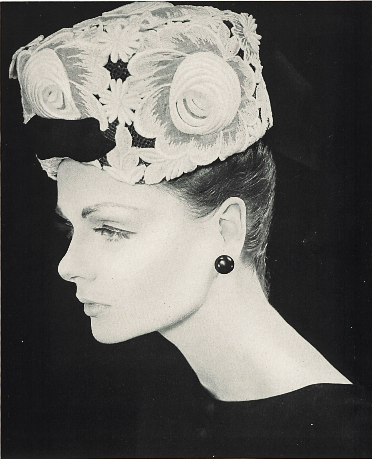
JEANNE LANVIN (DEVAUX) Galon d'organdi brodé à motifs superposés de A. Naef & Cie S.A., Flawil/Saint-Gall Grossiste à Paris : Robert Burg & Cie