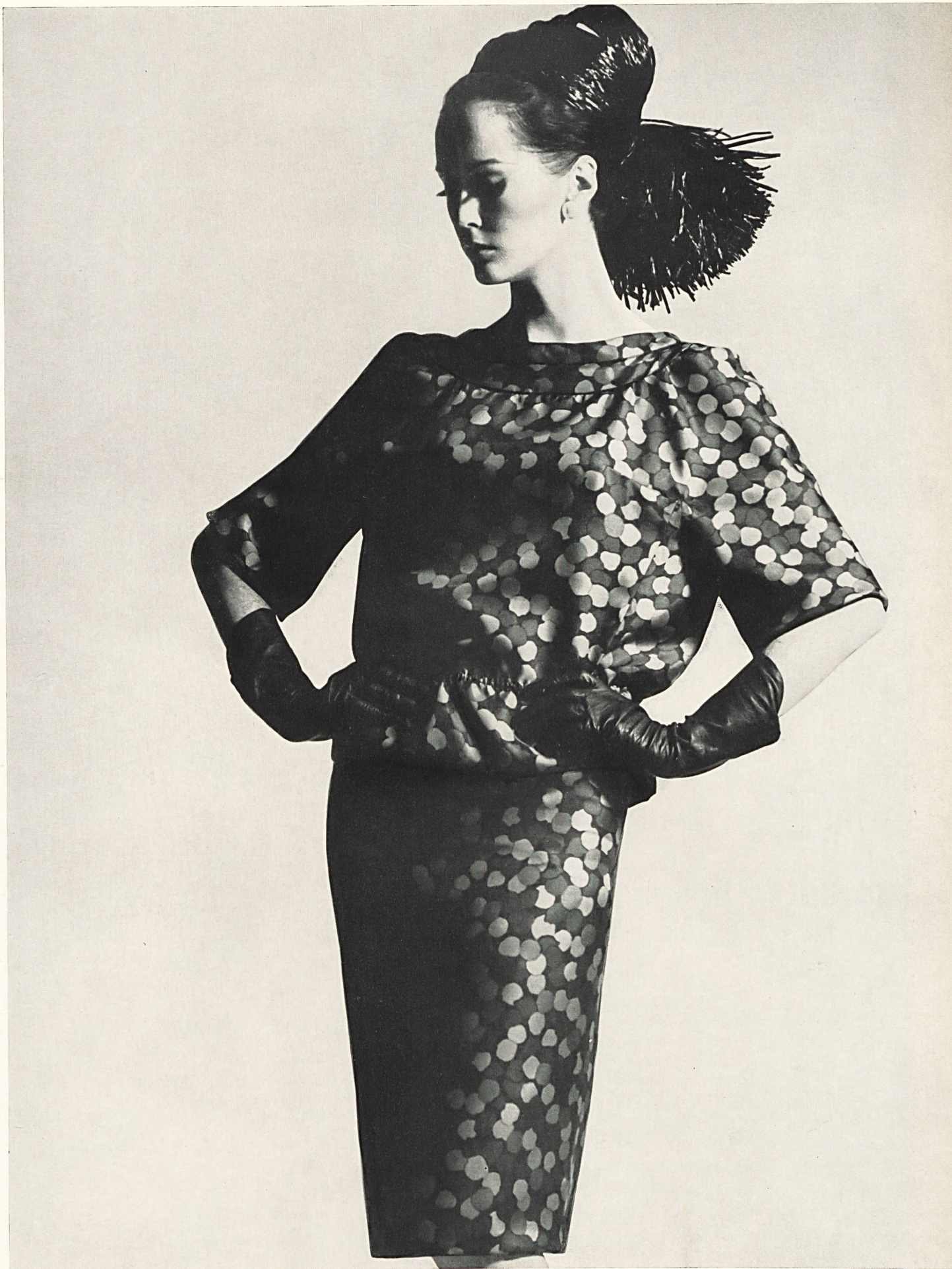
JACQUES HEIM Twill « Unduki » imprimé de L. Abraham & Cie, Soieries S. A., Zurich