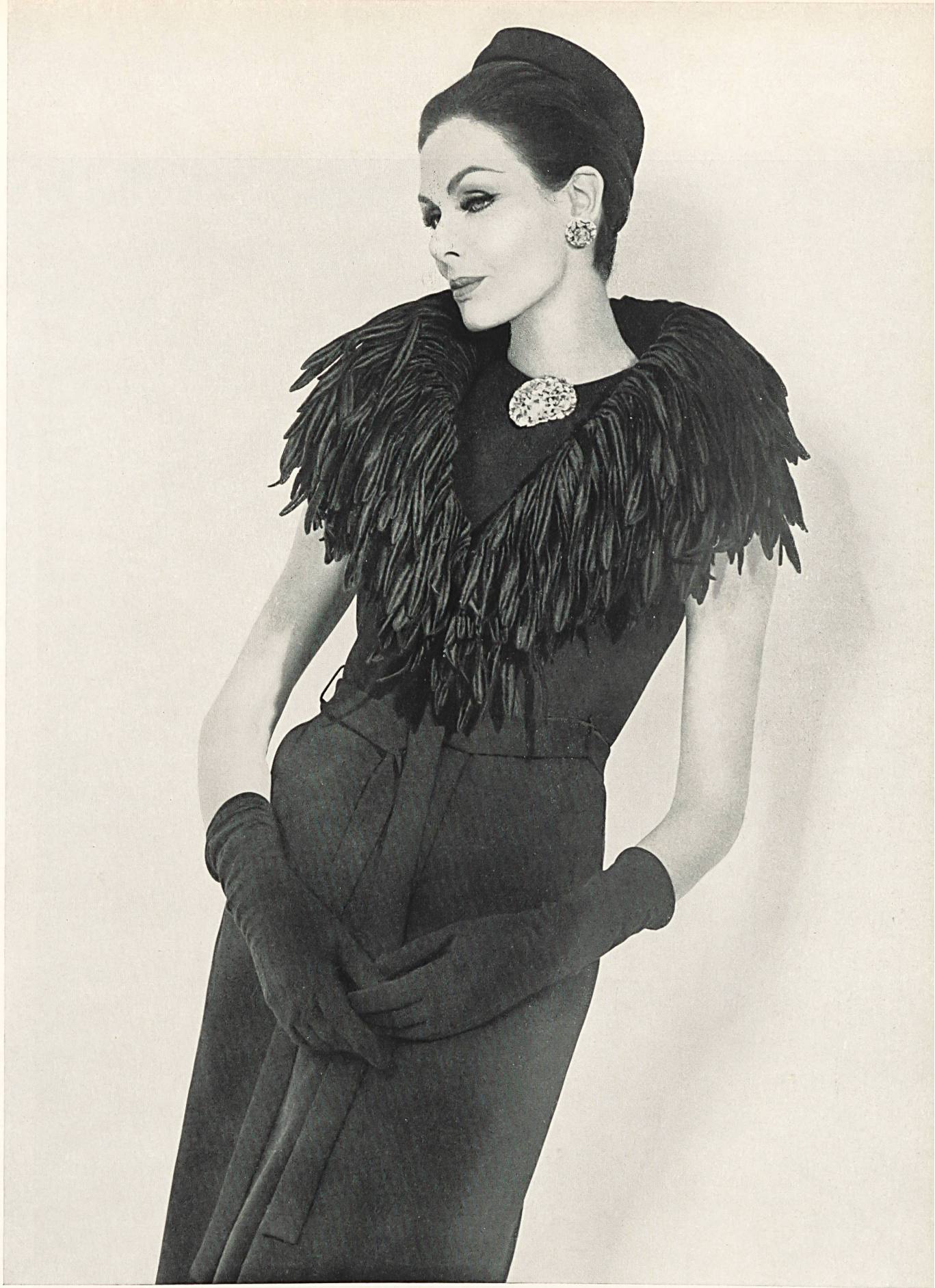
CHRISTIAN DIOR Franges brodées de Forster Willi & Co., Saint-Gall