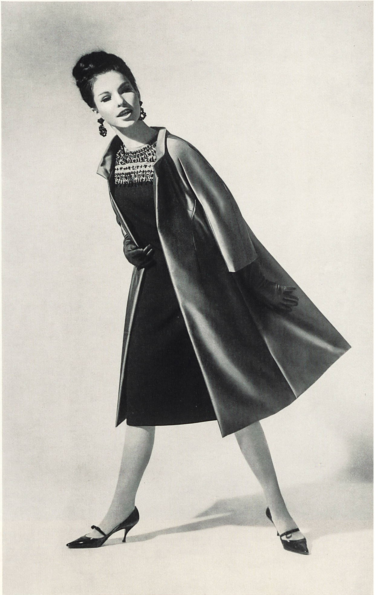
HEER & CIE S. A., THALWIL Crêpe Derby rayonne (robe / dress / Kleid / vestido) Satin Magic (man- teau / coat / abrigo / Mantel) Modèle Willy Meyer S. A., Zurich