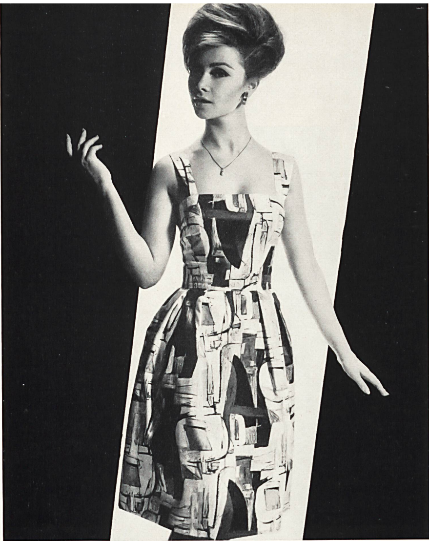
HEER & CIE S. A., THALWIL « Charme », shantung pure soie / pure silk / seda pura / reine Seide Robe fabriquée par El-El S. A., Zurich