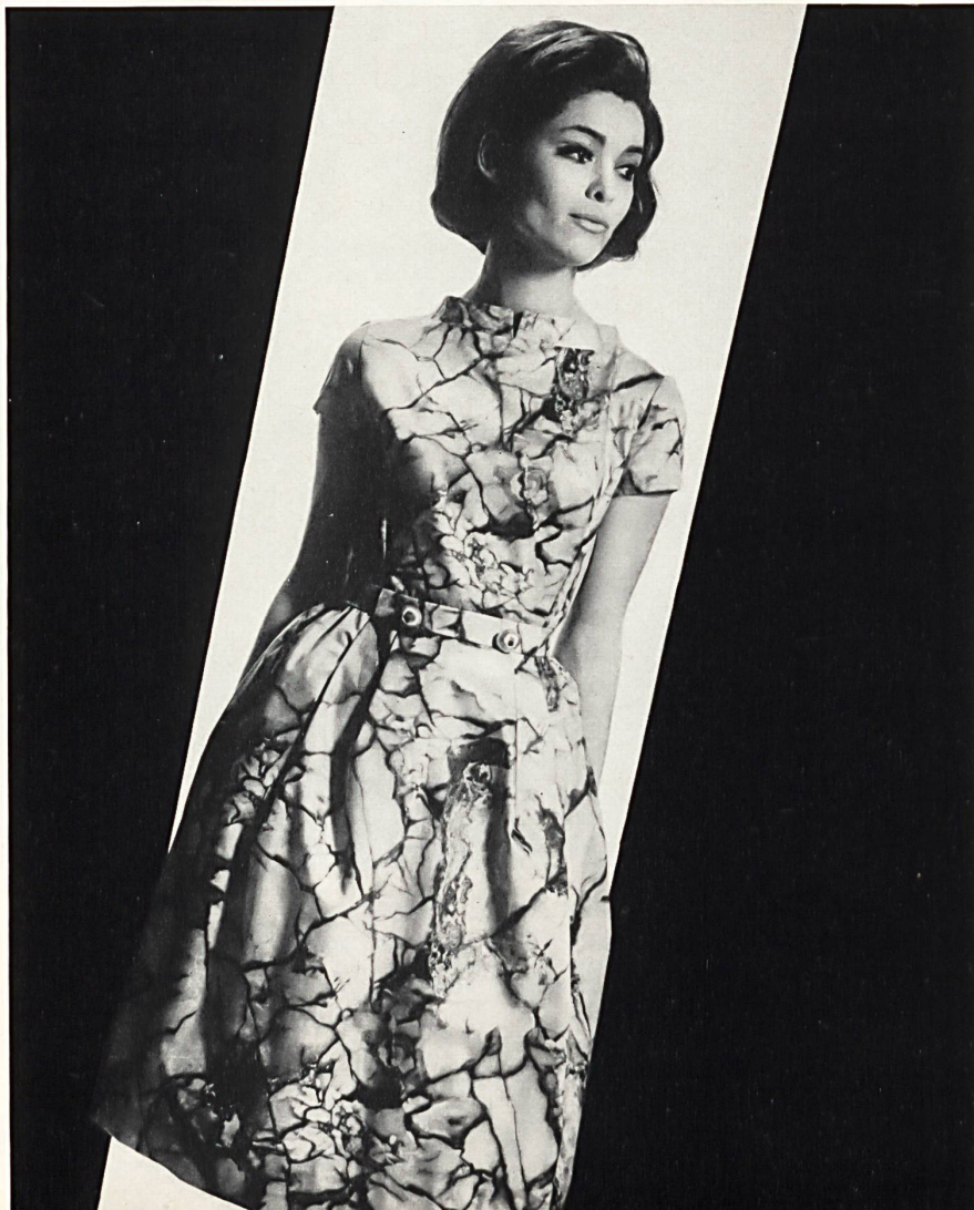
METTLER & CO., SAINT-GALL Coton imprimé / printed pure cotton / algodón puro estampado / reine Baum- wolle, bedruckt Modèle El-El S. A., Zurich « Swiss Minicare » Joseph Bancroft & Sons Co. A.G., Zurich