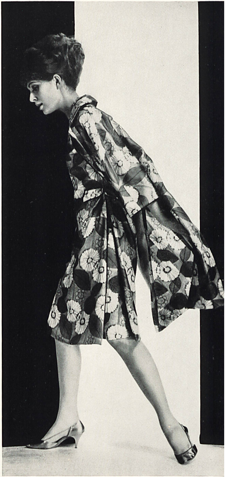
SOIERIES STEHLI S. A., ZURICH « Malibran », soie naturelle imprimée / printed pure silk / seda pura estampada / reine Seide, bedruckt Modèle Willy Meyer S. A., Zurich