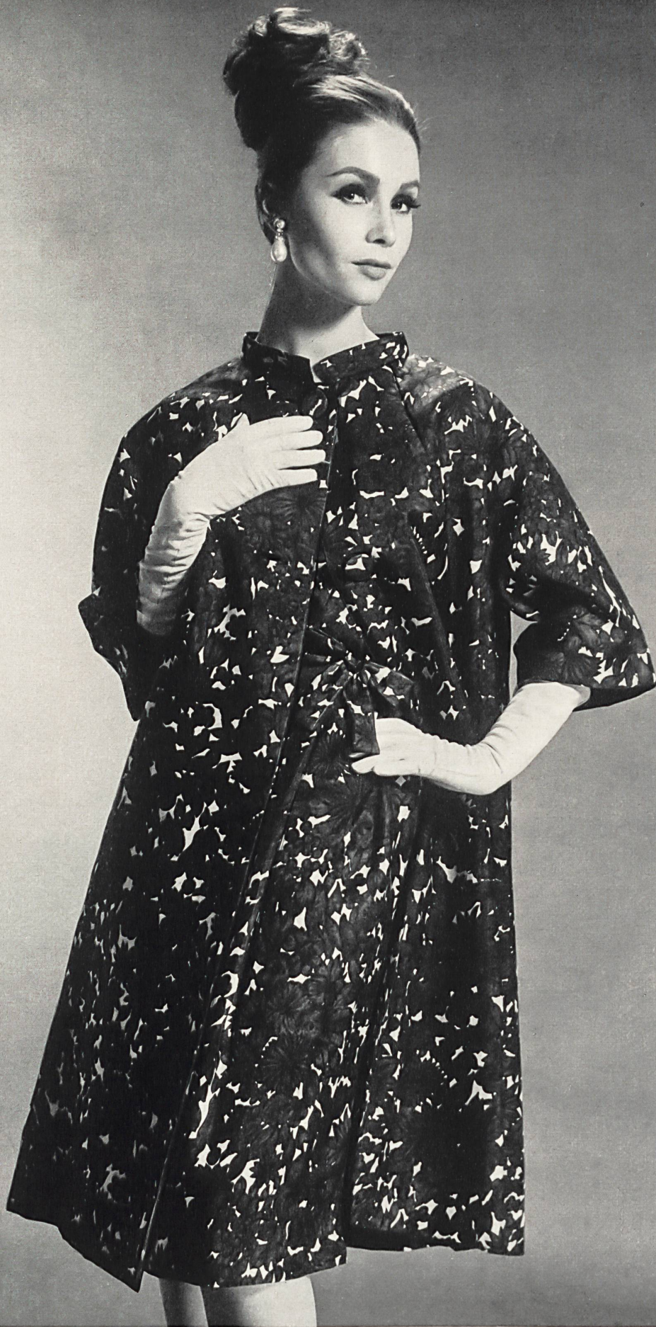
SOIERIES STEHLI S. A., ZURICH «Malibran», soie naturelle imprimée / printed pure silk / seda pura estampada / reine Seide, bedruckt Modèle E. Weber & Cie, Zurich