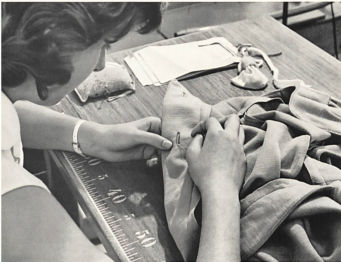
Auf die Förderung des Nachwuchses wird in der schweizerischen Wirkerei- und Strickerei-Industrie grossen Wert gelegt