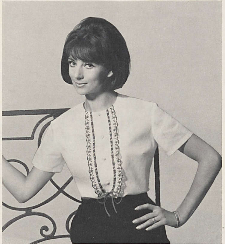
EISENHUT & CIE, GAIS Plastron brodé Embroidered dicky Pechera bordada Bestickter Plastron Modèle Valisère, Grenoble