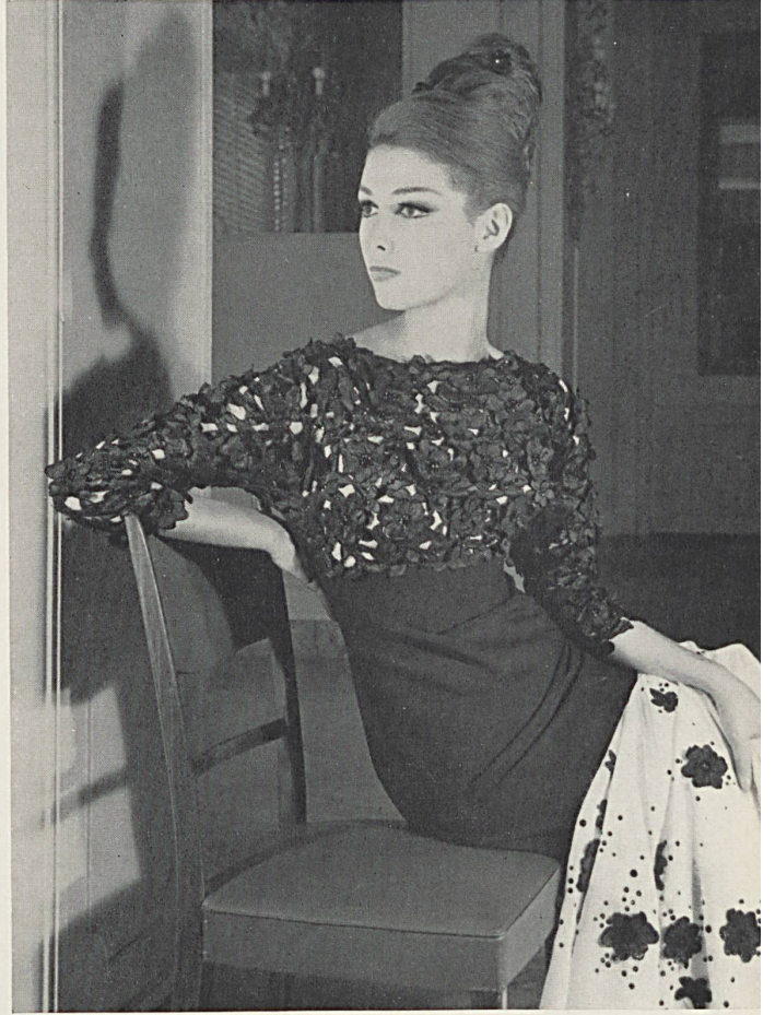
Corsage en broderie découpée verte de Saint-Gall avec appli- cations; les mêmes motifs découpés sont appliqués sur l'étole Bodice in green St. Gall cut-out embroidery with appliqué work; the same cut-out patterns are applied on the stole Corpino de encaje suizo recortado verde, con aplicaciones; los mismos dibujos recortados, aplicados sobre una estola Bolero aus St. Galler Spachtelspitze mit Applikationen; die gleichen ausgeschnittenen Muster sind auf der Stola appliziert Modèle Emilio Schuberth, Rome