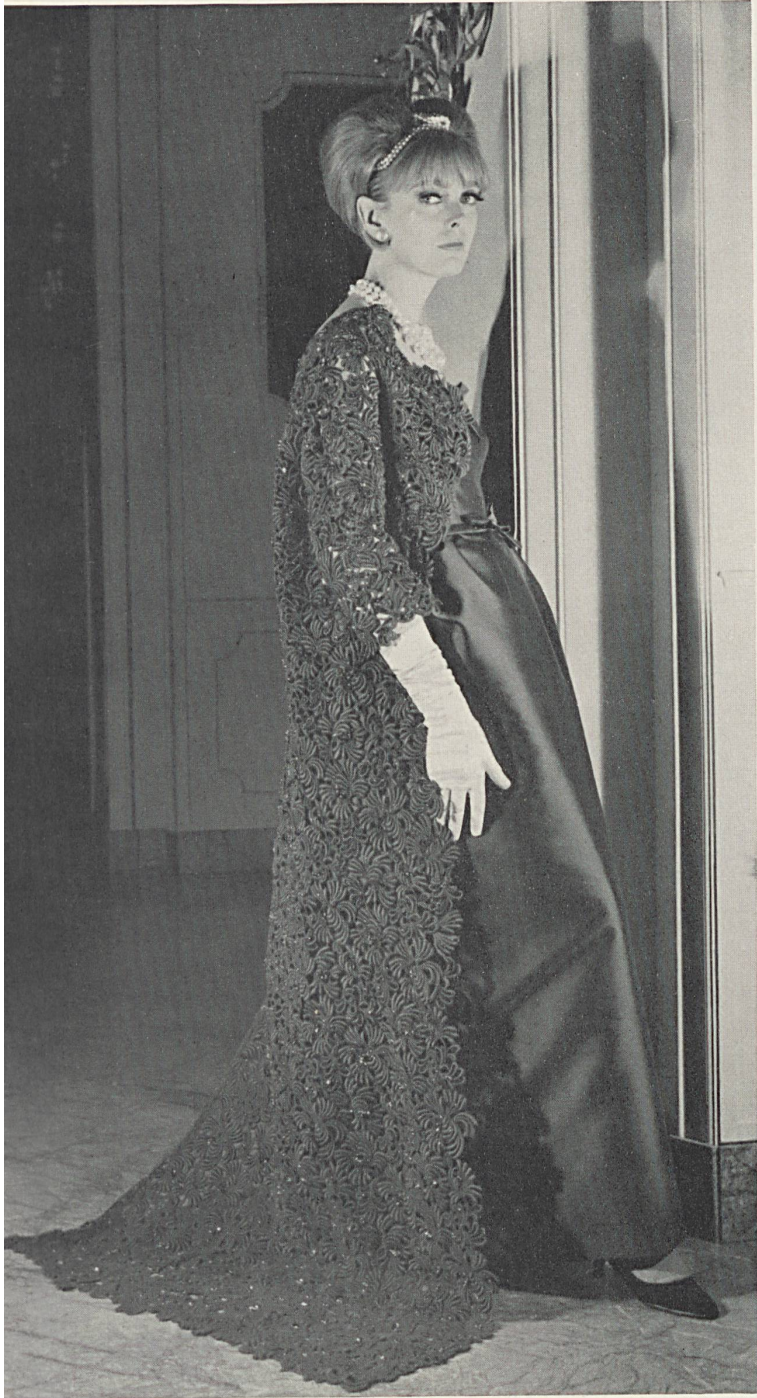
UNION S. A., SAINT-GALL Riche broderie guipure verte Rich green etched embroidery Rico encaje guipur verde Kostbare grüne Guipure-Stickerei Modèle Bicki, Milan