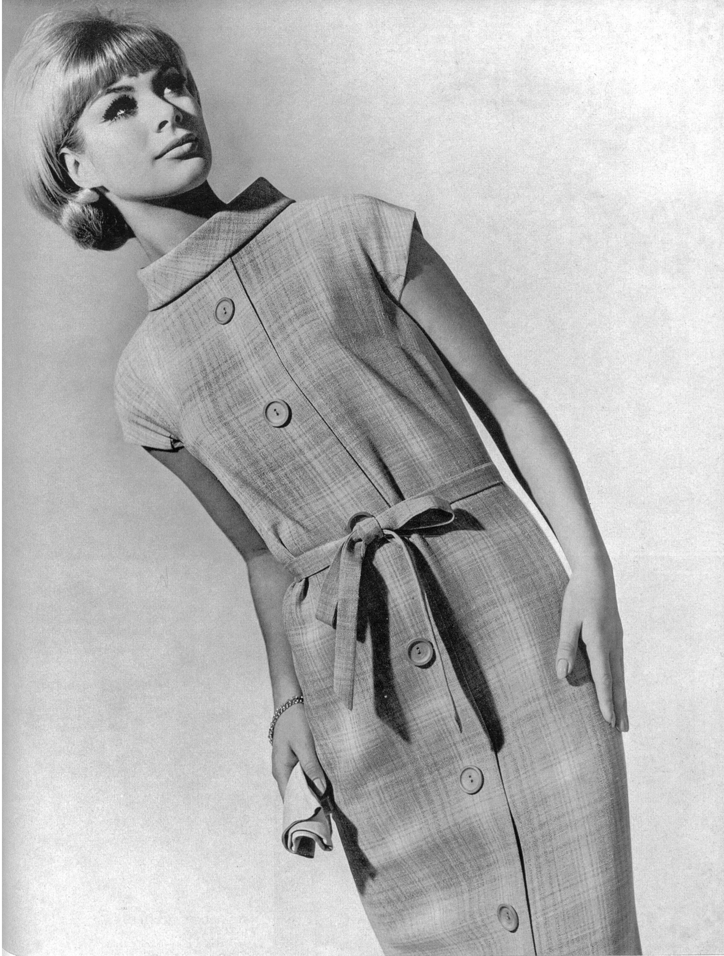
HEER & CIE S.A., THALWIL Tussana quadrillé, fibranne (staple-fibre / fibrana / Stapelfaser) Modèle Brüllmann & Co., Zurich