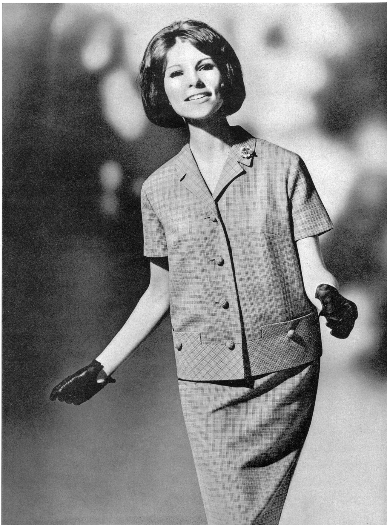
HEER & CIE S.A., THALWIL « Térylène » fantaisie (« Térylène »/laine - « Terylene »/wool - « Terylene »/lana - « Terylene »/Wolle) Modèle Paul Weibel A.G., Gossau