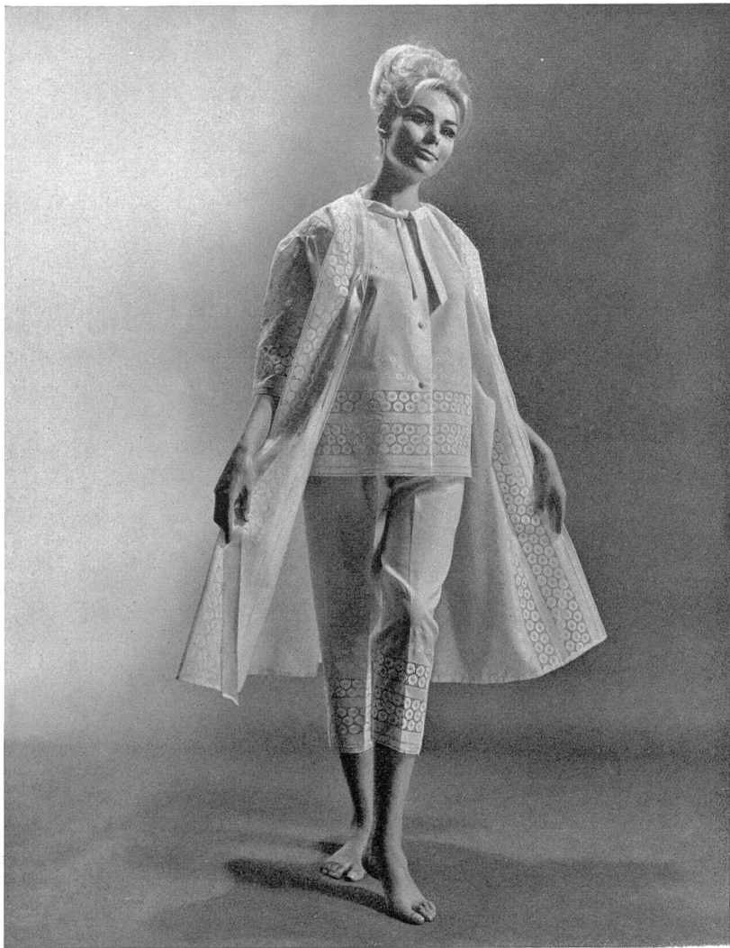
1 JACOB ROHNER S.A., REBSTEIN Batiste de coton « Minicare » brodée (embroidered cotton / algodón bordado / bestickte Baumwolle) Modèle Max Jablonsky, Zurich