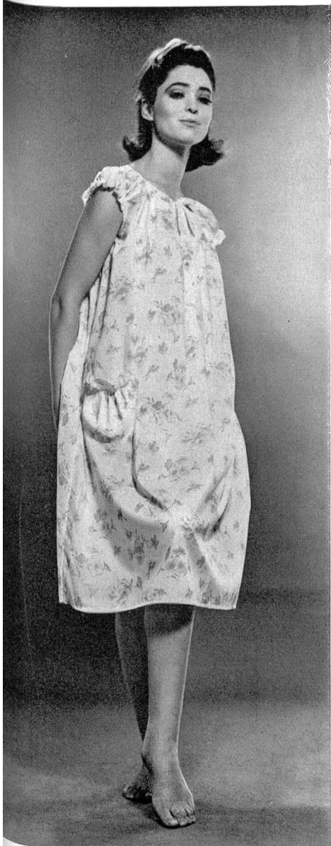
HAUSAMMANN TEXTILES S.A., WINTERTHUR « Hélanca » Diaphane « Minicare » imprimé (printed / estampado / bedrukt) Modèle Züst zur Rose, Rheineck « Minicare », Joseph Bancroft & Sons Co. A.G., Zurich