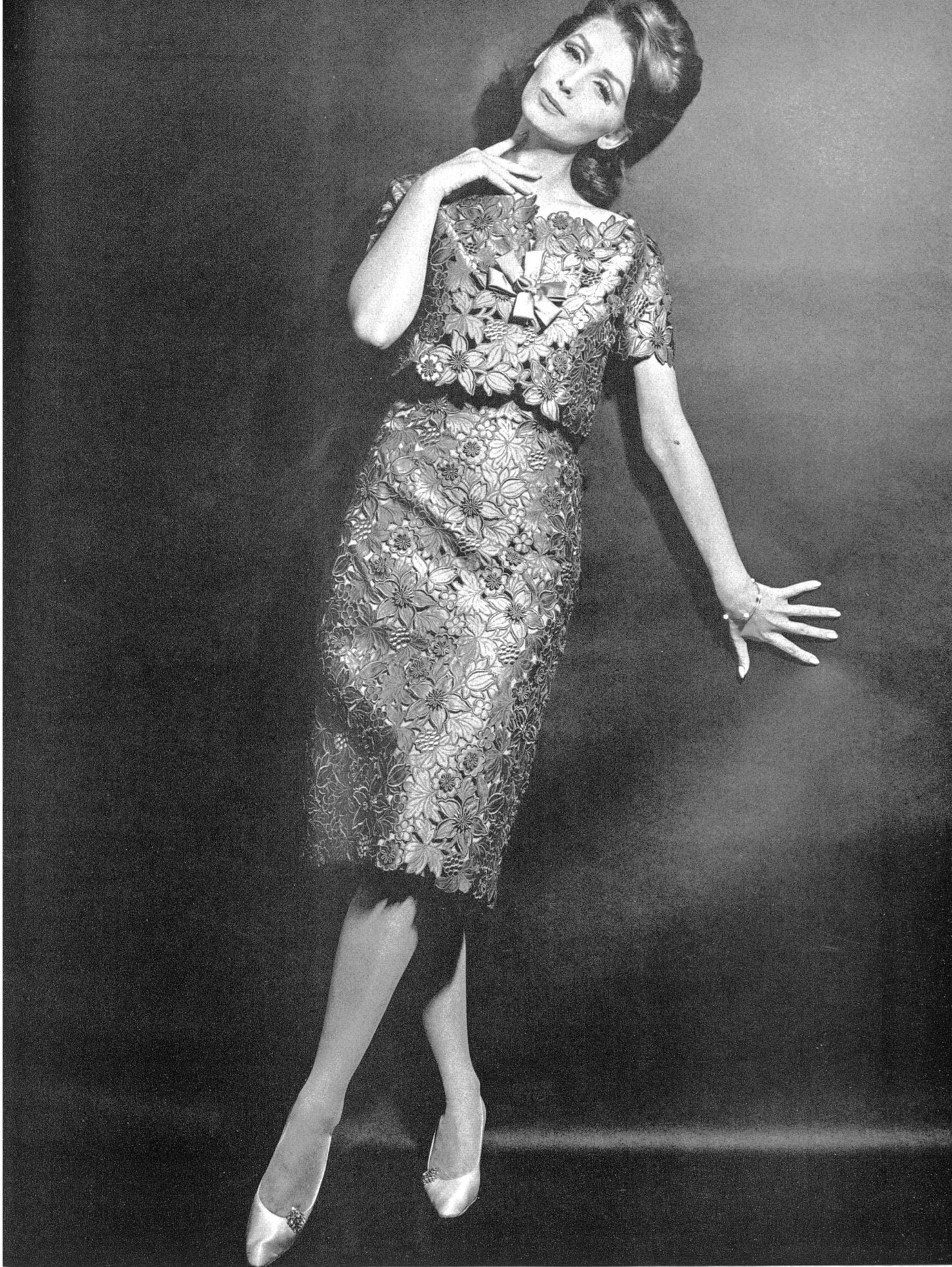
UNION S.A., SAINT-GALL Broderie découpée sur soie Seiden-Spachtelspitze Modèle Toni Schiesser, Francfort s. l. Main