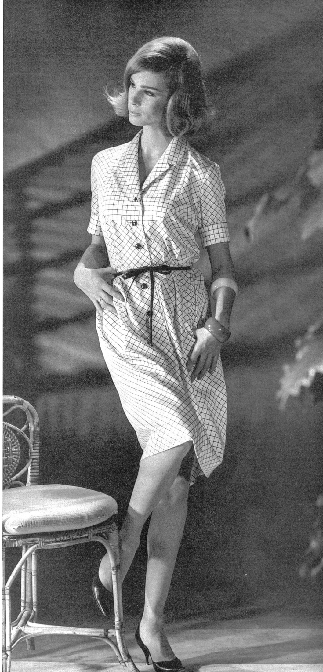
METTLER & CIE S.A., SAINT-GALL Satin de coton Baumwollsatin Modèle Lindenstaedt & Brettschneider, Berlin