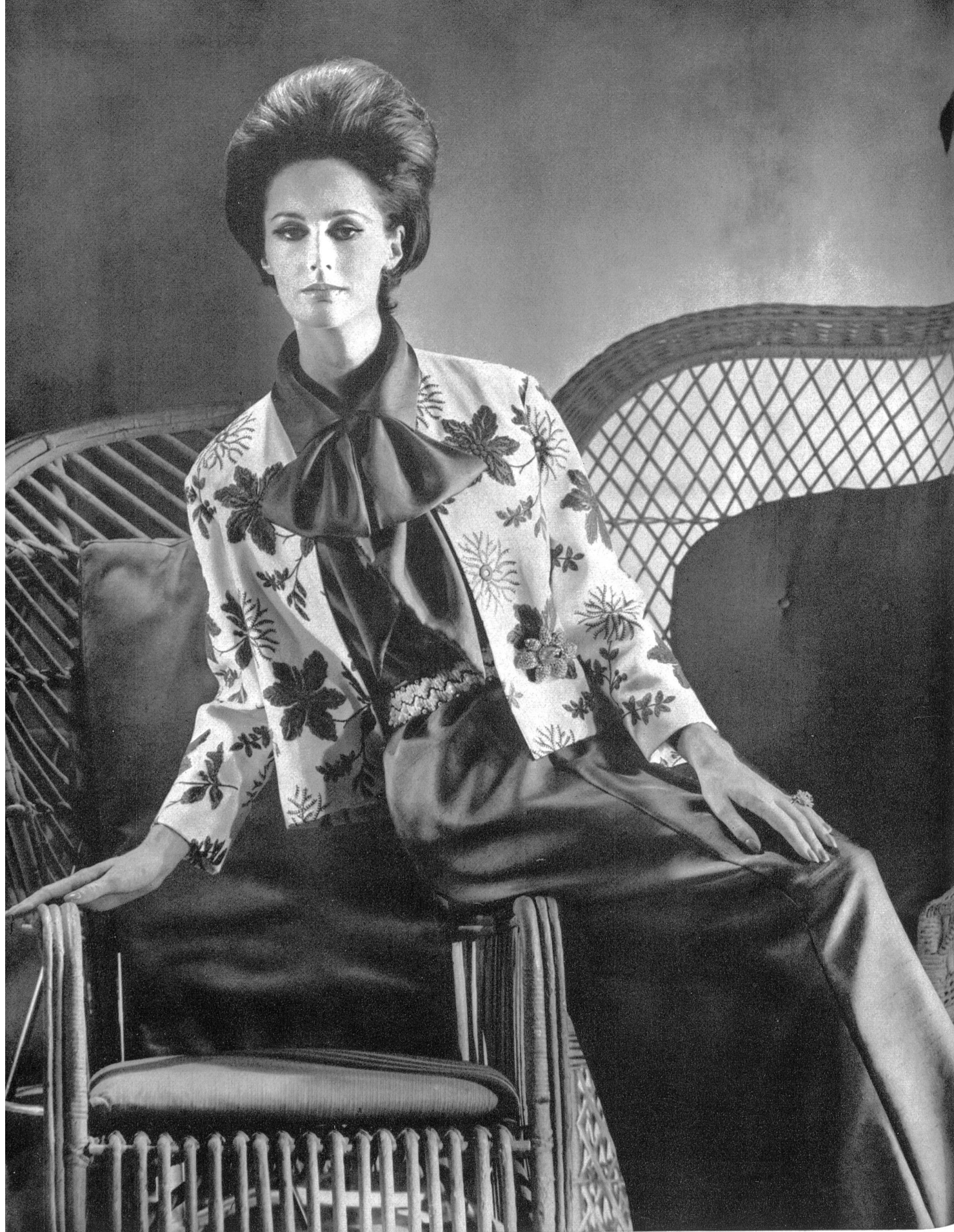
FORSTER WILLI & CO., SAINT-GALL Piqué de coton brodé (jaquette) Bestickter Baumwollpiquee (Jacke) Modèle Uli Richter, Berlin