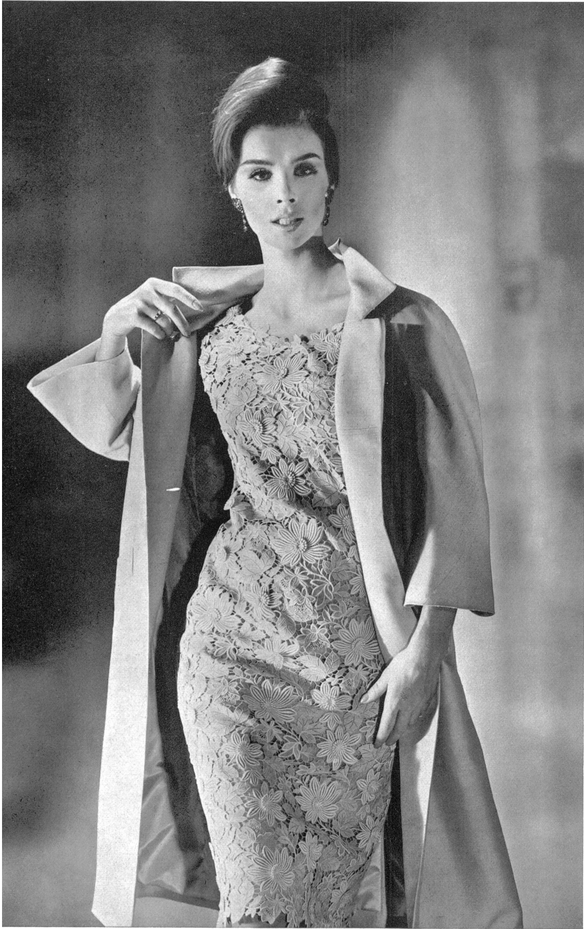
UNION S.A., SAINT-GALL Guipure lourde avec appli- cations Reiche Ätztickerei mit Applikationen Modèle Detlev Albers. Berlin