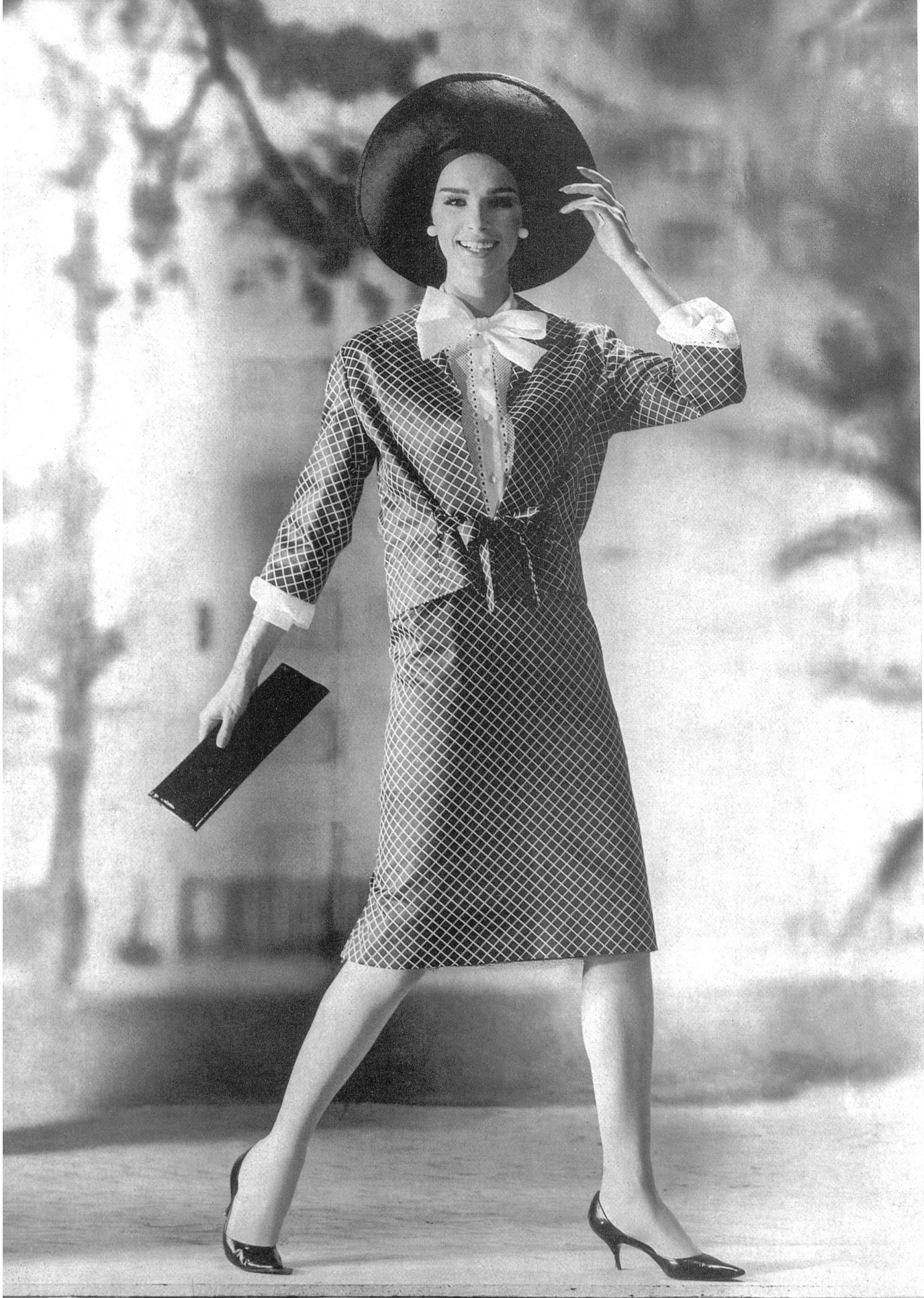
METTLER & CIE S.A., SAINT-GALL Satin de coton Baumwollsatin Modèle Lindenstaedt & Brettschneider, Berlin