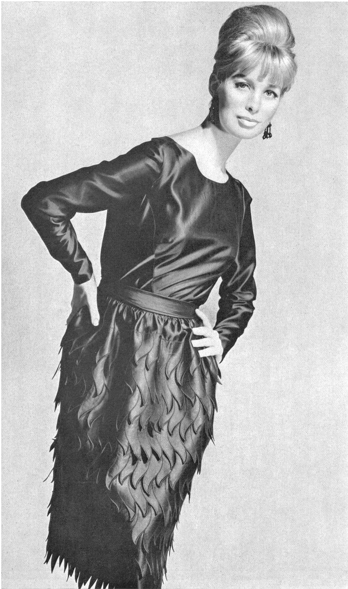
A NAEF & CIE S.A., FLAWIL Broderie / Stickerei Modèle Toni Schiesser, Francfort s. l. Main