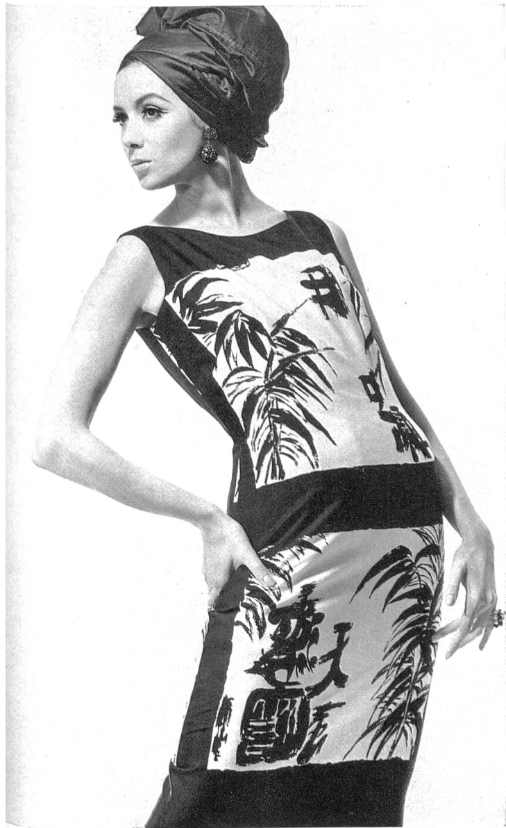
HEER & CIE S.A., THALWIL Panama de coton imprimé Baumwoll-Panama, bedruckt Modèle Lürman & Co., Rottach am Tegernsee