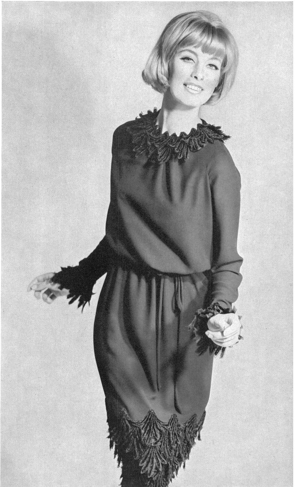
A. NAEF & CIE S.A., FLAWIL Broderie chenille noire Schwarze Chenillestickerei Modèle Toni Schiesser, Francfort s. l. Main