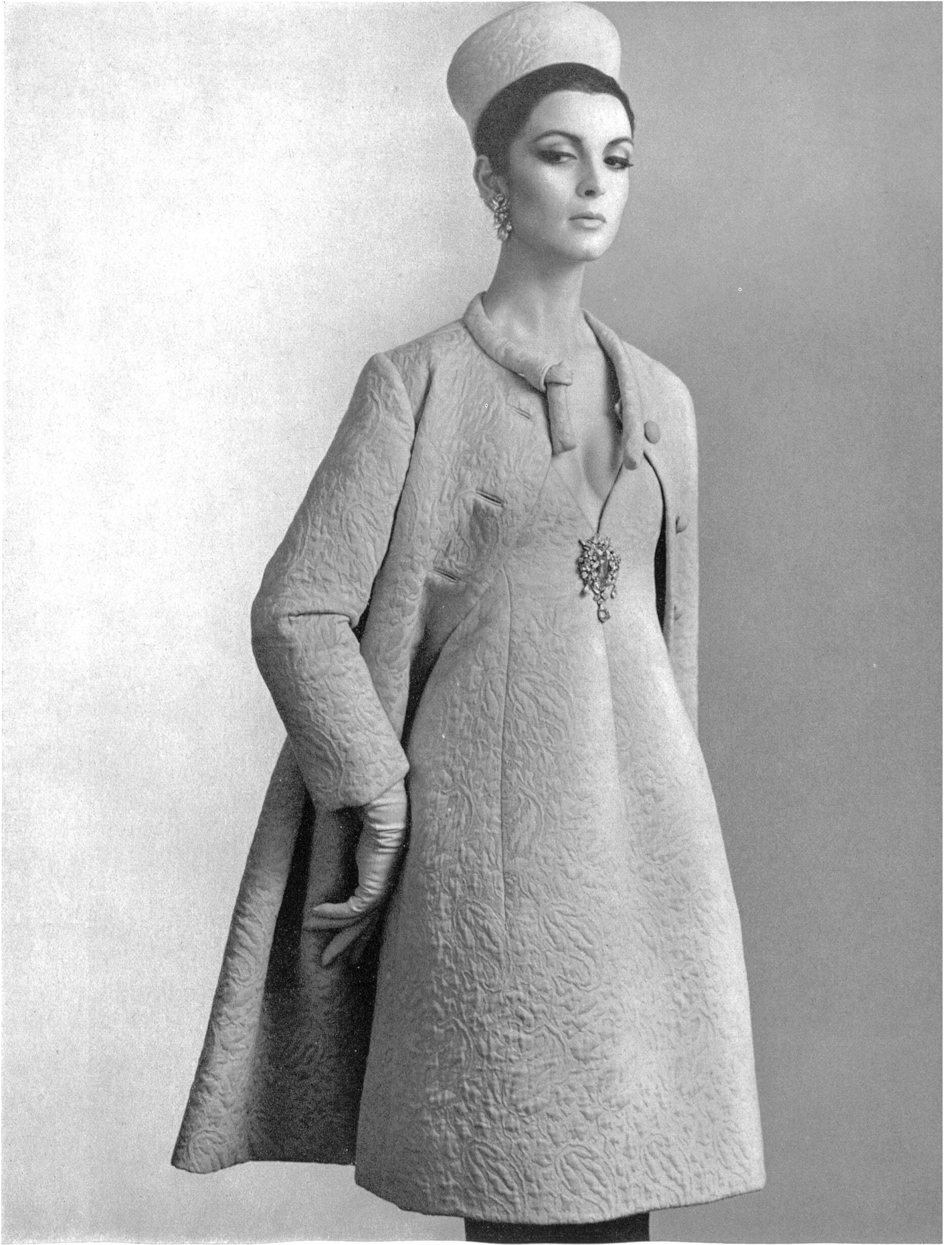
CHRISTIAN DIOR Matelassé « Safir » de L. Abraham & Cie, Soieries S. A., Zurich