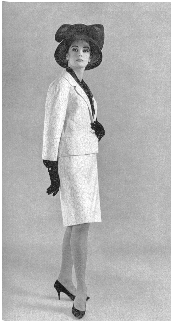
STOFFEL S. A., SAINT-GALL « Lovelace » coton jacquard à fils coupés Pure cotton jacquard fabric with clip-cord effects Modèle de Stefan pour Briarbrook