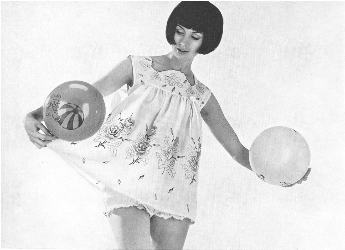
O. WESSNER & CO. GmbH, SAINT-GALL Batiste de coton Swiss Minicare Swiss Minicare Baumwollbatist Modèle Juhre Wäsche, Hambourg