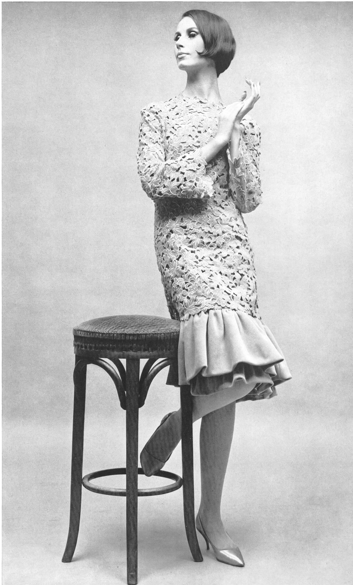
UNION S.A., SAINT-GALL Guipure velours Samtguipure Modèle Toni Schiesser, Francfort