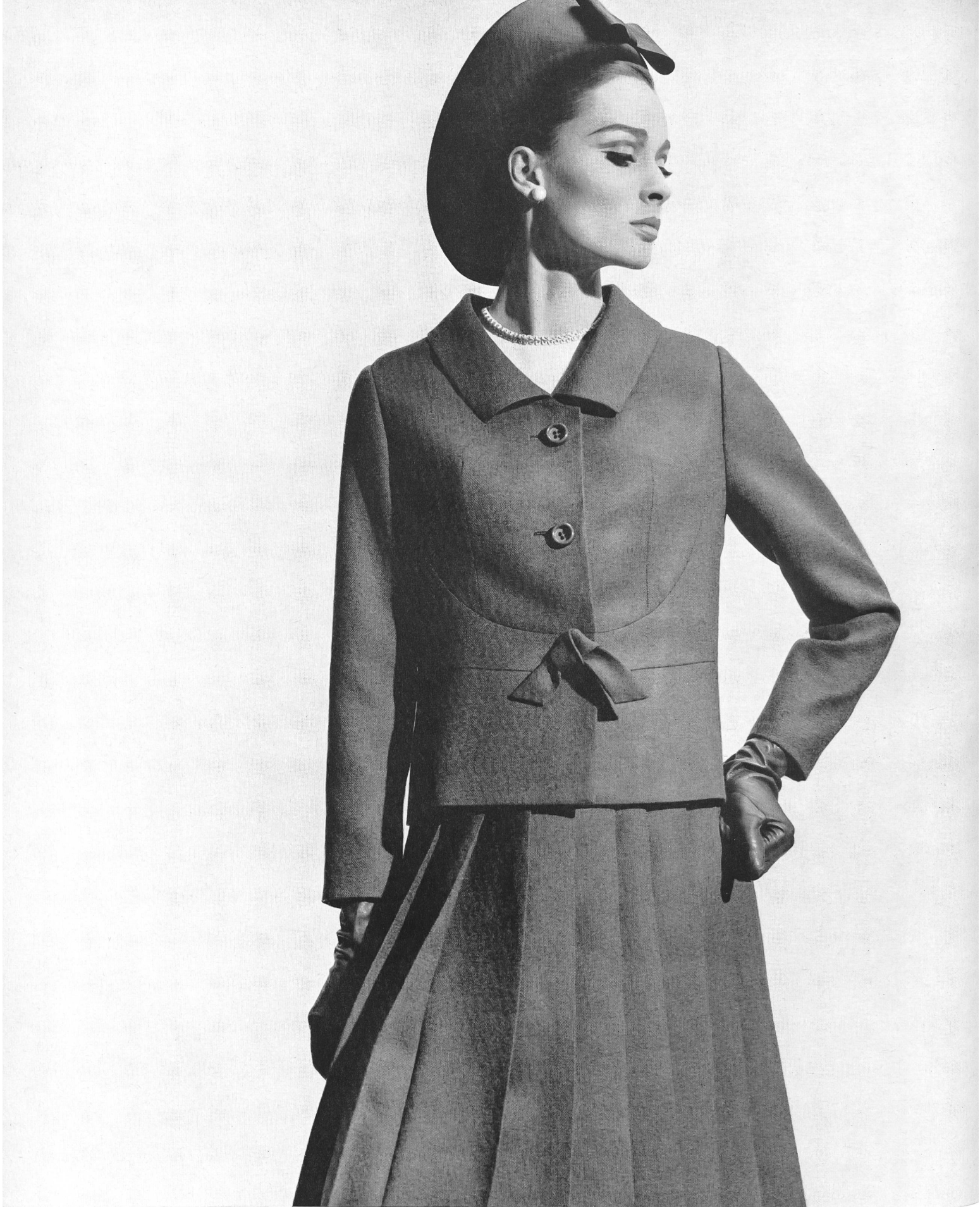
GUGGENHEIM & EINSTEIN, ZURICH Tissu de laine peignée olive Olivfarbenes Kammgarngewebe Modèle « acofra », Francfort