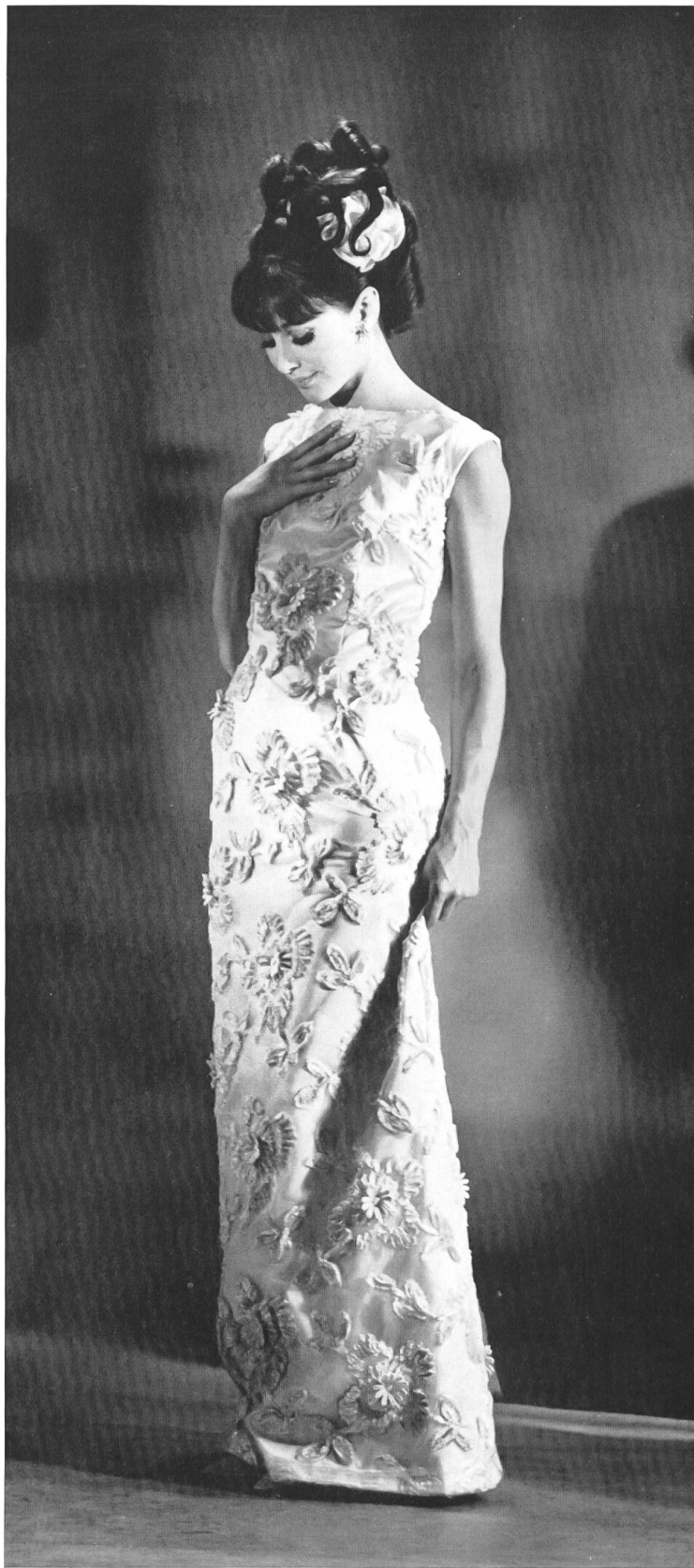
FORSTER WILLI & CO., SAINT-GALL

Ein Schlagwort, das neben « stretch » die Gemüter der Wäsche- und Miederfabrikanten bewegt, ist die « set-Idee », d.h. man will die Verbraucherin dazu bringen, sich Garnituren anzuschaffen, bei denen alles haargenau über-