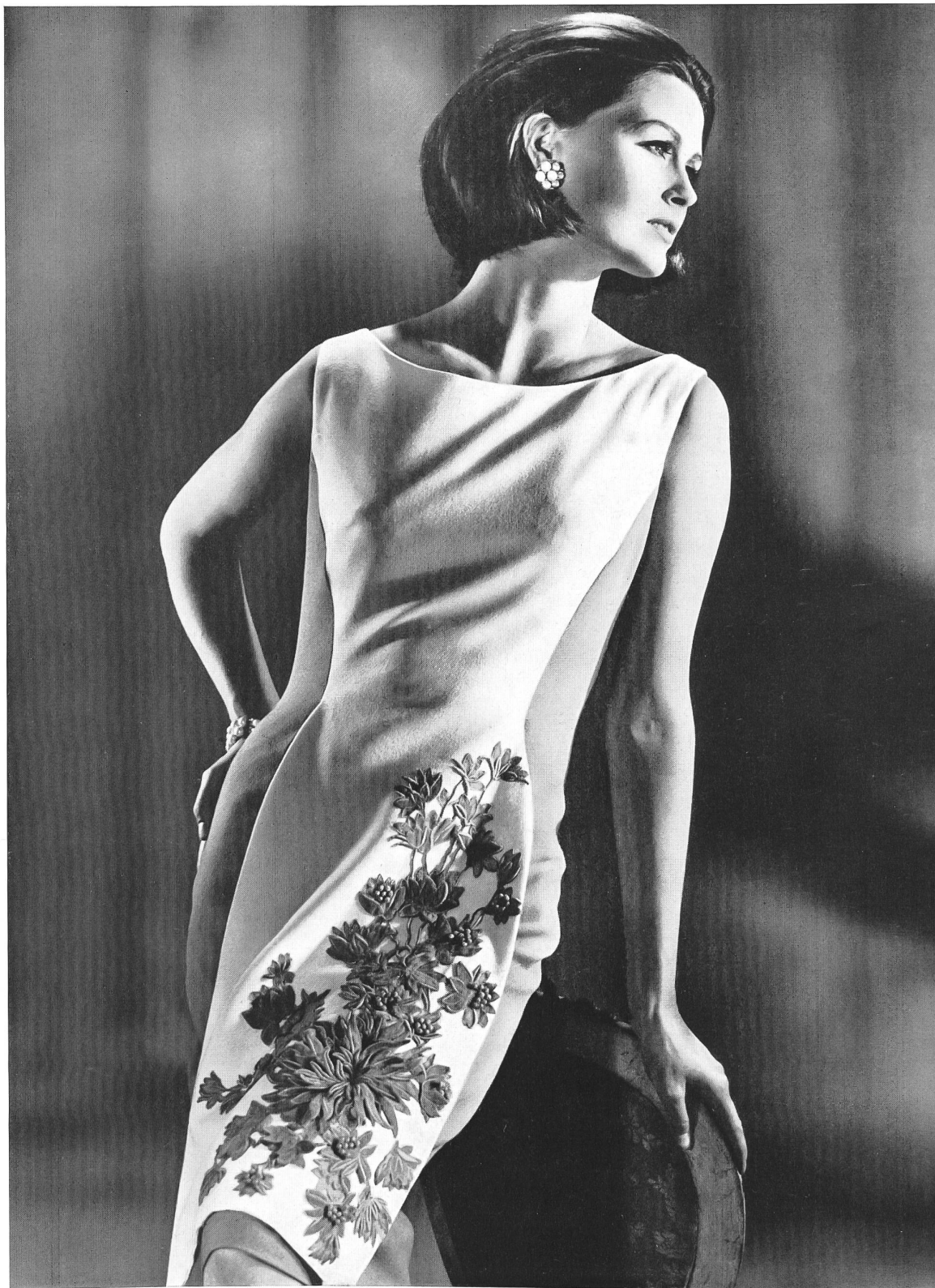
UNION S.A., SAINT-GALL Broderie découpée sur velours, avec applications Samt-Spachtelspitze mit Applikationen Modèle Zweigler, Wasserliesch

Bei den letzten Konfektionsschauen in Berlin (in der Fachsprache «Durchreise» genannt) meldete sich ein neues Haus zu Wort: Ernst Kuchling, bisher enger Mitarbeiter von Detlev Albers, hat sich selbständig gemacht und zeigte eine sehr junge, legere Kollektion, in der die schlichten Deux-pièces aus Crêpe mit angearbeitetem