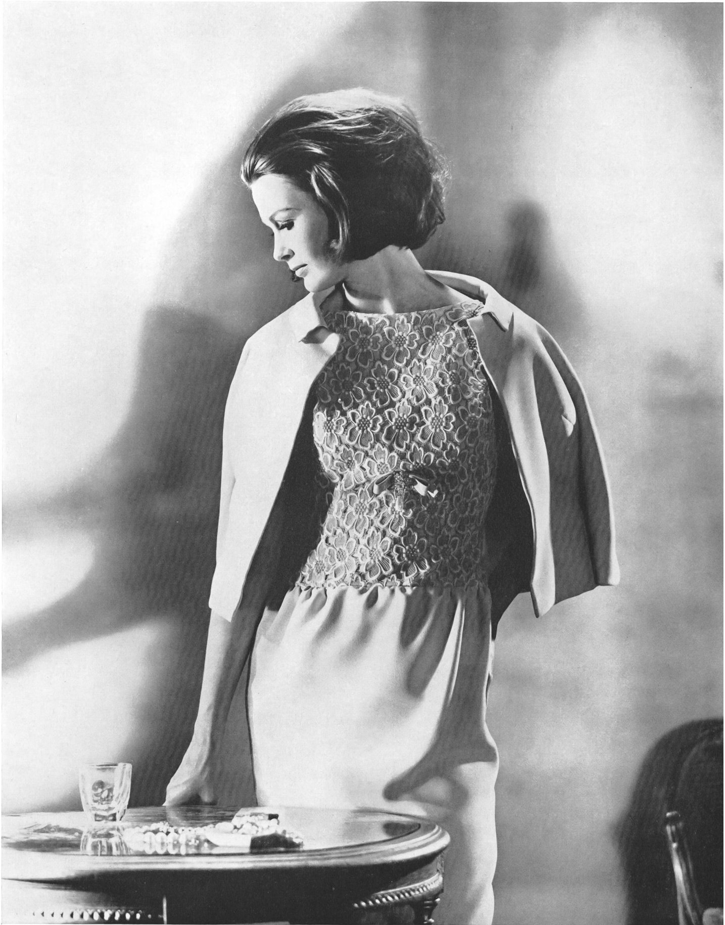
FORSTER WILLI & CO., SAINT-GALL Guipure Modèle Ernst Kuchling, Berlin