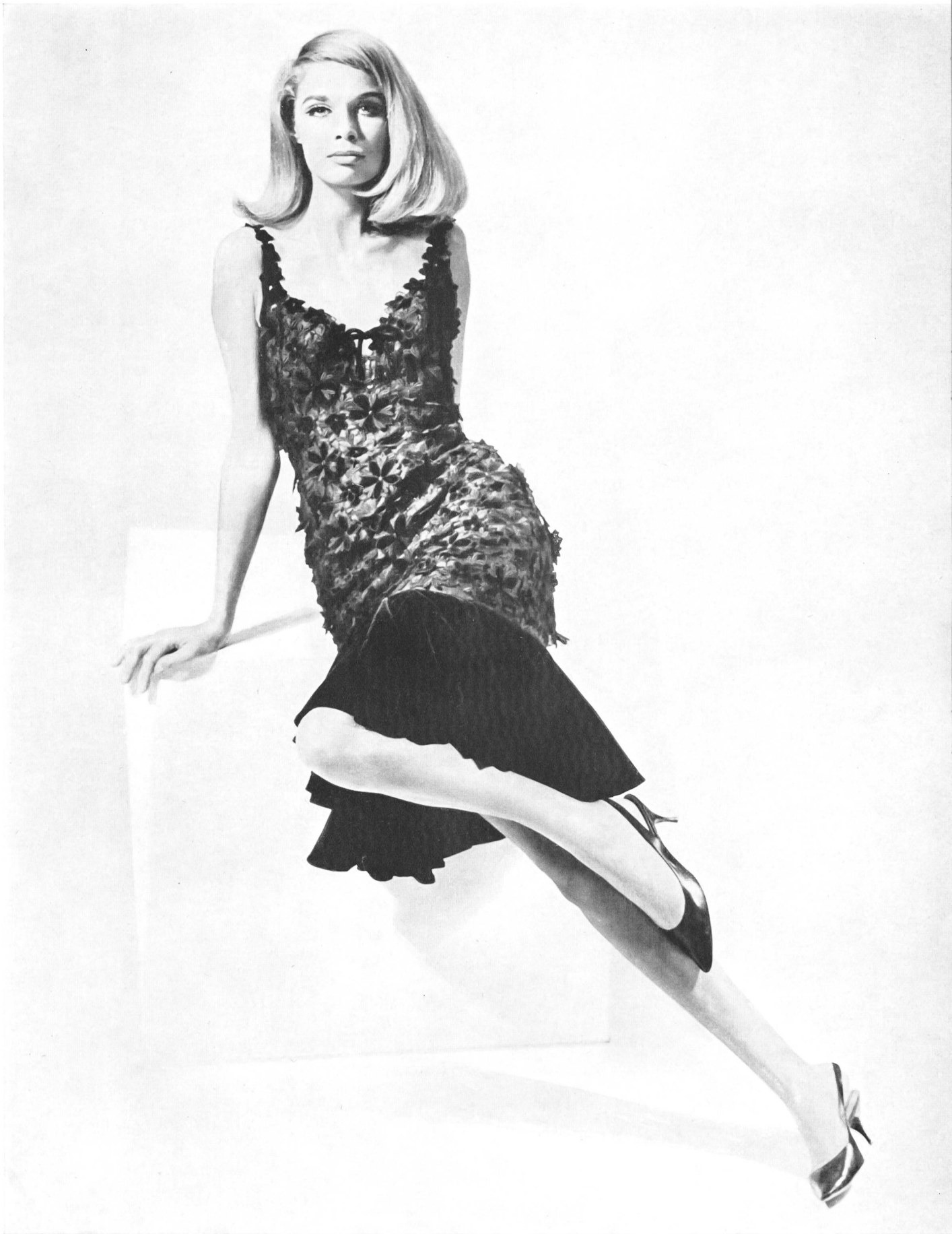
A. NAEF & CIE S.A., FLAWIL (SAINT-GALL) Broderie / Stickerei Modèle Toni Schiesser, Francfort