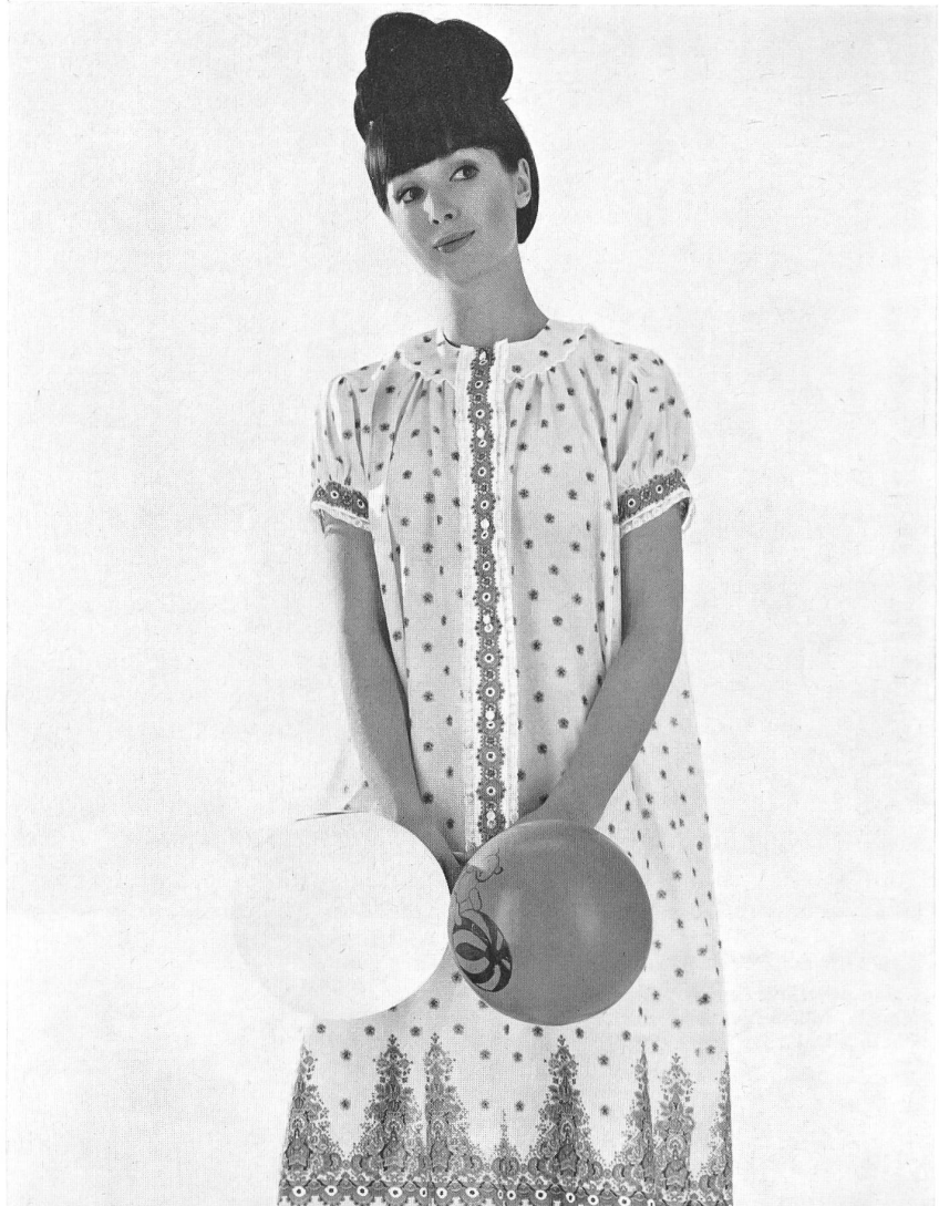
HAUSAMMANN TEXTILES S.A., WINTERTHUR Batiste de coton Swiss Minicare Swiss Minicare Baumwollbatist Modèle Elsbach Wäschefabriken, Herford