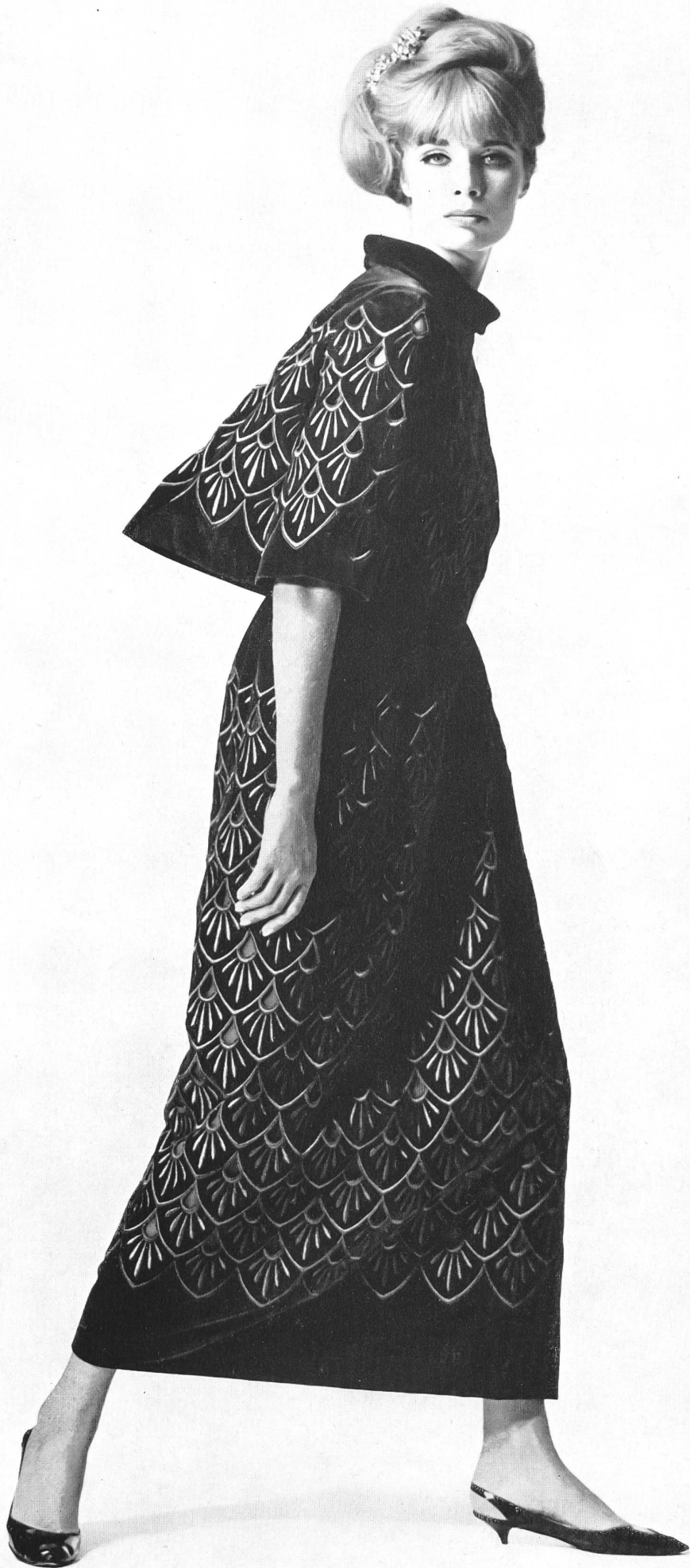
UNION S.A., SAINT-GALL Broderie sur velours vert émeraude Smaragdgrüne Samstickerei Modèle Toni Schiesser, Francfort