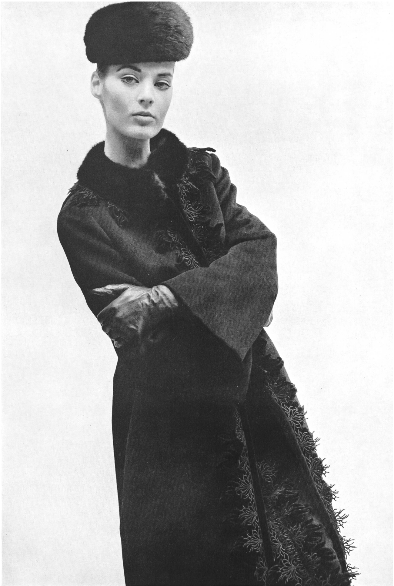
A. NAEF & CIE S.A., FLAWIL (SAINT-GALL) Galon de velours avec application de guipure Modèle Toni Schiesser, Francfort