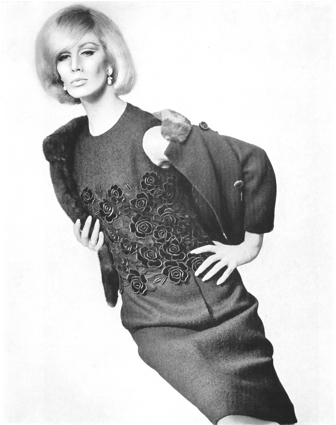
UNION S.A., SAINT-GALL Velours guipure Samtguipure Modèle Toni Schiesser, Frankfort

Oberteil aus Schweizer Spitze ebenso vertreten sind, wie sie es im Hause Albers waren.