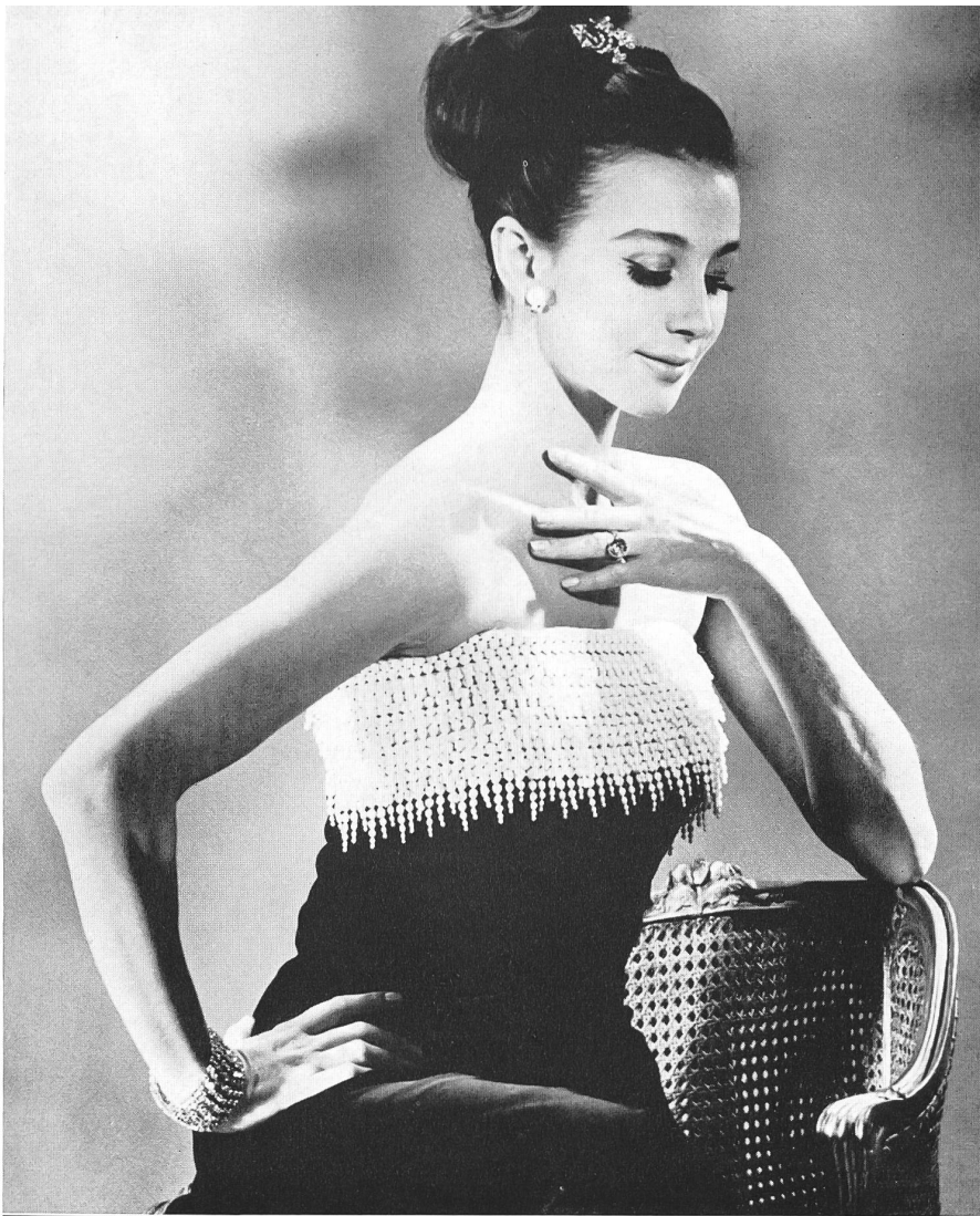
A. NAEF & CIE S.A., FLAWIL (SAINT-GALL) Guipure Modèle H. W. Busse, Berlin