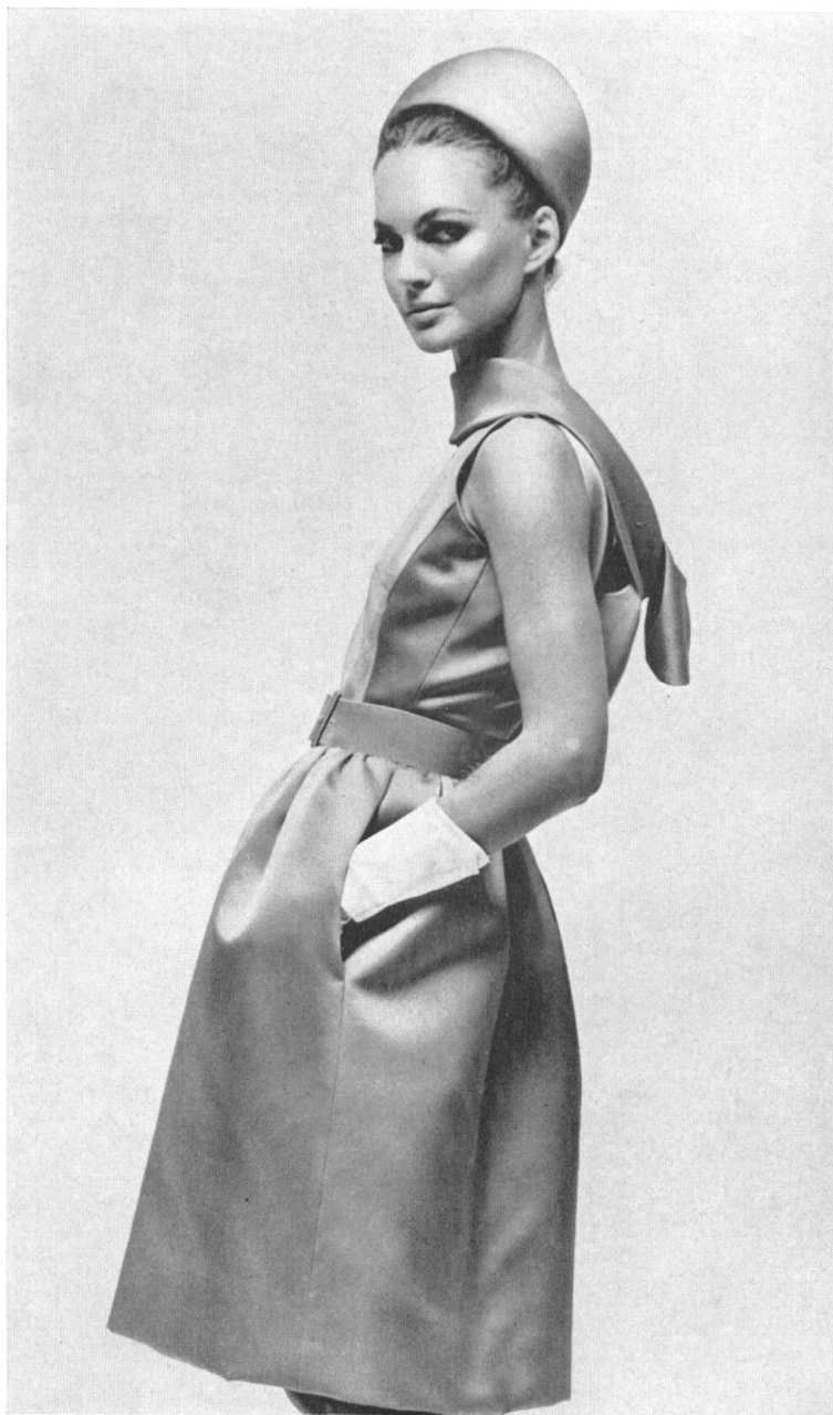
L. ABRAHAM & CO. SILKS LTD., ZURICH Satin double face turquoise Turquoise double faced satin Modèle: Elisabeth Arden, New York