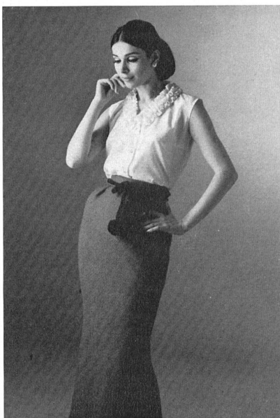
Gewebe aus 100 % Vestan (Bluse) und Vestan mit 45 % Schurwolle (Rock) von Heer & Co. AG., Thalwil (Zürich) Modelle Renommée AG., Montreux (Bluse) und A. Blum & Co., Zürich (Rock)