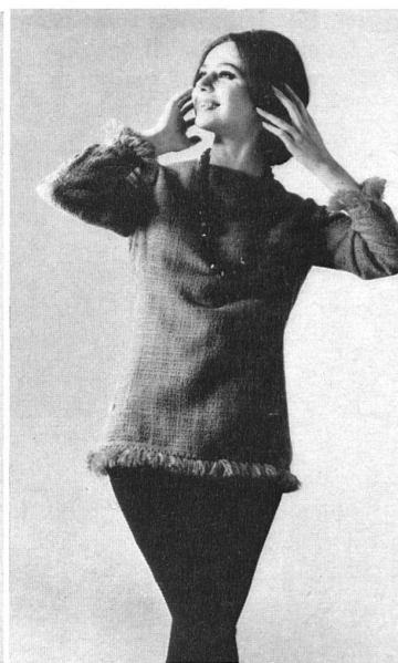
Vestan-Gittergewebe (Blouson) von Heer & Co. AG., Thalwil (Zürich) und Vestan-Kammgarn mit 45 % Schurwolle (Hose) von der Tuchfabrik Sennwald, Sennwald Modell Theubet, Porrentruy