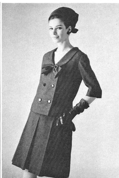
Vestan-Bouclé mit 45 % Schurwolle von Heer & Co. AG., Thalwil (Zürich) Modell Kaltenmark & Co. AG., Zürich