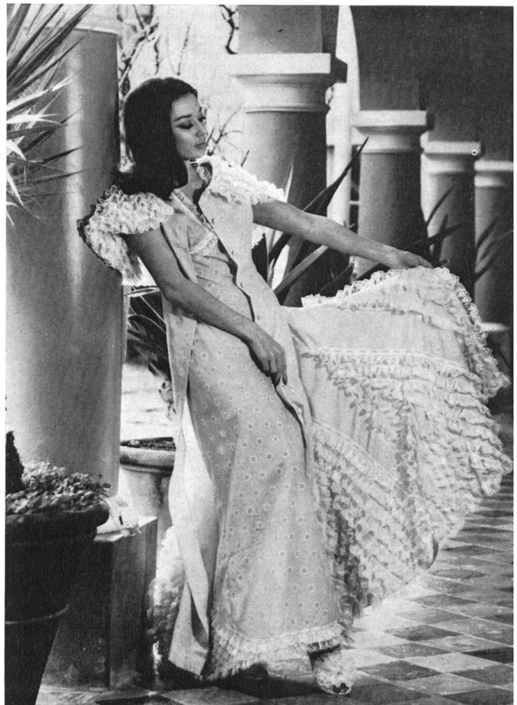
ALEX BAUER & CO., SAINT-GALL Batiste de Dralon brodée Embroidered Dralon batiste Batista de Dralon bordada; Bestickter Dralon-Batist Modèle Gaber, Rome

Unter dem Titel « Dralon in Couture und Boutique » organisierte die Textilfaserabteilung der Farbenfabriken Bayer AG, Leverkusen, Anfang April in Baden-Baden eine Gala-Première ihrer europäischen Modeschau. Diese Schau enthält an die 150 Couture-, Luxus-, Prêt-à-porter- und Trikotmodelle aus Frankreich, Deutschland, Italien und Schweden, hergestellt aus reinem und mit gekämmter Schurwolle oder mit anderen Kunst- oder Chemiefasern gemischtem « Dralon ». Die zahlreichen Themen der Vorführung, die vom Morgen bis zum Gala-Abend alle Beschäftigungen und Tageszeiten beleuchten, sollten zeigen, wie gut sich Strickwaren und Stoffe aus « Dralon » für jede Art von Bekleidung und für jede Situation eignen. An dieser für die Fachpresse bestimmten Veranstaltung beteiligten sich auch fünf Schweizer Fabrikanten, die « Dralon »-Fasern verarbeiten.