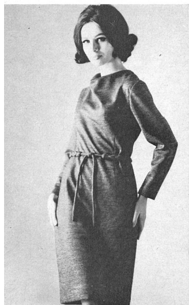
Vestan-Jersey mit Lurex von Robt. Schwarzenbach & Co., Thalwil (Zürich) Modell R. & J. Polla, Massagno-Lugano

oder Wollstreichgarn verwendet werden kann und sich für die Fabrikation von Blusenstoffen, Trikots und Jerseys und für alle Arten von Damen- und Herrenkleidern eignet. Die ungefähr 80 Modelle, von etwa dreissig Konfektionären aus Stoffen aus zehn Webereien geschaffen, boten reichlich Gelegenheit, nicht nur von den vielseitigen Verwendungsmöglichkeiten von « Vestan », sondern auch vom Interesse, das die Schweizer Industrie dieser Faser entgegenbringt, zu überzeugen.