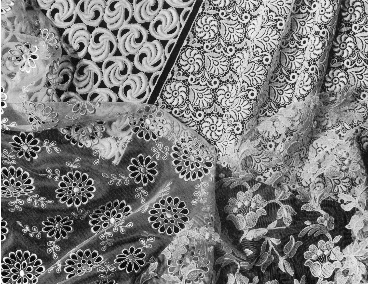
Laizes guipure ; laizes sur organza pure soie et sur tulle Guipure allover ; allover on pure silk organza and on tulle Telas de encaje guipur ; telas bordadas sobre organza pura seda y sobre tul Aetzallovers ; bestickte Allovers auf Reinseiden-Organza und auf Tüll