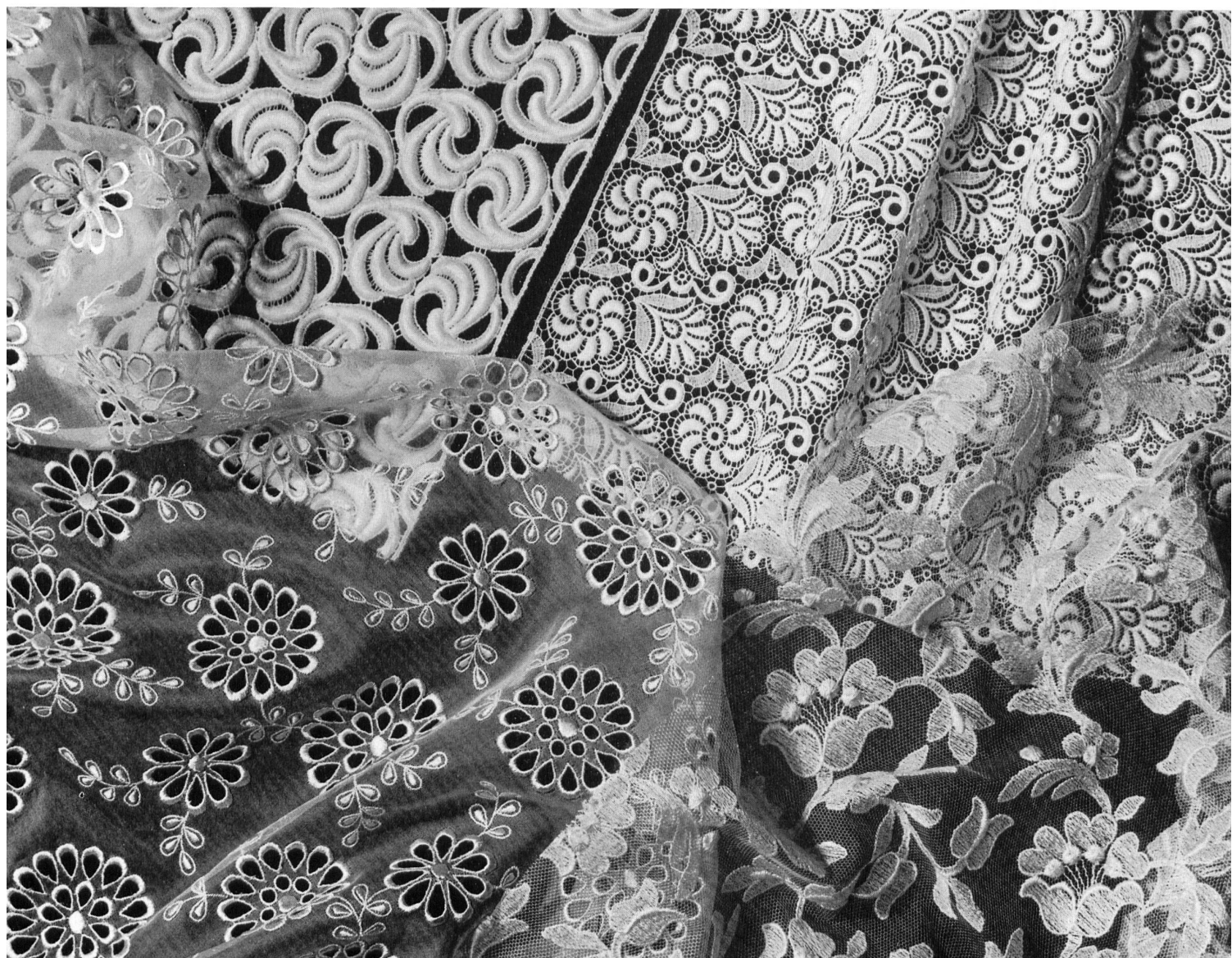
Laizes guipure ; laizes sur organza pure soie et sur tulle Guipure allover ; allover on pure silk organza and on tulle Telas de encaje guipur ; telas bordadas sobre organza pura seda y sobre tul Aetzallovers ; bestickte Allovers auf Reinseiden-Organza und auf Tüll