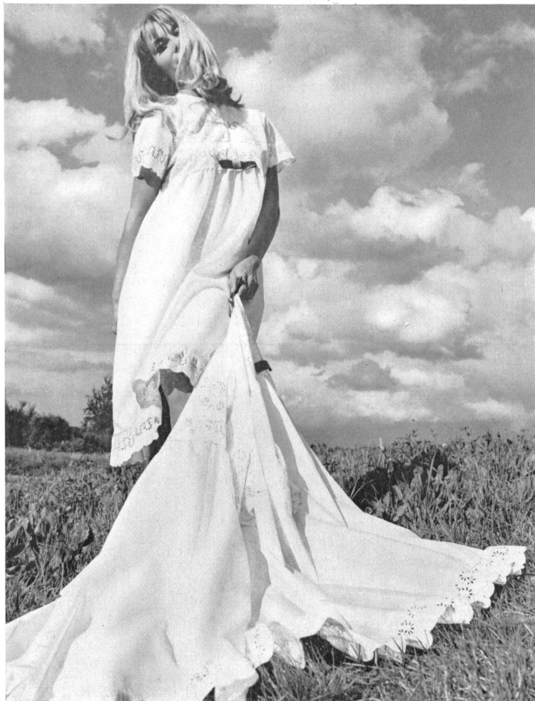
JOSEPH BANCROFT & SONS CO. AG. ZURICH Ensemble de terrasse en Ban-Lon jersey-mousseline Modèle: Acmé, Paris