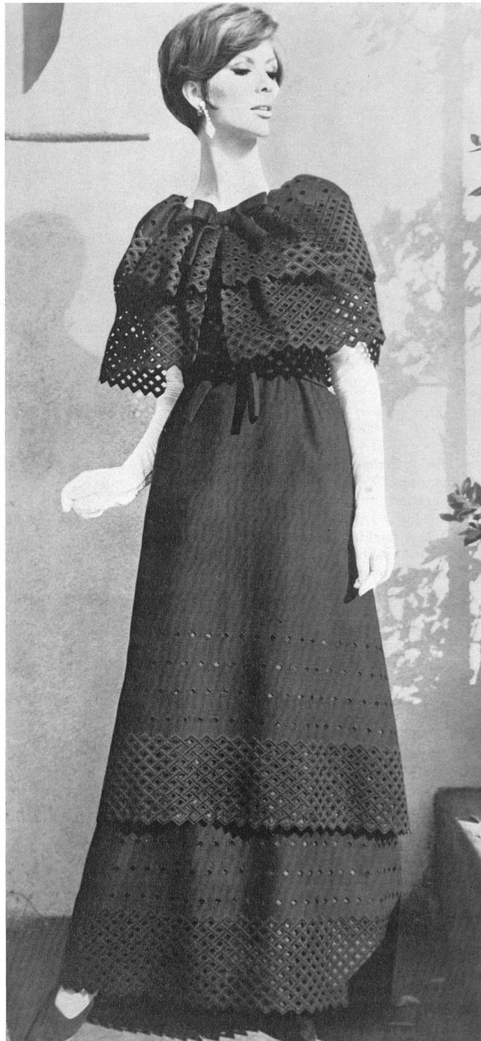
FORSTER WILLI & CO., SAINT-GALL Bordure brodée dans le nouveau style géométrique Embroidered edgings in the new geomet- rical style Modèle Michael Novarese, Los Angeles