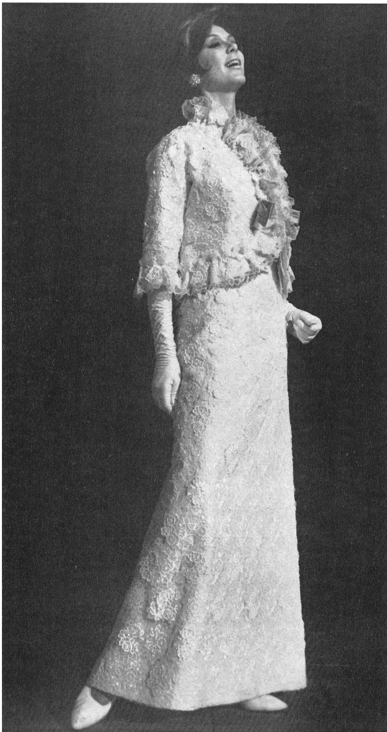
FORSTER WILLI & CO. SAINT-GALL Broderie avec applications sur organza de soie blanc Embroidered white silk organza with appliqué-work Modèle Michael Novarese, Los Angeles

Wechselnde Saison - wechselndes Modebild