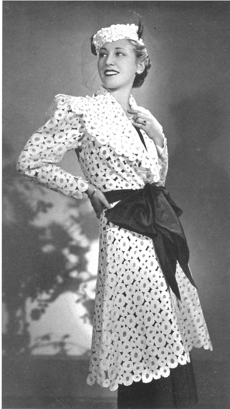
Casaque d'Agnès Drecoll, Paris.

La lingerie s'est enfin placée sous le signe de la frivolité; la trop grande simplicité est remplacée par des enrichissements de broderies et de dentelles appliqués avec un grand souci d'élégance. On connaît depuis longtemps les mouchoirs brodés ou garnis de dentelles, spécialité de St-Gall, qui constituent, avec les cols et les jabots, une série d'articles particulièrement appréciés, grâce à la finesse de leur exécution. C'est d'ailleurs dans toutes ses créations qu'on reconnaît que le centre de St-Gall est bien outillé et répond sérieusement aux nécessités de la mode.