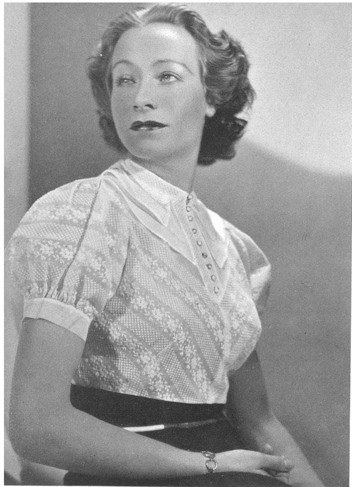
Blouse de linon brodé accompagnant un tailleur. Jane, Paris.

Les broderies étincelantes qui enrichissent seulement les robes du soir sont maintenant utilisées pour les robes plus simples, sur lesquelles les paillettes jettent des scintillements d'étoiles. Beaucoup de broderies métalliques, non seulement or, mais cuivre et acier.