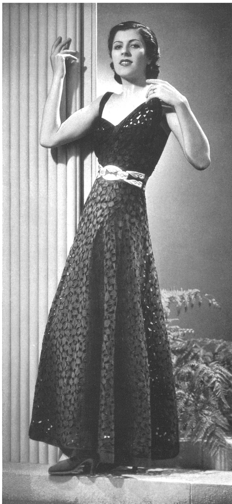
« Clairvoie » — Robe de dîner en broderie de St-Gall noire, ceinture de peau d'or et pierres de couleur. Modèle de Robert Piguet, Paris.