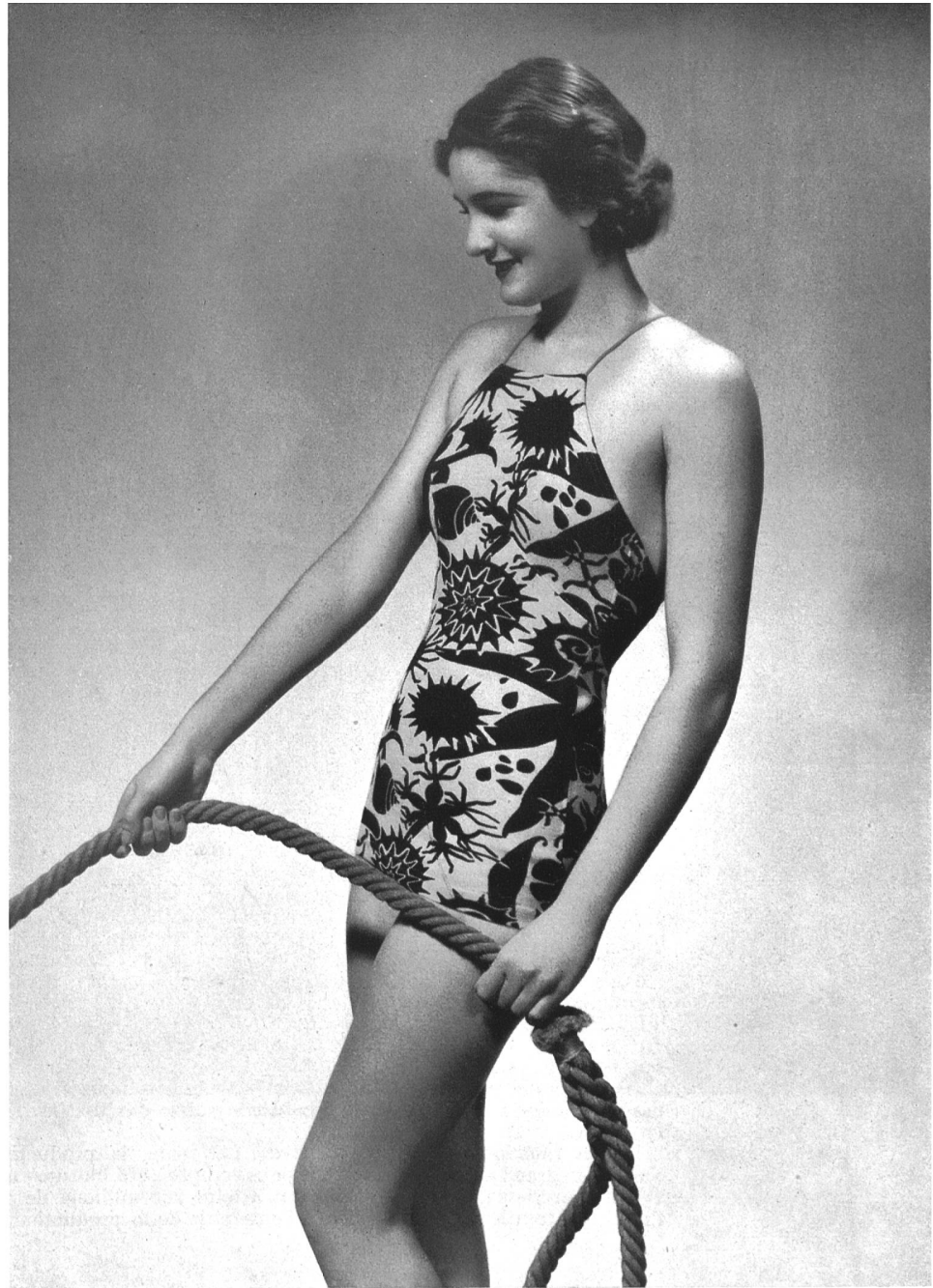
Modèle « Nabholz-Perfecta » de Nabholz S. A., Schö- nenwerd.

Pour l'hiver, nous avons toujours ces agréables sous-vêtements en tricot, chauds et cependant légers. La chemise, le pantalon, ou bien ces deux réunis en une pièce, révèlent cette année une certaine recherche dans les détails ; comme on le voit sur la photo ci-contre, l'empiecement est presque toujours en forme de soutien-gorge ; le point de fantaisie, imitant la dentelle, a rendu plus coquette cette parure pourtant sommaire ; la taille est cintrée par un point de côté. La chemise de nuit en tricot est l'objet de plus de recherches ; on ne lui demande pas, comme au sous-vêtement, d'être plate et simple. Alors les fabricants s'ingénient à les rendre de plus en plus tentantes : des volants, des fronces, des points qui varient avec chaque modèle, des formes très habillées, voilà ce qu'on nous offre à présent.