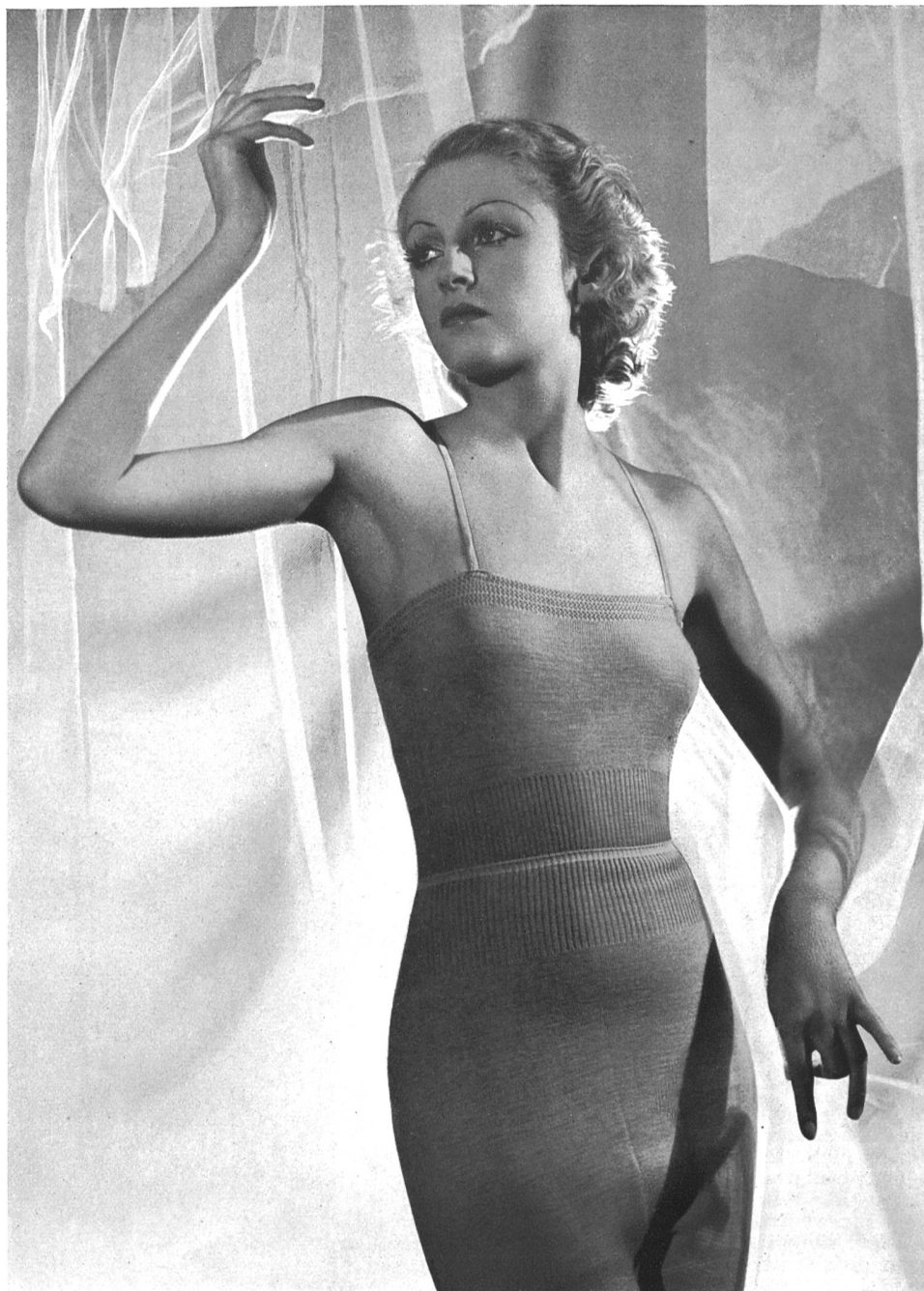
Modèle « Hisco » de His & C ie S.A., Mur- genthal.

Le tricot règne sur la mode. Alors qu'hier il n'était destiné qu'aux modèles de sport, qu'on ne lui demandait que d'être pratique, il entre aujourd'hui dans la haute couture dans des proportions surprenantes. Les filatures et les retorderies ont rivalisé d'ingéniosité dans la création des nouveaux fils à tricoter : bouclés, câblés, auxquels viennent s'ajouter les laines mélangées à la soie, aux poils d'angora, de chèvre et de cygne. La laine mêlée de certains fils métalliques est très demandée pour les tricots de fantaisie. Ce que l'on découvre, c'est la ferme intention des fabricants suisses d'encourager, par ces nouveautés, une mode aussi intelligente. En effet, si vous recourez au costume de tricot, ce dont vous n'aurez qu'à vous louer, il suffit de jeter un coup d'œil sur les dernières créations pour constater que les couturiers se sont lancés sur cette précieuse matière.