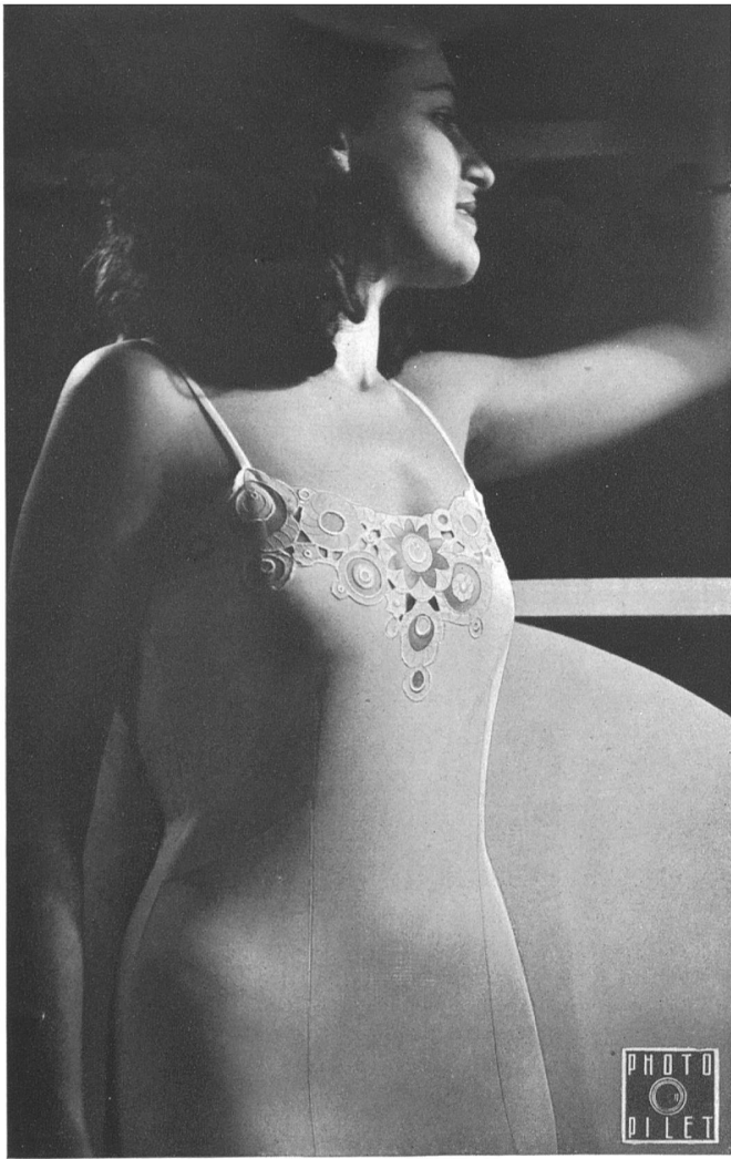
Modèle « Opaline » de A. Naegeli S. A., Winterthur.

layette en tricot, qui laisse aux enfants toute liberté de mouvements, tout en les habillant chaudement, jusqu'à la charmante robe de petite fille, simple, nette, qu'un petit col de broderie de laine rehausse d'un ton vif.