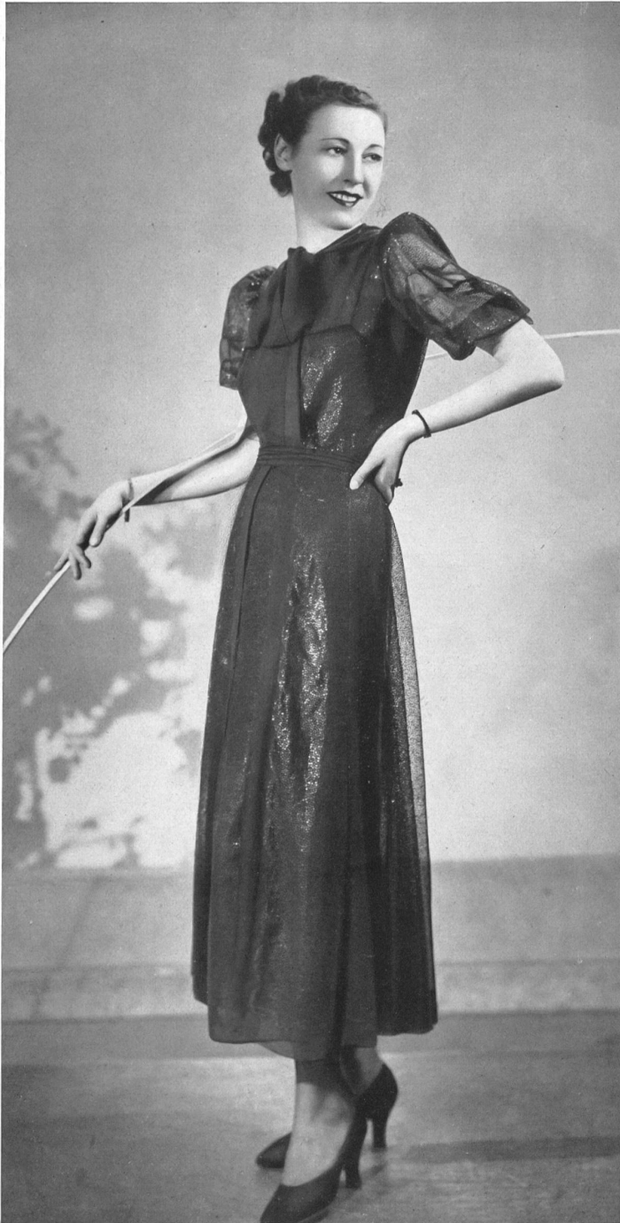
Robe d'Agnès Drecoll. Guipure cirée bleu marine, d'Union S. A., St-Gall.

Les dentelles plus fines et légères se traitent, elles, un peu comme le tulle. Mètres et mètres forment la vaste cloche en forme aux multiples godets faisant valoir la taille fine, serrée dans d'étroites ceintures brillantes.