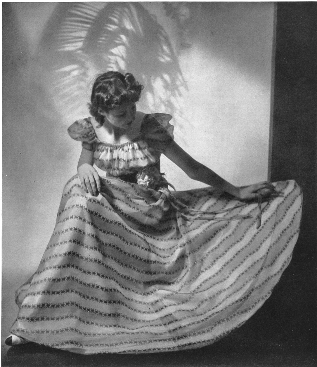
Modèle Willy Meyer, Zurich.

Voici maintenant les robes du soir. Elles sont longues, amples, la partie supérieure collante. Et ensuite les manteaux de dames à la fabrication desquels se consacrent plusieurs maisons suisses qui méritent également une mention. Pour le printemps, on prépare des manteaux de laine légers, en tissus souples. Ces manteaux sont souvent sans col, parfois même sans revers ou avec des revers très courts.