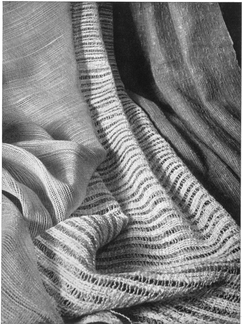
Tissus lin des Fils de Baumann-Grutter, Langenthal.