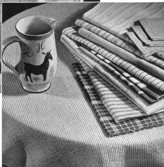
Modèles de Worb & Scheitlin S. A., Burgdorf.