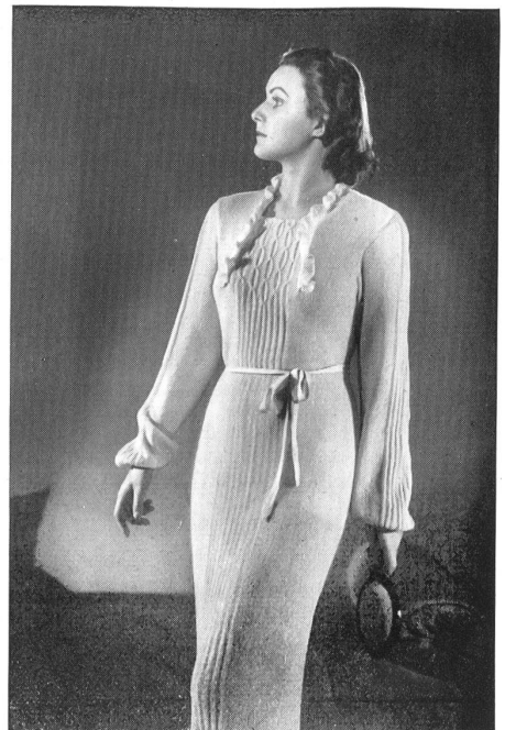
Modèle des Tricotages Zimmerli & Cie. S. A., Aarbourg.

Pour cet usage les étoffes employées sont souples, belles et lourdes; leur résistance et leur matière infroissable les rendent pratiques et absolument indispensables.