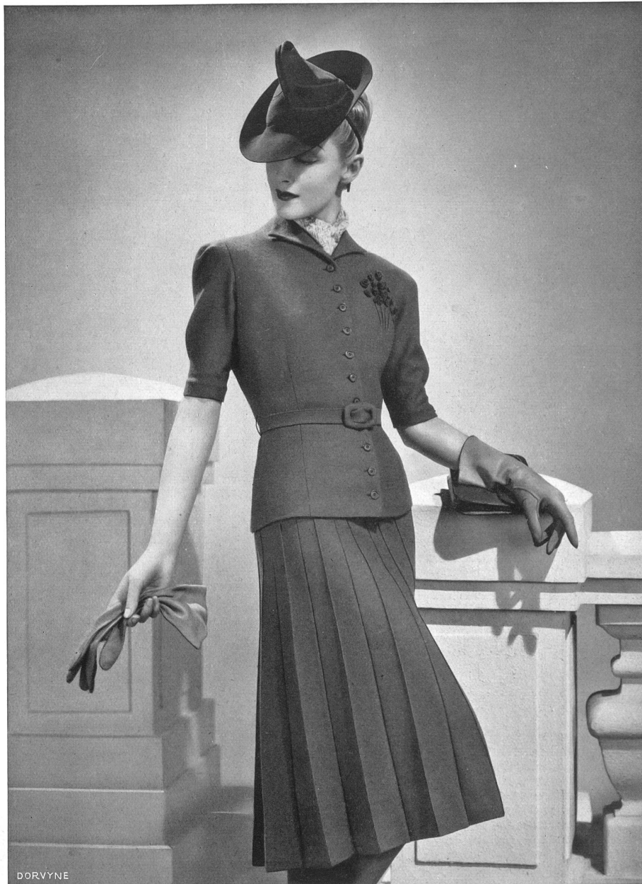
Tailleur „ISA“ de Jos. Sallmann & Cie., Amriswil.

Les garnitures les plus diverses sont à l'ordre du jour: empiècements de piqué blanc, broderies, applications de tons contrastants, bords dentelés ou à nervures. Des boutons de paille tressée, de porcelaine peinte, ferment les redingotes sous lesquelles se jouent les jupes festonnées de couleur.