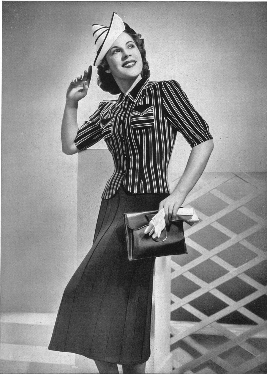
Gillover et Jupe „ALPINIT“ de Ruepp & Cie. S. A., Sarmenstorf.

Les ensembles et tailleurs exécutés avec ces tissus mettent leur note amusante et fraîche sur toutes les rives ensoleillées, dans les paysages riants et, en général, partout où se manifestent la joie et l'exubérance de la jeunesse.