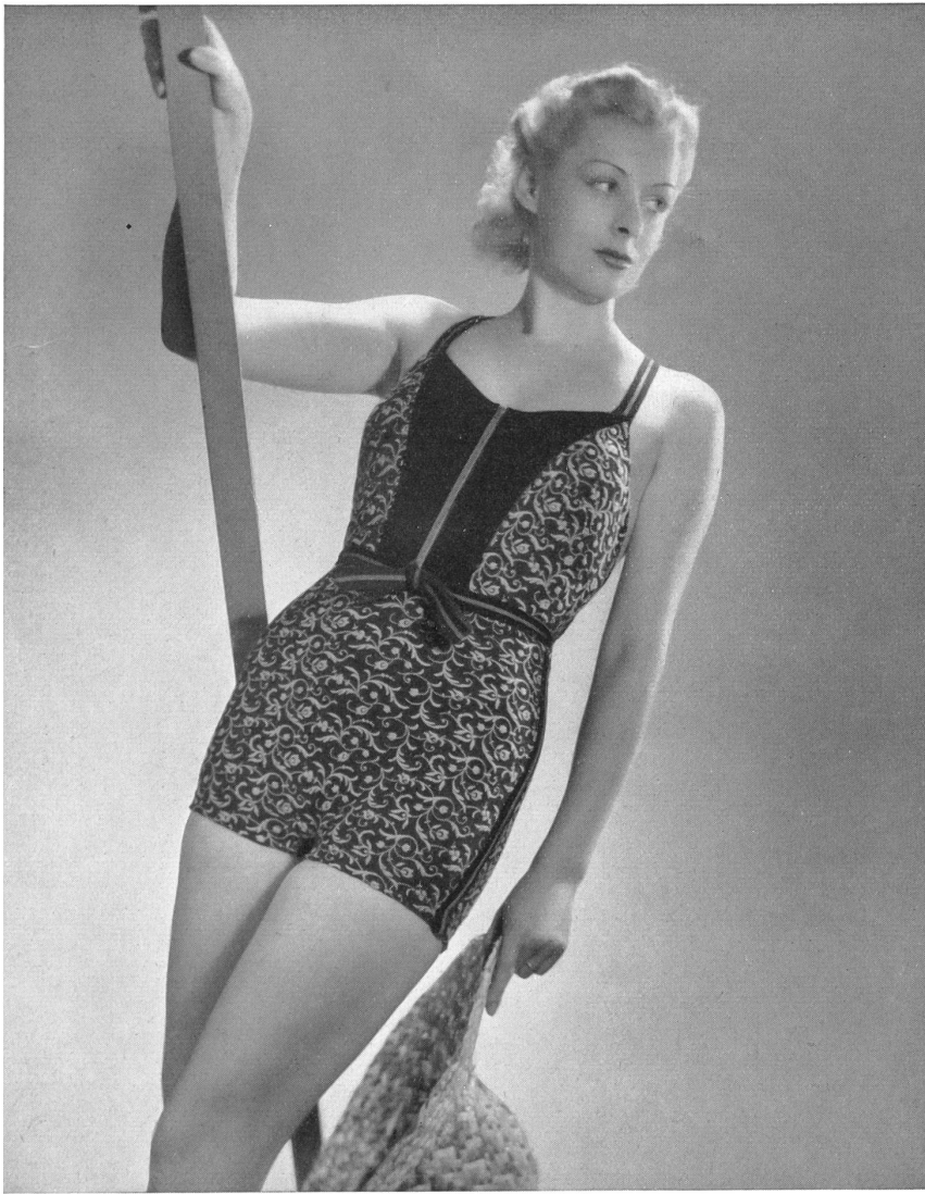
Modèle „NABHOLZ-PERFECTA“ des Tricotages mécaniques Nabholz S. A., Schönenwerd.

Des capes enveloppantes et souples se doublent de couleur vive s'harmonisant avec l'ensemble. Ce détail leur donne une note originale et très personnelle.