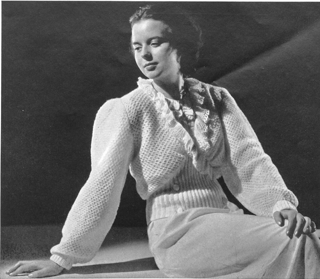
Liseuse tricot main de Peter Merz & Cie., Arlesheim.

Des jupes finement plissées s'accompagnent de vestes ajustées, rayées ou unies; les robes évasées s'agrémentent de boléros très courts sous lesquels se nouent de hautes ceintures drapées.