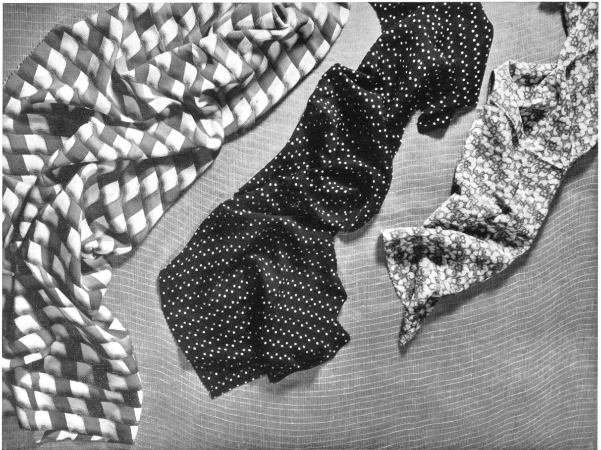
Tissus rayonne de Haas & Cie, Zurich.

La meilleure preuve de perfection de ces articles, de leur valeur commerciale et de leur adaptation aux exigences de la mode, est le fait que leur exportation est en augmentation constante, malgré les difficultés actuelles du commerce extérieur. Dans la dure bataille pour les marchés étrangers et malgré la concurrence redoutable des grands pays, les produits suisses réussissent à s'imposer, faisant ainsi une démonstration éclatante de leur qualité.