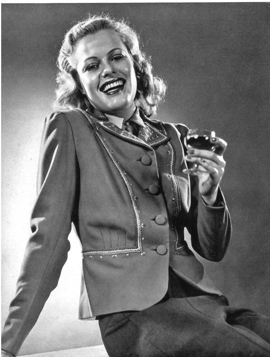
Jaquette « Cocktail » de Jacob Scherrer, Romanshorn.