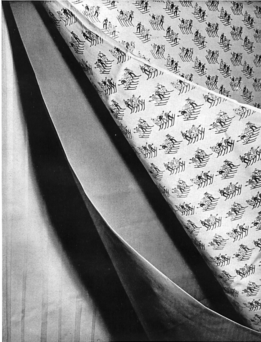
Popelines imprimées et imprégnées de Winzeler, Ott & Cie S. A., Weinfelden.

Pour la confection des blouses de ski, par exemple, les popelines tendent à remplacer complètement les étoffes de laine plus lourdes. Ce sont des tissus serrés et lisses offrant un maximum d'imper-