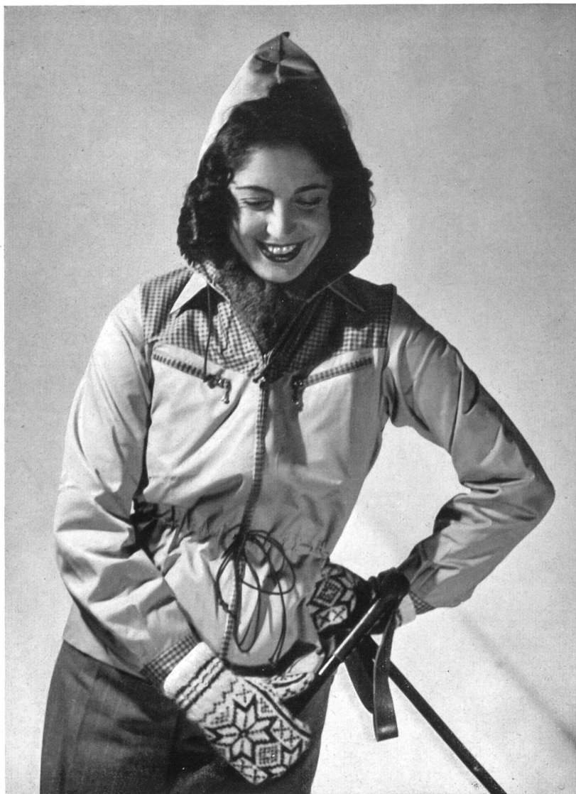
Blouse FIS-fantaisie « Protector » de la S. A. Gust. Metzger, Bâle.

Les pantalons de ski, à fermeture éclair, sont en gabardine imperméable. Le modèle « Sauteur » (Vorlager), serré à la cheville, est le préféré de la skieuse expérimentée, tandis que la débutante portera son choix sur le « plus-four » qui donne plus