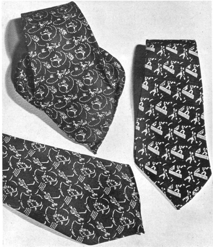
Cravates de soie avec motifs sportifs. Création de E. Vonwiller, Zurich.