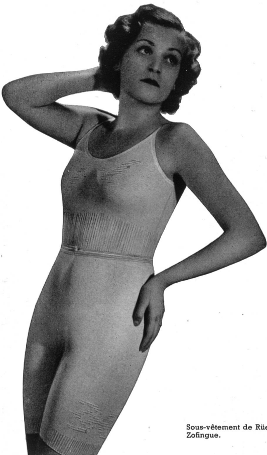
Sous-vêtement de Rüegger & Cie, Zofingue.

La mode qui influence les moindres détails de toilette, ne saurait s'accommoder d'une élégance omnibus aussi faut-il toujours être en harmonie de couleurs et assortir ses dessous aux robes, aux gaines.