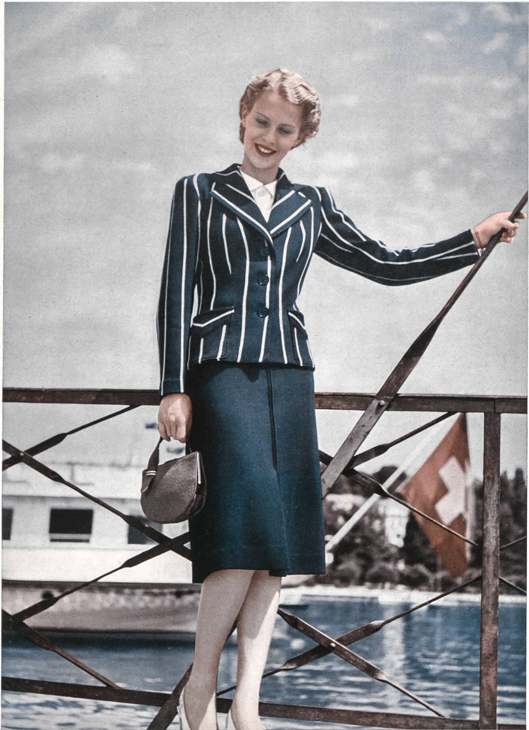
Tailleur « Heimsweaters » de S. Heim Fils S. A., Baden.

les rendent exquises à porter, le corps étant maintenu sans aucune pression gênante.