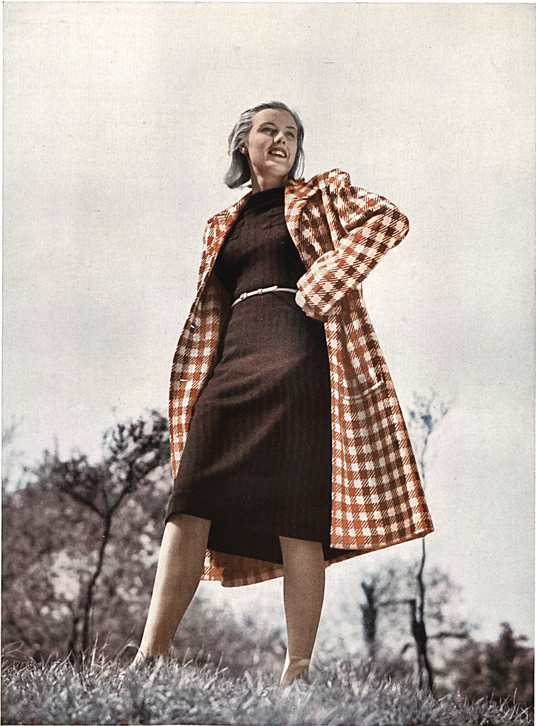
Robe et manteau « Alpinit » de Ruepp & Cie S. A., Sarmenstorf.

A CTUELLEMENT, dans le domaine de l'élégance féminine et peut-être plus aujourd'hui qu'hier, le rôle des jerseys est d'une importance capitale.