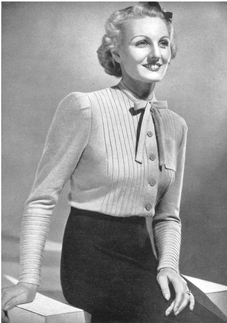
Modèle « Rovo » de Vollmöller, Uster-Zurich.