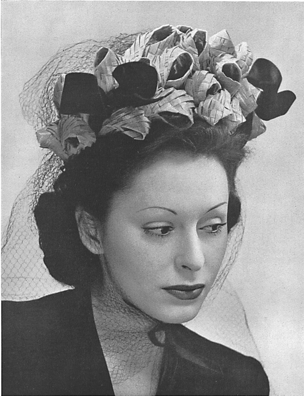
Otto Steinmann & Cie S. A., Wohlen. Tresse N° 4680 en « OSCOLINA ».